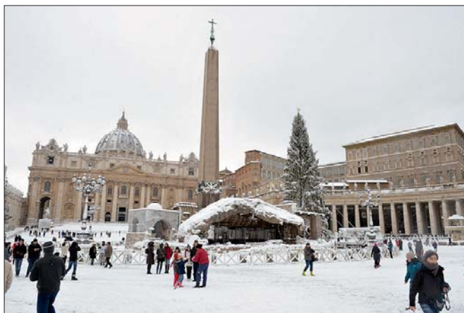
Vor einer ungewohnten Kulisse hat Papst Benedikt XVI. am 5. Februar das Angelusgebet gesprochen. Im weißen Wintermantel trat Papst Benedikt XVI. an das Fenster seines Arbeitszimmers und begrüßte mehrere tausend Gläubige, die sich trotz Schnee und klirrender Kälte mit Minus-Temperaturen auf dem Petersplatz versammelt hatten.

Eines Tages sagte Jesus: »Nicht die Gesunden brauchen den Arzt, sondern die Kranken« (Mk 2,17). Bei jener Gelegenheit bezog er sich auf die Sünder, die zu ruhen und zu retten er gekommen ist. Wahr jedoch bleibt, daß die Krankheit ein typisch menschlicher Zustand ist, in dem wir die starke Erfahrung machen, daß wir uns nicht selbst genügen, sondern die anderen brauchen. In diesem Sinn könnten wir mit einem Paradox sagen, daß die Krankheit ein heilbringender Augenblick sein kann, in dem es möglich ist, die Aufmerksamkeit der anderen zu erfahren und den anderen Aufmerksamkeit zu schenken! Dennoch ist sie immer auch eine Prüfung, die auch lange und schwer werden kann. Wenn die Heilung nicht eintritt und die Leiden andauern, können wir wie erdrückt, isoliert sein, und so wird unser Leben mutlos und entmenslicht. Wie sollen wir auf diesen Angriff des Bösen reagieren? Gewiß mit angemessenen Behandlungen – die Medizin hat in den vergangenen Jahrzehnten Riesenschritte gemacht, wofür wir dankbar sind –, doch das Wort Gottes lehrt uns, daß da eine entscheidende Grundhaltung ist, mit der wir der Krankheit begegnen müssen, und diese ist die Haltung des Glaubens an Gott, an seine Güte. Jesus wiederholt dies immer gegenüber den Menschen, die er heilt: Dein Glaube hat dir geholfen (vgl. Mk 5,34.36). Sogar angesichts des Todes kann der Glaube das möglich machen, was