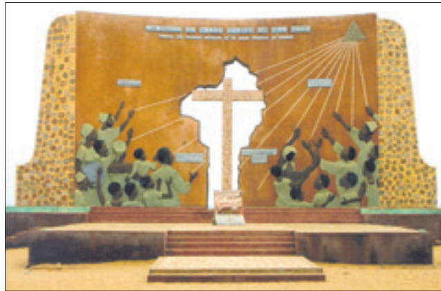
La «Porte du salut» sur la plage d'Ouidah

Commençons par le motif de ce voyage apostolique, le vingt-deuxième au-delà des frontières italiennes depuis le début du pontificat, le deuxième en Afrique. Le Pape va au Bénin pour reprendre le discours engagé à Yaoundé en 2009. Un discours qui est surtout théologique et pastoral, et qui implique donc tous les pasteurs du grand continent noir et qui concerne l'avenir de cette Ecclésia in Africa telle que l'avait dessinée Jean-Paul II au terme de la première assemblée spéciale pour l'Afrique du synode des évêques au