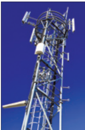
Congrès au Vatican