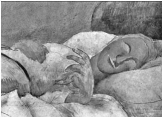
Roger de La Fresnaye, «La malade» (Musée d'art moderne de la ville de Paris)

di LUCETTA SCARAFFIA I medici hanno confiscato il dibattito sulla morte - ha dichiarato a «Le Monde» il presidente emerito del comitato francese di bioetica Didier Sicard - e questo non è un bene, perché la riflessione su questo tema deve essere più ampia e profonda. Si è data la parola ai medici per sfuggire al peso delle contrapposizioni ideologiche, che hanno avvelenato il dibattito trasformandolo in una sterile contesa, ma questo ha provocato una riduzione sbagliata della questione. E non solo in Francia: anche in Italia il conflitto fra «progressisti», a favore dell'eutanasia, e «conservatori», cattolici, che si schierano contro è spesso mascherato dal ricorso a medici che accampano ragioni sanitarie per rafforzare i diversi punti di vista.