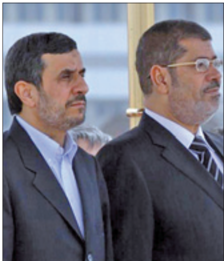
Il presidente iraniano e quello egiziano

Una dura critica al regime di Bashar Al Assad è giunta dall'Oci. Nella bozza del documento finale si addossa al Governo tutta la responsabilità delle violenze e si sollecita Damasco ad avviare un dialogo serio con l'opposizione. Sul terreno, le violenze non conoscono tregua. Gli attivisti segnalano bombardamenti dell'esercito a Damasco e ad Aleppo. Nuovi scontri sono segnalati oggi a Homs, Daraa, Latakia e nella provincia di Idlib. L'Oci ha annunciato che da aprile saranno distribuiti nuovi aiuti a 2,5 milioni di siriani in difficoltà e rifugiatisi nei Paesi vicini.