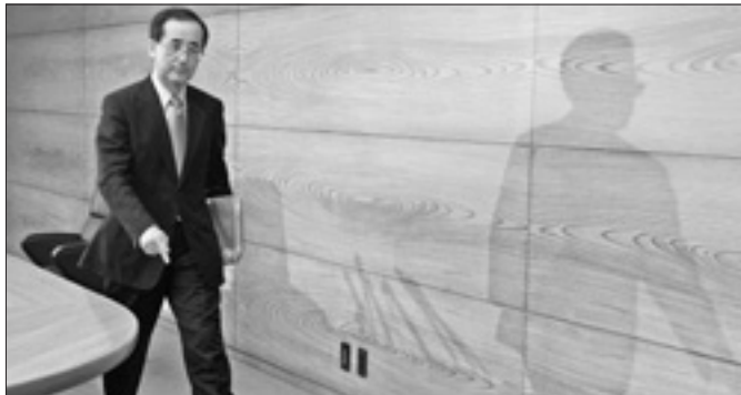
Masaaki Shirakawa, governatore dimissionario della banca del Giappone

Intanto, sul fronte borsistico, Tokyo ha chiuso oggi in rally la seduta con un balzo del 3,77 per cento, ai massimi da settembre del 2008, ovvero dallo scoppio della crisi finanziaria con il crack di Lehman Brothers. L'indice Nikkei, in scia alle dimissioni anticipate del governatore e al rapido calo dello yen, è salito di 46,83 punti, a 11.493,75.