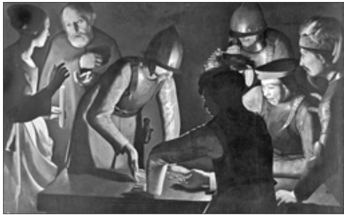
Georges De La Tour, «Il rinnegamento di Pietro» (1650)

Concludendo il suo intervento all'inaugurazione della mostra il cardinale si è rivolto ai non creden-