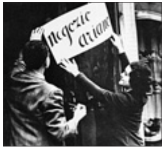
L'affissione di un manifesto «filosoviano» a Roma, nel 1938

L'adozione della politica antisemita in Italia fu vista come un segnale inequivocabile dell'avvicinamento, anche ideologico, del fascismo al nazismo. Anche per questo motivo Pio XI fece intendere, in più occasioni, la sua contrarietà all'alleanza tra l'Italia e la Germania. E «L'Osservatore Romano» pubblicò, nel corso del 1938, numerosi articoli contro il razzismo nazista, alcuni a firma di autorevoli cardinali re-