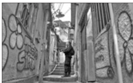
Operazione di polizia in una favela brasiliana

Anche in questa occasione, all'origine dei gravi episodi sembrano essere alcuni detenuti, dai quali partirebbero gli ordini di attacco. I detenuti si oppongono a trasferimenti di