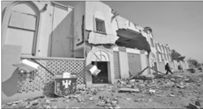
Edifici lesionati dai combattimenti a Gao

Il Governo di Parigi riferisce che nell'offensiva delle sue truppe nel nord del Mali sono stati uccisi centinaia di combattenti jihadisti, mentre tra le proprie forze c'è stata una sola vittima. Al tempo stesso, il ministro degli Esteri francese, Laurent Fabius, ha dichiarato che il numero