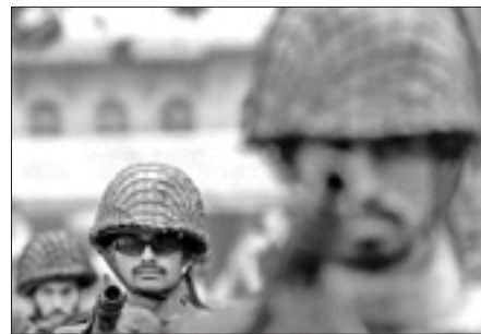
Militari pakistani schierati a Karachi

Sempre riguardo alla situazione in Afghanistan, si segnala che il presidente Hamid Karzai è a Oslo per colloqui con le autorità norvegesi per la firma di un accordo di partenariato strategico. Dal 2009 la Norvegia partecipa alla missione delle forze della coalizione in Afghanistan. Attualmente sono dispiegati 97 soldati.