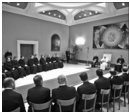
Il Papa con i membri dell'assemblea generale della fraternità sacerdotale dei missionari di san Carlo Borromeo riuniti al termine dell'udienza generale

Nato il 21 luglio 1961 nella città di Silvianópolis, arcidiocesi di Pouso Alegre, Minas Gerais. Dopo aver compiuto gli studi universitari ha ricevuto l'ordinazione sacerdotale il 21 maggio 1988. È stato parroco dell'Imaculada Coração de Maria a Rio de Janeiro; di Nossa Senhora do Perpétuo Socorro a Taguatinga, arcidiocesi di Brasília e attualmente era parroco dell'Imaculada Coração de Maria a Brasília.