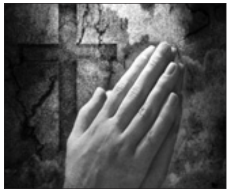
Invito degli anglicani al rispetto del creato

Soddisfazione per l'esito del dialogo e per le prospettive future è stata espressa dall'arcivescovo Gregory che ha presieduto il comitato per le questioni ecumeniche e inter-religiose della Conferenza episcopale degli Stati Uniti. «Il nostro lavoro insieme — ha concluso il presule — è stato e sarà al servizio di tutte le comunità cristiane in modi che non possiamo prevedere. Lo Spirito Santo continua a guidarci in ogni modo, nel momento in cui il dialogo ha raggiunto un accordo comune sul significato del battesimo».