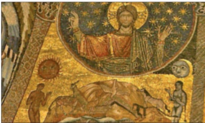
Battistero di San Giovanni a Firenze, mosaico che raffigura la creazione degli elementi (particolare)

È sempre questo il «nocciolo della tentazione»: considerare l'alleanza con Dio come «una catena che lega, che priva della libertà e delle cose più belle e preziose della vita». Ma è proprio questa convinzione, questa «mentozogna» come la chiama il Pontefice, che «falsa il rapporto con Dio» e che induce l'uomo a mettersi al suo posto. Da ciò discende che quanto Dio aveva creato di buono «anzi - ha specificato il Papa - di molto buono», dopo la libera scelta dell'uomo a favore della menzogna e contro la verità, «il male entra nel mondo», con tutto il suo bagaglio di dolori e sofferenze. E citando ancora la Genesi il Pontefice ha voluto evidenziare un altro insegnamento offerto dal libro dei racconti della creazione: «il peccato - ha detto - genera peccato e tutti i peccati della storia sono legati tra di loro». Tutto