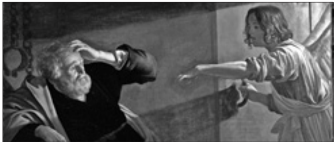
Gerrit van Honthorst, «L'angelo libera Pietro dal carcere» (1650 circa)

Quaranta opere, che spaziano da Oriente a Occidente, ripercorrono la storia della cristianità dal IV al XX secolo, in un allestimento concepito per coinvolgere dinamicamente il gusto per la bellezza, il bisogno della riflessione e la forza delle emozioni. In esposizione dipinti e sculture di artisti d'eccezione come Lorenzo Veneziano, Vitale da Bologna, Marco Basaiti, Garofalo, Jan Brueghel, Giorgio Vasari, Georges de La Tour, Guercino, Gerrit van Honthorst, Dirk Van Baburen, Luca Giordano, Mattia Preti, Guido Reni, Vasilij Dmitrievic Polenov, Eugène Burnand. Alle opere si intrecciano inoltre proiezioni cinematografiche, apparizioni che a tratti vengono accompagnate da brani musicali scelti per completare il senso del racconto. Diversi sono gli inediti che costituiscono un ulteriore motivo di interesse per il visitatore, così come la possibilità di ammirare opere che per la prima volta vengono spostate dal loro abituale luogo di conservazione.