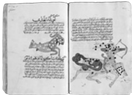
Pagine da «Le meraviglie delle creature e le stranezze degli esseri» di Zakariyya al-Qazwini (XIII secolo)

La mostra, visitabile fino al 22 giugno, conferma i ruoli - fondamentali e complementari - che nel Rinascimento ebbero Roma, con il papato, e Firenze, con il granduca, nel diffondere e preservare la produzione di volumi del Vicino Oriente (fossero religiosi, artistici oppure scientifici), poiché patrimonio di inestimabile valore culturale da tramandare alle generazioni future.