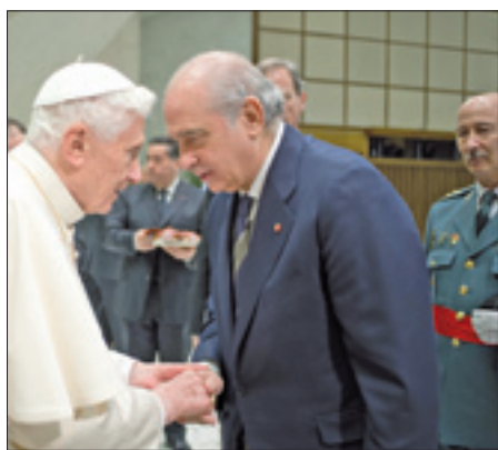
Il Papa saluta il ministro degli Interni della Spagna, Jorge Fernández Díaz.

Nei primi capitoli del Libro della Genesi troviamo due immagini significative: il giardino con l'albero della conoscenza del bene e del male e il serpente (cfr. 2, 15-17; 3, 1-5). Il giardino ci dice che la realtà in cui Dio ha posto l'essere umano non è una foresta selvaggia, ma luogo che protegge, nutre e sostiene; e l'uomo deve riconoscere il mondo non come proprietà da saccheggiare e da sfruttare, ma come dono del Creatore, segno della sua volontà salvifica, dono da coltivare e custodire, da far crescere e sviluppare nel rispetto, nell'armonia, seguendone i ritmi e la logica, secondo il disegno di Dio (cfr. Gen 2, 8-15). Poi, il serpente è una figura che deriva dai culti orientali della fecondità, che affascinavano Israele e costituivano una costante tentazione di abbandonare la misteriosa alleanza con Dio. Alla luce di questo, la Sacra Scrittura presenta la tentazione che subiscono Adamo ed Eva come il nocciolo della tentazione e del peccato. Che cosa dice infatti il serpente? Non nega Dio, ma insinua una domanda subdola: «È vero che Dio ha detto "Non dovete mangiare di alcun albero del