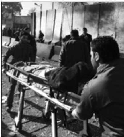
I soccorsi a una vittima di uno degli attacchi terroristici

BAGHDAD, 8. Sono quattro le autobomba esplose questa mattina in Iraq, per un bilancio di almeno 29 morti e 85 feriti nell'ennesima ondata di attentati dinamitardi contro la comunità sciita: lo hanno riferito fonti ospedaliere, e la notizia è stata poi confermata dal ministero dell'Interno. Il complotto più pesante si è registrato nella capitale Baghdad, dove nel giro di pochi minuti sono esplose due autobombe nel quartiere settentrionale di Al Kadhimiyah, a maggioranza sciita; presso di mira un mercato dove si vendono uccelli e altri piccoli ani-