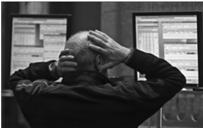
Un investitore nella Borsa di Madrid

«Spero che la mia missione — ha affermato Barnier — consenta di realizzare sostanziali progressi verso un sistema in cui l'Unione europea e gli Stati Uniti riconoscano che le rispettive regole hanno effetti equivalenti». Le nuove norme, del resto, puntano proprio a impedire che le transazioni finanziarie sui derivati sfuggano ai dovuti controlli attraverso operazioni al di fuori dei mercati. Il periodo per la liquidazione e il regolamento delle operazioni sui titoli non dovrà superare i due giorni lavorativi da quello in cui è stato effettuato il trading. Per le piccole e medie imprese è stata introdotta più flessibilità, con un periodo di quindici giorni, in cui saranno esentate dal pagamento di sanzioni se non avviene l'operazione di regolamento dei titoli. Parallelamente i depositari centrali di strumenti finanziari potranno fornire servizi bancari utilizzando la stessa entità legale, ma dovranno rispettare condizioni prudenziali ulteriori, avere capitale aggiuntivo e ricevere l'autorizzazione per la licenza bancaria.