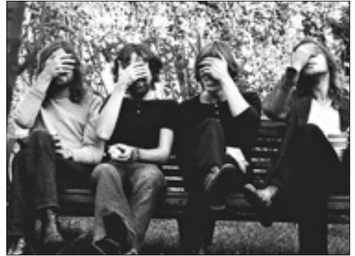
Dalle foto scattate per l'album «The Dark Side of the Moon» (1973)

tina del volume Pink Floyd (Mila- no, 24 Ore cultura, 2012, pagine 62, euro 35) – è in realtà solo l'ennesima raccolta di foto e testi più o meno inediti sulla band. Ma è appunto dotata di una serie di allegati, come l'invito al ballo di Oxford, che possono risultare interessanti perché rivelano un mondo ormai sparito.