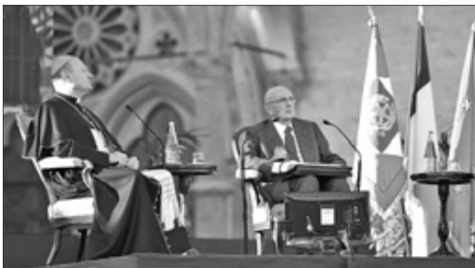
Il colloquio tra il cardinale Ravasi e il presidente Napolitano ad Assisi per il Cortile dei genitili (5 ottobre 2012)

Ai titoli raccolti in oltre sessanta pagine bisogna ora aggiungere il dialogo svolto ad Assisi lo scorso 5 ottobre tra il presidente Napolitano e il porporato con Ferruccio de Bortoli, appena pubblicato dal Corriere della Sera in un bel volume appena uscito e intitolato Il Dio ignoto .