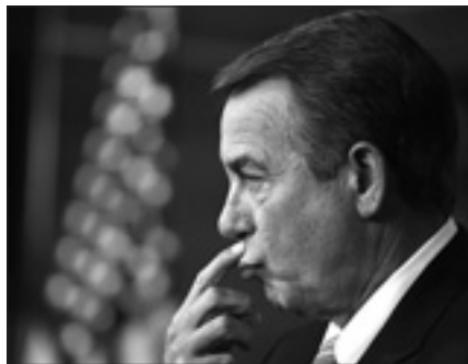
Lo speaker repubblicano alla Camera dei rappresentanti, John Boehner

Il capo della Casa Bianca ha sostenuto che il pacchetto di tagli alla spesa e di riforme fiscali, concordate con lo speaker repubblicano alla Camera dei rappresentanti, John Boehner, «sono ancora sul tavolo» e ha confermato di voler raggiungere la concordata riduzione di quattromila miliardi di dollari di deficit. «L'economia americana ha imboccato la giusta direzione e non ha bisogno in questa fase di provvedimenti autopunitivi inflitti da Washington» ha dichiarato il capo della Casa Bianca, secondo cui sarebbe molto più opportuna ed efficace «una giusta miscela di tagli e riforme fiscali». Nel ricordare che la crisi continua a far sentire i suoi effetti, Obama ha evidenziato che nel momento della ripresa provvedimenti troppo drastici potrebbero sortire effetti nocivi.