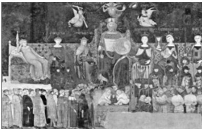
Particolare della «Allegoria del buon governo» di Ambrogio Lorenzetti (1338-1339)

In effetti, non spiega molto, e non ha mai spiegato molto, la formula che a suo tempo diventò di moda: "la fine (o la morte) delle ideologie". Anche perché l'attenzione si concentrò, comprensibilmente, sul crollo di una ideologia: quella comunista, travolta nel collasso dei regimi che a essa si ispiravano, in Europa centro-orientale e in Unione Sovietica. Molto più limitata, e sfuggente, rimase ed è rimasta la rivisitazione – e la stessa r-i-d-ef-in-i-z-i-o-n-e – dell'ideologia che si era contrapposta a quella comunista: ideologia del libero mercato, ovvero di uno sviluppo capitalistico affidato al libero gioco delle forze di mercato? O ideologia delle istituzioni liberal-democratiche del-