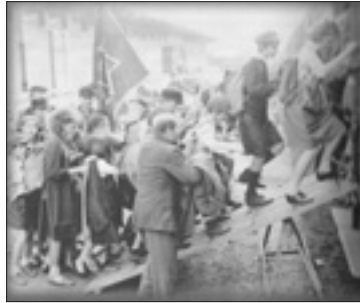
Korczak sale con i bambini sul treno che li porterà a Treblinka

Il filosofo israeliano Moshe Shiner, che al pedagogo polacco ha dedicato il libro Janusz Korczak and Itzhak Katzenelson. Two Educators in the Abysses of History , non si sottrae alla domanda sull'eredità di una vita e di un pensiero tanto articolati: «Korczak è una sfida per noi – spiega – ma io credo che la sua idea fondamentale sia quella che, attorno all'educazione, gente rivale si può unire. In questo tempo segnato da divisioni così profonde, noi abbiamo bisogno di una nuova fede che unisca tutti i popoli del mondo attorno alla causa dei bambini. Il mondo, e in particolare la terra di Palestina, che lui tanto amava, hanno un bisogno disperato dell'idea di educazione di Korczak, basata sulla solidarietà umana, un'educazione che non spinga ad abbandonare le rispettive identità, ma a trovare quello che può unire i popoli. La storia di Korczak è finita tragicamente. Possiamo dire che abbia fallito e lui stesso scrisse, poco prima della morte: "Ormai sono inutile". Ma se il ventesimo secolo ha fallito nel seguire la sua visione, dobbiamo essere convinti che il ventesimo sarà in grado di farlo».