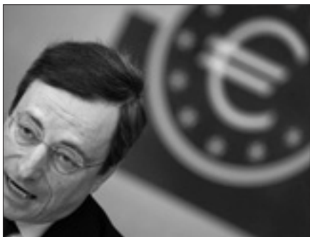
Il presidente della Bce

Draghi ha però spiegato che, secondo i calcoli della Bce, anche dopo l'avvio nelle prossime settimane dei rimborsi della seconda operazione, il sistema dovrebbe continuare ad avere liquidità in eccesso sopra i duecento miliardi di euro. Il problema, ha rilevato il presidente della Bce, è la mancata trasmissione del miglioramento dei mercati finanziari negli ultimi sei mesi alla disponibilità e al costo di credito soprattutto alle piccole e medie imprese. Un problema che sarebbe dettato principalmente dalla debolezza delle domanda. «La debolezza dei flussi di credito è un segnale che la situazione rimane fragile» ha affermato il presidente della Banca centrale europea.