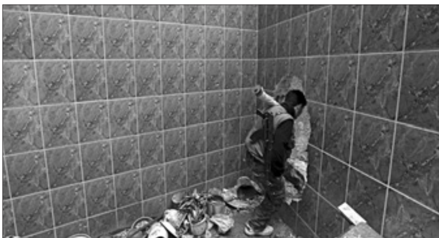
Un combattente in un'abitazione abbandonata a Damasco

Sempre ieri, si è appreso che il Qatar, protagonista negli ultimi anni di diversi tentativi di mediazione tra Khartoum e i ribelli del Jem e di altri gruppi, ospiterà una conferenza sul Darfur ad aprile.