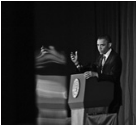
Il presidente degli Stati Uniti

WASHINGTON, 1. La Casa Bianca accelera sul debito e sui tagli alla spesa. Il presidente statunitense, Barack Obama, ha convocato per oggi, venerdì, un vertice con i leader del Congresso. L'obiettivo è quello di raggiungere un'intesa che possa dare corpo alla fragile ripresa. «Credo che dobbiamo fare meglio; dobbiamo lavorare assieme per ridurre il nostro deficit, chiudendo le scappatoie fiscali, esattamente il tipo di piano proposto dai democratici al Senato» ha detto Obama.