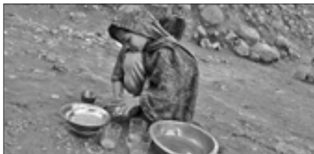
Una bambina pakistana

Da parte sua, la responsabile del programma di sviluppo dell'Onu, Helen Clark, ha posto l'accento sui risultati ottenuti dai Paesi dell'Asia orientale, in particolare la Cina, e dell'America latina dove ci sono stati progressi ineccepibili per quella che era considerata la regione del mondo con più disuguaglianze. Clark ha però sottolineato che per altri obiettivi vi è stato fatto troppo poco, citando soprattutto l'accesso alla sanità e la riduzione della mortalità materna e infantile.