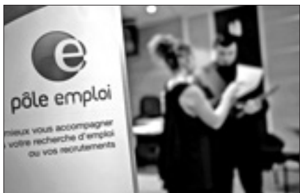
Un ufficio di collocamento francese

BRUXELLES, 1. L'Unione europea cerca di accelerare l'attuazione dello schema di garanzie per i giovani proposto dalla Commissione europea per combattere la disoccupazione e il fenomeno dei cosiddetti Neet (Not in Education, Employment or Training), i giovani che non lavorano, non studiano e non si formano. Un primo assenso alle proposte avanzate tre mesi fa dalla Commissione è venuto ieri dai ministri del Lavoro, che hanno adottato un approccio comune a favore dell'istituzione del nuovo meccanismo, in attesa del via libera formale in primavera.