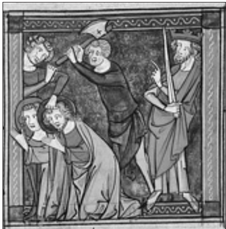
«Martirio dei santi Feliciano e Primo» ( Legenda aurea , codice francese del XIV secolo)

Alcune pagine sono dedicate allo statuto istituzionale della Legenda , che secondo Le Goff era un testo adottato all'interno dell'ordine domenicano, nei conventi, nelle scuole dell'ordine ( studia ), nella stessa università, che tuttavia Genova ancora non vantava.