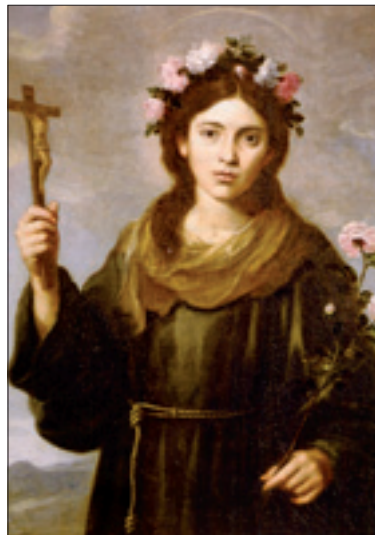
Bartolomé Estéban Murillo, «Santa Rosa da Viterbo» (XVII secolo)