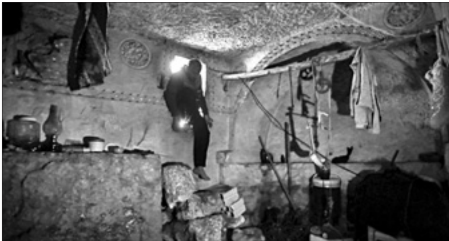
Un'antica tomba di epoca romana usata come rifugio dai combattenti nella provincia di Idlib

NAYPYIDAW, 1. Scontri fra agricoltori e polizia hanno provocato ieri un morto e numerosi feriti a Maubin, nella regione del Delta dell'Irrawaddy, in Myanmar. Lo riferisce la stampa locale, precisando che gli scontri sono collegati a un caso di appropriazione di terre agricole reclamate indietro dai contadini. I dimostranti chiedono la restituzione di circa 200 ettari di terra a loro sottratti durante il regime militare. Dimostrazioni analoghe si sono tenute negli ultimi due anni in diverse zone del Paese. Ieri, però, un poliziotto è rimasto ucciso e decine tra manifestanti e agenti risultano feriti. Benché dal 2011 il Myanmar sia formalmente retto da un Governo civile, i militari continuano a essere presenti in tutti i settori della vita politica ed economica del Paese del sud est asiatico.