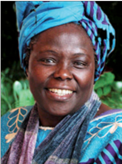
Un ricordo della kenyota Wangari Maathai