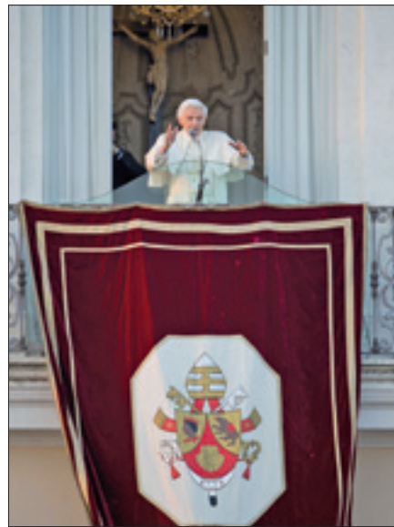
A Castel Gandolfo le ultime immagini del pontificato di Benedetto XVI