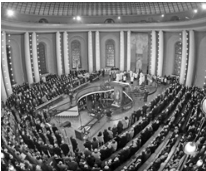
Un momento della messa in omaggio a Benedetto XVI nella cattedrale di Santa Edvige a Berlino

Anche il sito della Santa Sede www.vatican.va ha voluto dedicare un omaggio al pontificato di Benedetto XVI. Lo ha fatto con un album fotografico on line di 62 pagine, al quale si può accedere dalla home page del sito nelle versioni tedesca, inglese, spagnola, francese, italiana e portoghese. Si tratta di