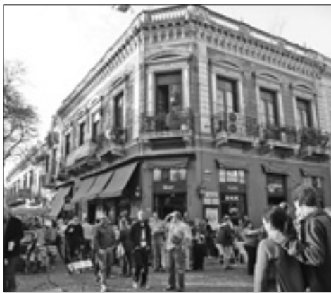
Il quartiere di San Telmo e (sotto) la scrittrice argentina