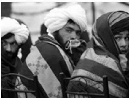
Talibani nel Nord Waziristan