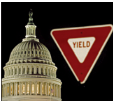
Il Campidoglio sullo sfondo di un segnale che invita a dare la precedenza

WASHINGTON, 2. I tagli automatici alla spesa pubblica statunitense sono entrati oggi ufficialmente in vigore. Il presidente americano, Barack Obama, ha firmato il decreto che fa scattare gli 85 miliardi di dollari di tagli. Il programma durerà fino a settembre.