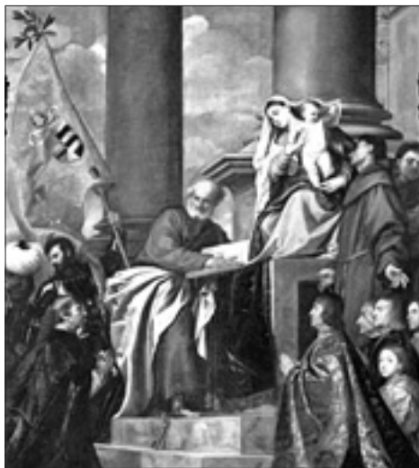
Tiziano, «Pala Pesaro» (1519-1526)

Come Raffaello, Tiziano ha conquistato il mondo. La misura della sua arte si misura anche con il successo di mercato, di critica e di immagine che la sua persona e le sue opere hanno conosciuto. Valga una sola considerazione. Quando il giovane Tiziano dipinge al Santo di Padova i suoi primi affreschi con le Storie di Sant'Antonio , i documenti contabili lo registrano come «dipintor», uno dei tanti che formavano la loro opera di apprezzati artigiani nei palazzi e nelle chiese di Venezia e del Dominio. Siamo nel 1511. Sessanta anni dopo, nella stampa che divulga in Europa il Martirio di San Lorenzo capolavoro della vecchiaia, l'artista si firma magister eques caesareus , quella data egli è cavaliere imperiale, conte palatino, i suoi clienti sono l'imperatore Carlo V, il fratello re Ferdinando, Maria