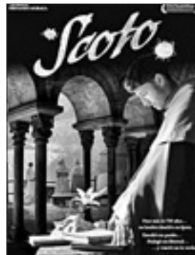
La locandina del film «Duns Scoto» (2011)

rebbe dirci in che misura la libertà umana trascende le relazioni naturali tra causa ed effetto, dovrebbe spiegare la base psicologica di quella possibilità di trascendere la natura e dovrebbe sviluppare le sue implicazioni per l'etica. La teoria scotiana, secondo l'autore dell'articolo, risponde a queste esigenze, considerando la libertà come un fenomeno ben distinto dalla natura. I teologi cristiani hanno sempre sostenuto che l'uomo trova la sua perfezione nella beatitudine celeste, dove tutto il desiderio umano sarà appagato. «Se il fine ultimo dell'esistenza umana è questa suprema felicità — continua lo studioso — allora il desiderio della felicità ha certamente un «significato morale». Credo che gli scolastici fossero tutti d'accordo su questo. Nonostante ciò, non per tutti il desiderio della felicità ha un valore morale. Per Tommaso, il desiderio della felicità non può mai essere repressibile, giacché l'uomo per sua natura non può fare a meno di desiderare la felicità; sostiene addirittura che tutte le azioni umane sono motivate, in ultima analisi, dal desiderio della felicità. Tuttavia in tal modo diventa più difficile, per Tommaso, spiegare come si può amare in modo autenticamente gratuito, se tutto è motivato da un bene proprio. Duns Scoto, invece, ammette che è del tutto possibile agire per un