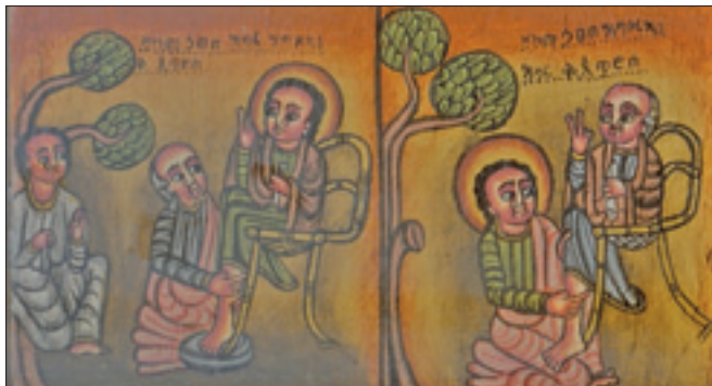
«Petro lava i piedi a Cristo e Cristo lava i piedi a Pietro» (icona etiopica, XIX secolo)