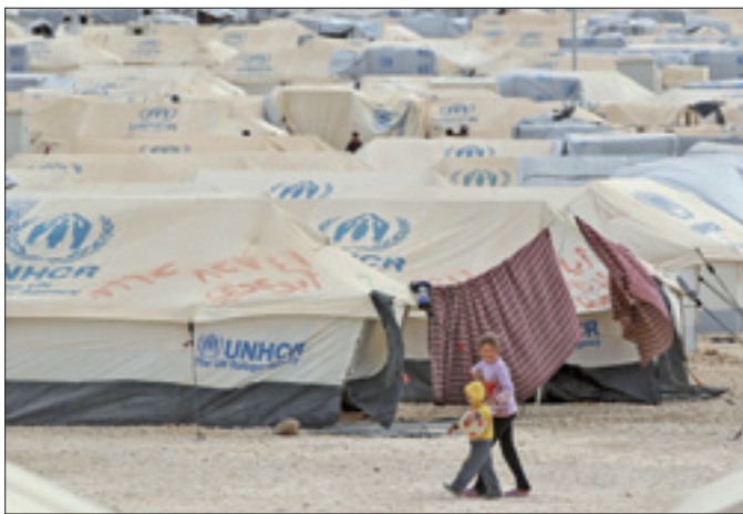
Un campo profughi in territorio giordano

In particolare i due leader «si sono detti d'accordo sulla necessità di portare avanti una transizione con l'obiettivo di mettere fine alla violenza il prima possibile e sull'importanza che Kerry e Lavrov continuino il proprio impegno sulla Siria». Nel colloquio telefonico Obama e Putin hanno anche discusso - mette in evidenza la Casa Bianca - «della situazione economica internazionale e del cammino da fare per una relazione più sostanziale negli scambi e negli investimenti fra Stati Uniti e