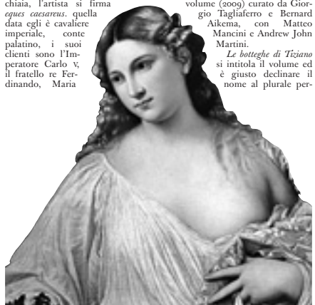
Tiziano, «Flora» (1515 circa)

Grande, insieme residenza, laboratorio, spazio espositivo e ufficio, il pittore tesse e governa una fitta rete di internazionali relazioni che possiamo definire «Sistema Tiziano». Questa definizione — sintesi insieme della attività professionale, della fortuna critica e del successo di mercato del grande pittore durante il corso del XVI secolo — la incontriamo in un recente monumentale volume (2009) curato da Giorgio Tagliaro e Bernard Aikema, con Matteo Mancini e Andrew John Martini.