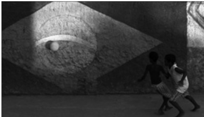
Il gioco del calcio in una strada di Rio de Janeiro

propulsione nucleare. Rousseff ha detto che il Brasile «ha tutte le capacità» per avviare questi progetti. «Il Brasile è capace, ha tutte le condizioni per svolgere simultaneamente il suo grande ruolo, dalla ricerca scientifica e tecnologica, all'industria