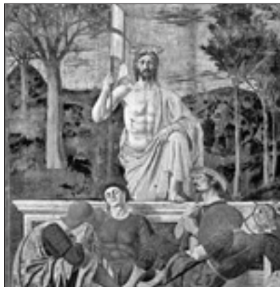
Piero della Francesca, «Resurrezione» (1465)