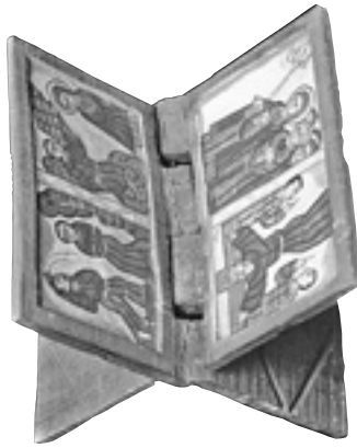
Leggendo etiopico con le immagini della crocifissione di Pietro

Un altro riconoscimento al pontificato di Benedetto XVI che sottolinea la sua continuità con la tradizione cristiana giunge invece dal Sacro convento di Assisi. I frati, infatti, hanno pubblicamente ringraziato il Papa emerito per avere usato le parole di san Francesco nel suo saluto ai cardinali il 28 febbraio, quando ha promesso incondizionata «riverenza e obbedienza» al suo successore. Il messaggio pubblicato sul sito della comunità francescana ricorda come quelle utilizzate da Benedetto XVI sono le parole di Francesco che ritroviamo nella regola Bollata: «Frate Francesco promette obbedienza e reverenza al signor Papa Onorio e ai suoi successori canonicamente eletti e alla Chiesa romana. E gli altri frati siano tenuti a obbedire a frate Francesco e ai suoi successori».