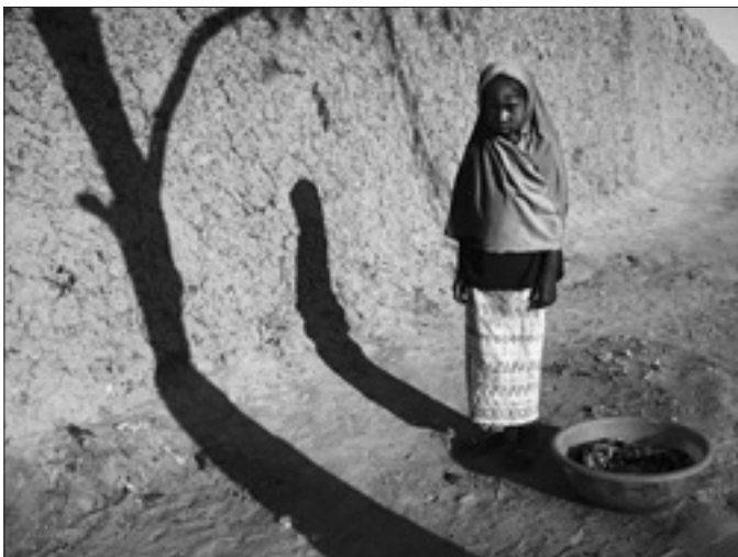
Una bambina a Gao

Cinquanta miliziani jihadisti catturati sull'isola di Kadji