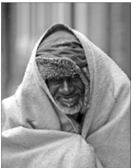
Una senza tetto a Detroit (Afp)

DETROIT, 2. Detroit, il cuore di quello che una volta era il cuore pulsante dell'America industriale e il quartier generale dell'auto, è in crisi e rischia di finire in bancarotta, la più grande mai registrata nella storia degli Stati Uniti. Il governatore repubblicano del Michigan, Rick Snyder, ha infatti dichiarato ufficialmente che la città si trova in emergenza fiscale, con i conti pesantemente in rosso.