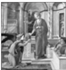
Filippo Lippi «Annunciazione e due devoti» (1441 circa)

A cento anni da quella donazione, il legame tra Stato italiano e la Bibliotheca Hertziana si stringe in una nuova e felice collaborazione nella mostra «Segno del mio amore verso il Paese che io tengo in sì alta stima». La donazione di Henriette Hertz nel 1912-1913 in corso fino al 23 giugno a Palazzo Barberini (che proprio quest'anno celebra i sessant'anni dell'apertura al pubblico, nel 1953). La mostra espone le 43 opere della raccolta Hertz in un percorso che rispetta scelte e cronologia, in una successione che vede nel rinascimento il fulcro della raccolta. Sono per la prima volta esposti al pubblico gli affreschi raffaelliani con Putti, la Madonna con il Bambino e un angelo di Domenico Puligo e la Maria Maddalena di Francesco Ubertini, esempi di cultura figurativa cinquecentesca. A queste opere meno note si uniscono famosi capolavori come la Annunciazione di Filippo Lippi e la Madonna con Bambino di Giulio Ro-