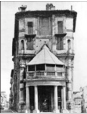
Palazzo Zuccari in una foto del 1871

Sul piano culturale l'italiano medio è molto più avvertito del tedesco medio. Magari il tedesco medio è più preparato sulla musica, però nella scuola italiana c'è un'attenzione per le materie umanistiche ben maggiore che da noi. Nell'inverno scorso ho tenuto un corso universitario su Caravaggio in Germania: vi erano studenti, originari della Repubblica democratica tedesca, incapaci di riconoscere una Madonna. Ma senza l'iconografia cristiana, la storia dell'arte semplicemente non si fa.