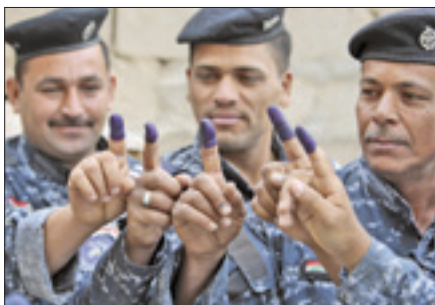
Soldati iracheni al voto

semblee provinciali designino il governatore, a sua volta chiamato a condurre a buon fine i diversi progetti di ricostruzione e di gestire l'amministrazione e le finanze della sua provincia di competenza.