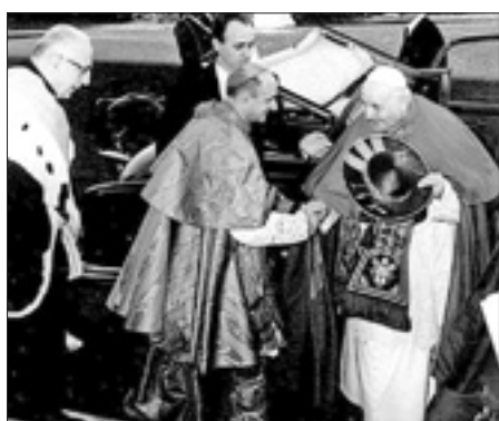
L'arcivescovo di Milano Montini accoglie Papa Giovanni XXIII a Milano per l'inaugurazione della Facoltà di Medicina e chirurgia della Cattolica (5 novembre 1961)

Non è sbagliato definire Federico Vanga un «costruttore sociale», avendo promosso con lungimiranza iniziative edilizie rivolte alle popolazioni della regione: non soltanto chiese e monasteri, ma anche ospedali, convitti e sempre a lui si deve la torre fortificata sull'Adige che porta il nome di famiglia. Ma è nel progetto della nuova cattedrale che si incontra il segno più visibile della