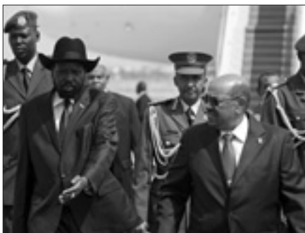
Il presidente sudanese Salva Kiir, a sinistra, e quello sudanese El Bashir a Juba

JUBA, 13. Il Sudan e il Sud Sudan normalizzeranno i loro rapporti e inizieranno una cooperazione transfrontaliera. Lo ha annunciato ieri il presidente sudanese, Omar Hassan El Bashir, nel corso della sua prima visita a Juba dalla secessione nel 2011.