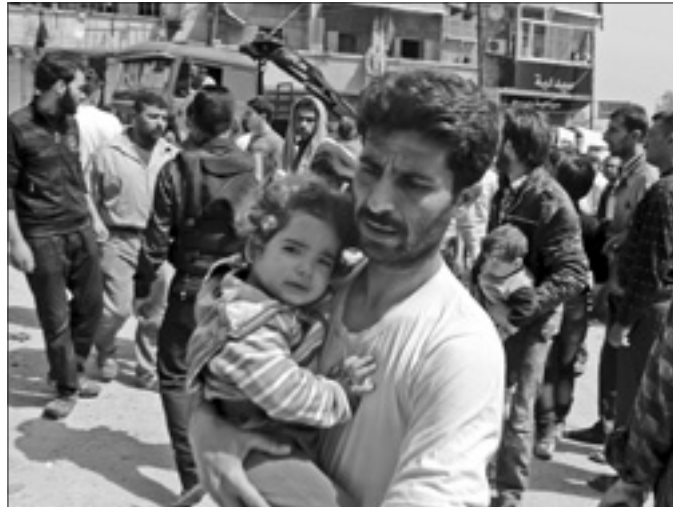
Una bambina con il padre ad Aleppo

Con un occhio però a quelle fasce di popolazione che più hanno beneficiato delle politiche di Chávez, ma che in prospettiva potrebbero non riconoscersi nel suo successore designato, Capriles ha infatti più volte dichiarato di ispirarsi alla missione di Mursi si concentrerà su questioni energetiche, sull'importazione di grano e sulle necessità finanziarie del Cairo. In programma un incontro con il presidente russo, Vladimir Putin, per colloqui mirati a individuare «la strada per rafforzare la collabora-