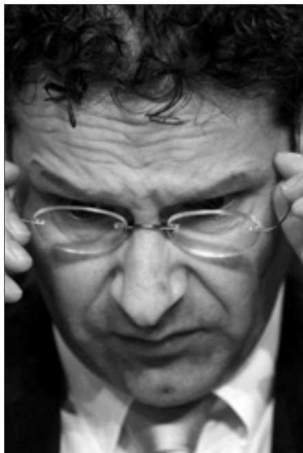
Il presidente dell'Eurogruppo, Jeroen Dijsselbloem

Paesi europei per combattere frontalmente l'evasione fiscale e affrontare la questione del segreto bancario». Italia, Germania, Francia, Spagna, Gran Bretagna e Polonia stanno lavorando a un progetto pilota per scovare gli evasori e rafforzare lo scambio di informazioni. L'impegno è stato annunciato in una lettera inviata dai ministri delle Finanze dei cinque Paesi alla Commissione europea. Nei giorni scorsi anche il Lussemburgo ha annunciato l'intenzione di abolire il segreto bancario e l'Austria ha aperto negoziati con Bruxelles, che spinge il Paese a un'analoga decisione. Come ha sottolineato ancora Van Rompuy, se «spetta soprattutto agli Stati membri agire», non è possibile farlo in modo isolato: le soluzioni devono essere transfrontaliere, «non solo in Europa, ma anche nel mondo» e vanno cercate quindi non solo a livello di Unione europea, «ma anche di G8 e G20». In questi contesti, è importante che «l'Europa si esprima con una sola voce, e il Consiglio europeo – ha concluso il presidente – farà la sua parte». Sulla stessa linea il ministro dell'Economia italiano, Vittorio Grilli, secondo il quale «a livello globale la lotta all'evasione richiede collaborazione». L'Italia – ha sottolineato Grilli nel corso della conferenza stampa al vertice di Dublino – è sempre stata impegnata a combattere l'evasione fiscale.