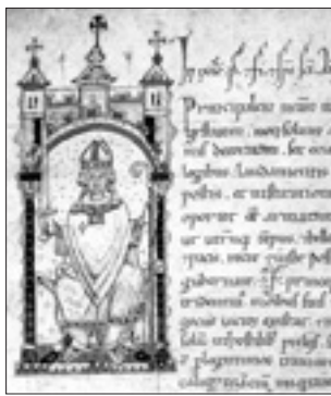
Il vescovo Vanga in una miniatura del «Codex Wanganianus Minor» (1215)

Federico Vanga fu vescovo di Trento dal 1207 al 1218: uomo di Chiesa e di fede, ma anche principe e governatore e soprattutto uno dei più eclettici mecenati della regione alpina durante il medioevo, colui che avviò i lavori di costruzione del nuovo duomo della città, la cattedrale di San Vigilio, passato alla storia per aver