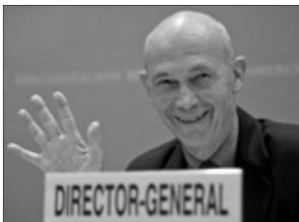
Pascal Lamy, presidente della Wto

lascerà la carica il 31 agosto, dopo due mandati consecutivi. Le votazioni si svolgeranno dal 16 al 24 aprile. Solo i primi due candidati avranno la possibilità di accedere al terzo turno di votazione. Tutto il processo di selezione dovrà concludersi prima del 31 maggio. In un'intervista, il presidente Lamy ha detto di essere «un fiero sostenitore del limite dei due mandati: applicherei volentieri questa norma in maniera universale».