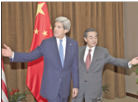
Il segretario di Stato americano con il ministro degli Esteri cinese

li sospettati di essere rampe mobili per il lancio di missili sono rimasti fermi negli ultimi due giorni. Secondo fonti di intelligence sudcoreane, citate dall'agenzia Yonhap, il regime comunista di Pyongyang ha schierato quattro o cinque «Transporter Erector Launcher» (Tel), lanciatori mobili, sulla costa a est della provincia di Hamgyong del sud. In più, da una settimana, due missili intermedi Musudan sono spostati fuori o all'interno di un capannone della città portuale di Wonsan, in un tentativo di confondere la vigilanza satellitare dell'intelligence di Seoul. «La situazione non è cambiata, non ci sono segnali che i Tel siano stati spostati a partire da giovedì o che i lanci di missili siano imminenti», ha detto una fonte sudcoreana.