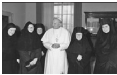
Giovanni Paolo II incontra le monache del monastero russo di Roma nel dicembre 1981

Tra i prelati passati in visita nel corso degli anni, si deve ricordare il metropolita Nikodim, arcivescovo di Leningrado e Novgorod, presidente del Dipartimento delle Relazioni ecclesiastiche estere del Patriarcato di Mosca e della commissione del santo Sinodo per le relazioni ecumeniche. Egli morì tra le braccia di Giovanni Paolo I, al quale aveva portato le felicitazioni della Chiesa ortodossa russa per la sua elezione a Sommo Pontefice. Il Papa lo benedì insieme al metropolita ortodosso Lev, attuale arcivescovo di Novgorod, che lo accompagnava. Le monache andarono in Vaticano e vegliarono la sua salma tutta la notte. L'attuale patriarca di Mosca Kirill I, discepolo del metropolita Nikodim, ha conosciuto il monastero da giovane sacerdote. Alla notizia della morte dell'ignemina madre Ekaterina, ha mandato una lettera di condoglianze assieme ad altri 3 metropoliti russi ortodossi, tra i quali il metropolita Juvenalij, pastore dell'eparchia di Mosca, molto vicino al monastero