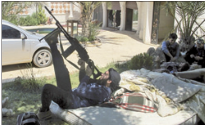
Un combattente ispeziona la sua arma ad Aleppo