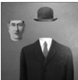
René Guenon, «Il pellegrino» (1966)

A partire da queste considerazioni è possibile individuare un itinerario verso il cortile