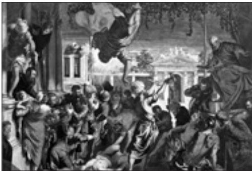
Tintoretto, «San Marco che libera lo schiavo» (1547-1548)