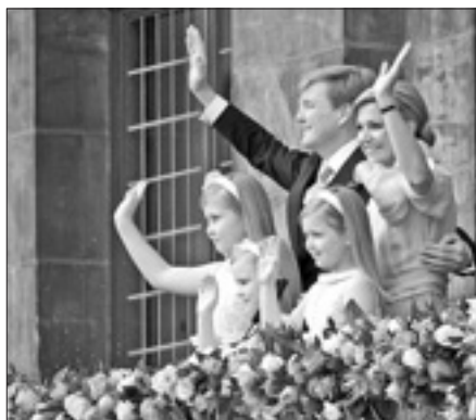
La famiglia reale saluta la folla ad Amsterdam

in favore di mio figlio Willem Alexander», si legge nell'atto firmato dalla ex sovrana dei Paesi Bassi e sottoscritto dai nuovi funzionari del re e da esponenti del Governo, compreso il primo ministro, Mark Rutte. L'incoronazione - trasmessa in diretta televisiva - ha visto la partecipazione di almeno venticinquemila persone riunite a piazza Dam, di fronte al Palazzo reale di Amsterdam, calarata di arancione.