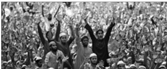
Manifestazione a Dacca a favore di una nuova legge sulla blasfemia

DACCA, 30. Tensione sempre più alta in Bangladesh dove gruppi fondamentalisti islamici premono per l'approvazione di una nuova e più severa legge sulla blasfemia. Secondo quanto riferisce l'agenzia Fides, il gruppo Hefazat-e-Islam – che già all'inizio di aprile aveva promosso una grande manifestazione di piazza – ha lanciato un ultimatum al Governo, intimando di approvare il cosiddetto «Documento con tredici richieste» entro oggi, 30 aprile. Se non accadrà, il 5 maggio il gruppo terrà una nuova manifestazione nella capitale trasformandola in un «assedio a Dacca».