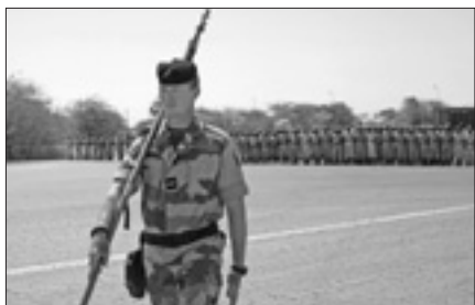
Un soldato francese impegnato in una missione all'estero

PARIGI, 30. La Francia prepara nuovi tagli alla Difesa, in particolare, agli effettivi dell'esercito: circa 20.000 soldati in meno tra il 2015 e il 2019. Lo rivelano diversi media francesi, citando fonti vicine al Governo di Parigi. I tagli, suggeriti nel nuovo Libro bianco della Difesa, presentato ieri al presidente, François Hollande, sono in linea con quelli decisi dall'Esecutivo precedente, che aveva programmato il taglio di 24.000 posti tra il 2008 e il 2015. Resta ancora da stabilire l'articolazione delle riduzioni di effettivi tra i diversi corpi d'armata, che sarà decisa in autunno, nella Legge di programmazione militare quinquennale (2014-2019).