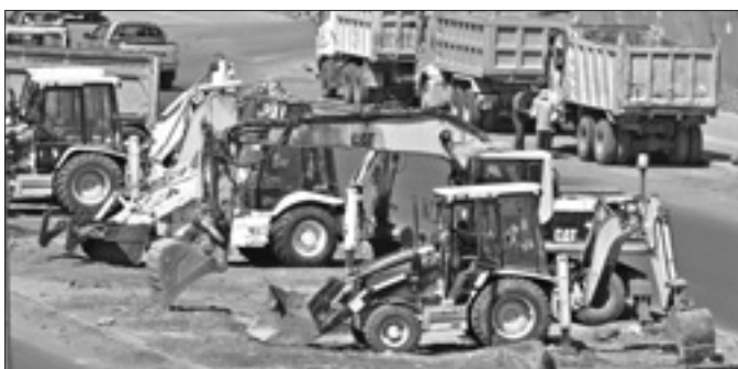
Lavori in corso ad Addis Abeba