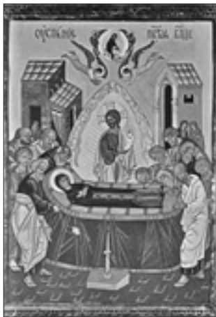
Icona della dormizione della Madre di Dio