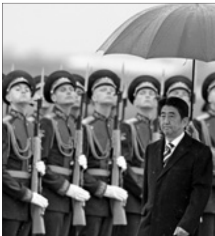
Il premier nipponico riceve gli onori militari a Mosca

Nel frattempo, gli ultimi operai sudcoreani hanno lasciato la zona industriale congiunta di Kaesong, una volta simbolo della cooperazione economica intercoreana. È stato così completato il ritiro totale dei lavoratori sudcoreani dal complesso gestito congiuntamente dalle due Coree. È quanto riferito dal ministero dell'Unificazione di Seoul, che ha precisato che 43 lavoratori hanno passato la frontiera poco dopo la mezzanotte, lasciando dietro di loro solo sette supervisori, impegnati in colloqui per questioni amministrative risolte con la controparte nordcoreana. Il ritiro totale degli operai e impiegati sudcoreani era stato avviato sabato scorso, dopo il rifiuto di Pyongyang di avviare un negoziato per la normalizzazione delle attività.