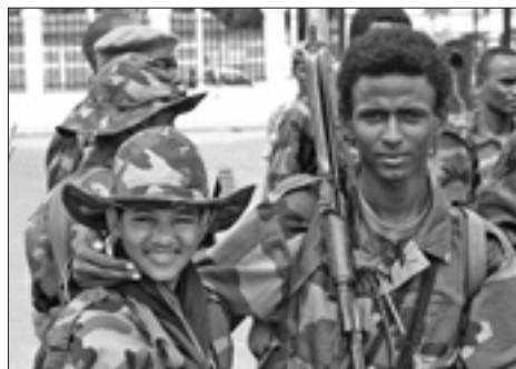
Bambini arruolati nelle fila dei ribelli centroafricani

La nota aggiunge che il presidente François Hollande ha accolto la notizia con grande tristezza, esprimendo il rispetto di tutta la Nazione e le sue più sentite condoglianze alla famiglia del soldato ucciso.