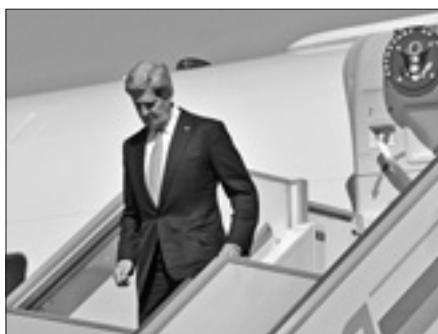
Il segretario di Stato americano Kerry a Mosca

MOSCA, 7. Il segretario di Stato americano, John Kerry, è giunto a Mosca dove in queste ore incontra il presidente russo, Vladimir Putin. Questa missione coincide con l'anniversario del ritorno di Putin al Cremlino per un terzo mandato e mira a rilanciare la cooperazione bilaterale. In primo piano il dossier siriano, ma anche la crisi nella penisola coreana, l'Afghanistan, l'Iran e il disarmo nucleare. Kerry tenterà - nonostante le recenti difficoltà nei rapporti bilaterali - di dare impulso alla cooperazione e contribuire a una nuova distensione. L'obiettivo della visita del capo della diplomazia di Washington è preparare il terreno per l'incontro tra i due capi di Stato, che pare ormai imminente. Secondo fonti anonime a Mosca, potrebbe avvenire anche prima del vertice del caso, previsto a San Pietroburgo il prossimo settembre.