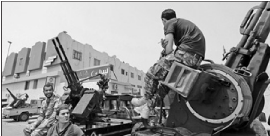
Uomini armati circondano il ministro della Giustizia libico

TRIPOLI, 7. Lo Stato libico è sotto attacco da parte delle milizie armate che, da giorni, hanno di fatto preso in ostaggio due ministeri importanti, quello degli Esteri e degli Interni, circondati da pick-up armati di cannoni e mitragliatrici. La posta in gioco è diventata alta, perché le milizie, che si battono per l'eliminazione dalla pubblica amministrazione dei funzionari dell'era di Gheddafi, ora pretendono le dimissioni del primo ministro, Ali Zeidan, e del presidente del Congresso nazionale (il Parlamento), Mohamed Magarief, che non possono cancellare il passato quando hanno servito lo Stato che si identificava solo e soltanto nel colonnello. Intanto, il ministro della Difesa libico, Mohammed Al Barghati, si è dimesso oggi accusando i gruppi armati che assediano a Tripoli anche la sede del Governo di minacciare la democrazia. «Non potrò mai accettare che la politica sia praticata con il potere delle armi. Questo è un assalto contro la democrazia, quella stessa democrazia che ho giurato di difendere».