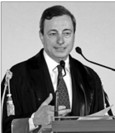
Mario Draghi durante il discorso per il conferimento della laurea honoris causa

È dunque necessaria - secondo il presidente della Bce - «una più equa distribuzione del reddito per una crescita sostenibile», perché in Europa «da quasi vent'anni è in atto una tendenza alla concentrazione dei redditi delle famiglie che penalizza i più deboli».