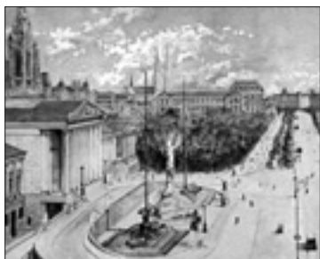
Adolf Hitler, «Palazzo del Parlamento e Ringstrasse a Vienna»

Del resto, i gusti di Hitler in campo pittorico furono tradizionalisti. Secondo lui, l'arte tedesca, dopo aver raggiunto il suo apogeo nel XIX secolo, si era avviata dal primo decennio del Novecento verso un inesorabile declino. Tale involuzione era incarnata dall'arte modernista, accusata di essere primitiva ed elitaria, di non avere uno stile ben definito, né una connotazione nazionale. A praticarla erano folli, criminali ed ebrei. Agli occhi di Hitler, essa appariva tanto la negazione dei canoni estetici che avevano informato la sua stessa pittura giovanile - il realismo, la bellezza convenzionale, la semplicità e l'arte come evasione - quanto un segno inequivocabile della degenerazione del Paese.