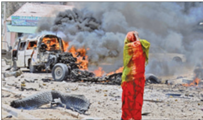
La scena di un recente attentato a Mogadiscio

LONDRA, 7. La conferenza internazionale sugli aiuti alla Somalia convocata oggi a Londra dal Governo britannico si apre mentre nel Paese africano il processo di normalizzazione non mostra ancora i risultati sperati.