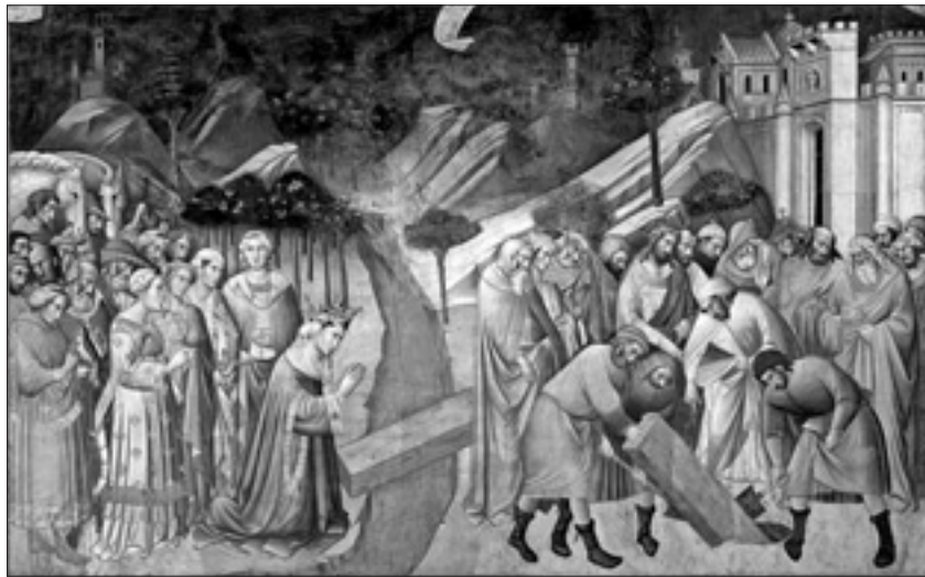
Ammirabile da vicino grazie ai ponteggi il restaurato ciclo pittorico di Agnolo Gaddi a Firenze