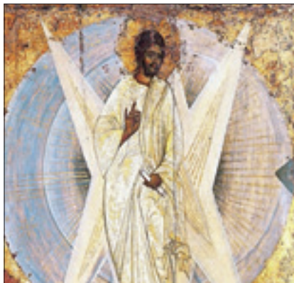
Tiagine il Greco, «La trasfigurazione» (XVII secolo, Mosca, Galleria Tretjakov)

Quell'imbarazzante connessione tra Hitler e il mondo dell'arte