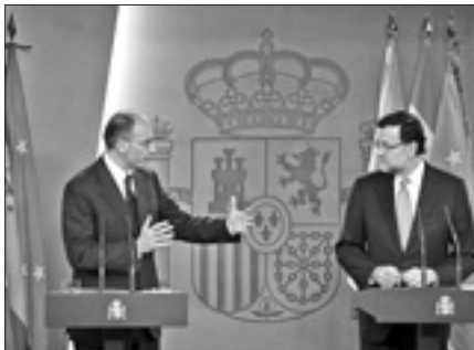
Letta e Rajoy nella conferenza stampa congiunta a Madrid

verno spagnolo l'Italia chiederà che il Consiglio europeo di giugno faccia della «lotta al dramma della disoccupazione giovanile» il suo tema centrale. Si tratta - ha dichiarato Letta - «di uno sforzo a favore dell'Europa e quindi anche della Germania; se viene meno la domanda interna degli altri Paesi, nessuno si salva». Siamo in un mercato unico - ha aggiunto - ed «è interesse di tutti che la crescita riprenda e si crei lavoro».