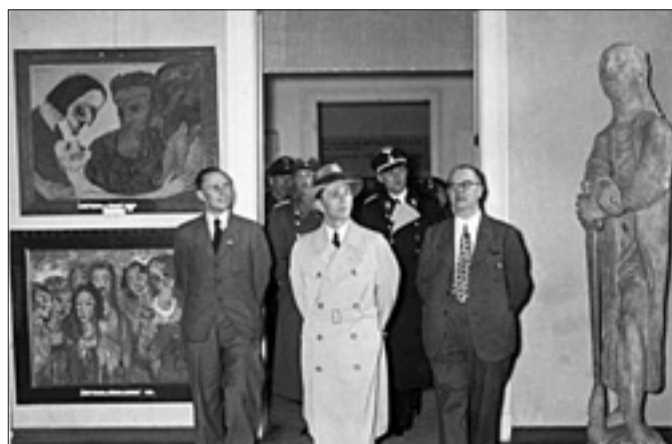
Joseph Goebbels visita la mostra di "arte degenerata" (1937)