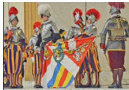
Nell'aula Paolo VI alla presenza dell'arcivescovo Becciu

«Gesù nel sopportare la Croce: «È doloroso, tante volte molto doloroso, ma non è triste», perché il cuore è in pace. Dunque sopportare come Gesù, con il cuore in pace, rende felici. E quale sia l'origine di questa gioia il Papa l'ha spiegato riproponendo la prima preghiera della messa del giorno, attraverso la quale «la Chiesa dice: "Esulta il tuo popolo, Signore, per la rinnovata giovinezza della Pasqua". Andare in pazienza rinnova la nostra giovinezza e ci fa più giovani. Il paziente è quello che, alla lunga, è più giovane! Pensiamo a quegli anziani e anziane nella casa di riposo; a quelli che hanno sopportato tanto nella vita, guardiamoci gli occhi: occhi giovani, hanno uno spirito giovane e una rinnovata giovinezza. E a questo ci invita il Signore», anche «a sopportarci l'uno l'altro» con «carità e amore».