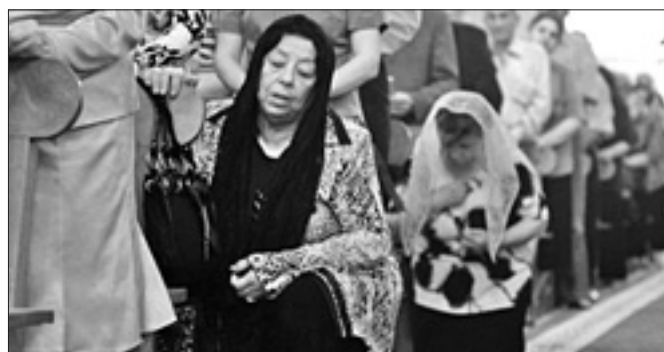
Il Patriarca di Babilonia dei Caldei richiama all'unità la Chiesa in Iraq

Se l'ecumenismo non è concepito e avvertito a questo livello di finalità e di profondità, determinate dall' ut unum sint di Cristo, le iniziative di dialogo e di confronto in sé proficue e persino necessarie finirebbero col confondere e l'esito sarebbe un pacifismo teologico invece che la ripresa di una vera comunione.