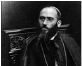
Monsignor Longhin appena eletto vescovo di Treviso (1904)

La diocesi di Treviso, alla morte del vescovo Giuseppe Apollonio, nel 1903, «si presentava come una diocesi già attiva, ferma nella tradizione ecclesiale, inventiva dal punto di vista pastorale. Era, dunque, necessario in pastore giovane e coraggioso; un pastore che sapesse diventare guida di fronti pastorali diversificati; un uomo contemplativo nell'intimità adesione vocazionale, ma anche operativo nella dinamica vita pastorale dei trevigiani; un uomo che con responsabilità e prudenza sapesse dirigere di persona coloro che fino ad allora avevano rappresentato la migliore ricchezza della diocesi, ma sapesse anche coinvolgere persone nuove che condivisero insie-