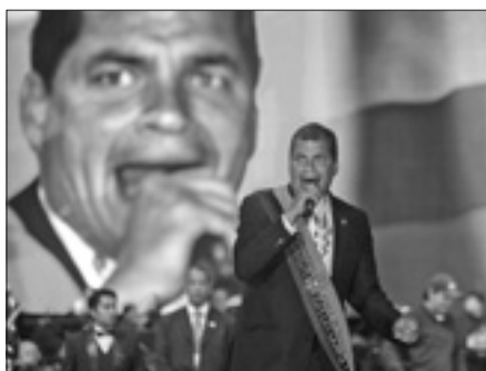
Il presidente dell'Ecuador

QUITO, 25. Il presidente dell'Ecuador, Rafael Correa Delgado, ha prestato giuramento ieri nella sede dell'Assemblea nazionale a Quito, dando inizio al suo secondo mandato dopo la vittoria (57,17 per cento dei voti) nelle elezioni del 17 febbraio. Gran parte del discorso d'insediamento di Correa Delgado è stato dedicato a polemizzare con la stampa del suo Paese, accusata di opposizione acritica al Governo e persino di costituire uno strumento per opprimere il popolo. «Nella nostra America non si tollerano più le dittature e per questo sono stati inventati mezzi più sottili per continuare a opprimere i nostri popoli», ha detto il presidente. La maggioranza governativa, che controlla i 100 dei 137 seggi in Parlamento, si accinge a varare una legge sui media criticata sia dalle associazioni dei settori sia dalle organizzazioni di difesa dei diritti umani.