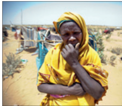
Un campo profughi nel Darfur

Allo stato attuale, i risultati dello sforzo di integrazione continentale e di impegno per la pace e la sicurezza non sono certo soddisfacenti. Così come resta il dubbio che l'Africa possa dare risposte alle esigenze dello sviluppo economico e sociale. Gli schemi tuttora imposti dalla globalizzazione finanziaria, infatti, penalizzano l'Africa più di ogni altra zona del mondo. Come ha ricordato di recente l'ex segretario generale dell'Onu, il ghanese Kofi Annan, «la globalizzazione porta con sé i rischi dell'interdipendenza. Le economie africane saranno ancora condizionate da dinamiche di mercato sulle quali hanno poco controllo». E si aggiungono i ritardi politici e sociali nell'integrazione di un continente rimasto profondamente diviso lungo le linee dell'appartenenza etnica e di classe