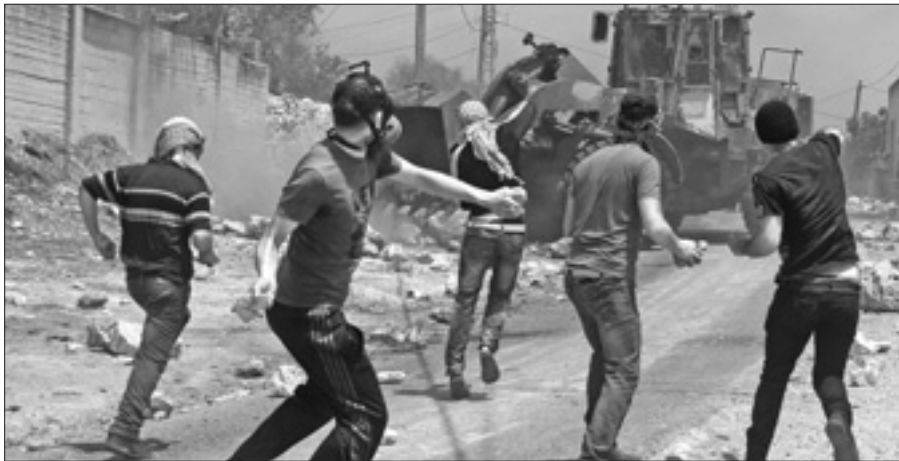
Protesta di giovani palestinesi contro un bulldozer israeliano nel villaggio di Kafz Qaddum nei pressi di Nablus

TEL AVIV, 25. Gli incontri sono stati «produttivi», ma nei prossimi mesi dovranno essere prese «decisioni difficili» da affrontare in «negoziati diretti». Non ha usato mezzi termini il segretario di Stato americano, John Kerry, lasciando il Vicino Oriente al termine della sua quarta visita dallo scorso febbraio, nella quale ha incontrato il premier israeliano, Benjamin Netanyahu, e il presidente dell'Autorità palestinese (Ap), Abu Mazen. Colloqui che hanno toccato i punti nodali del contenzioso storico tra le due parti e, in particolare, la spmosa questione degli insediamenti ebraici in Cisgiordania e le rivendicazioni palestinesi su Gerusalemme est. Sull'insediamenti è intervenuto ieri il capo del Foreign Office, William Hague,