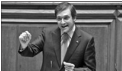
Il premier portoghese Pedro Passos Coelho

Una nuova modifica degli obiettivi non è esclusa visto anche la difficile situazione che il Paese deve affrontare. I provvedimenti fiscali - come l'aumento dell'Iva (l'imposta sul valore aggiunto) dal venti al 23 per cento - adottati dal Governo per ridurre il deficit e rientrare nei parametri imposti dai creditori hanno determinato un aumento del numero dei giorni in cui un cittadino deve lavorare per pagare le tasse. Ora deve farlo fino al 4 giugno, quindi poco più di cinque mesi. Il dato è comunque inferiore a quello di molti altri Paesi dell'Unione europea.