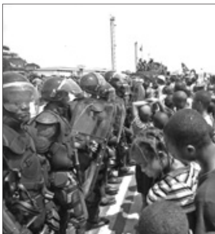
Proteste durante il processo a Bangui

Il Governo rwandese aveva accusato l'esercito congolese di continui bombardamenti di artiglieria sul proprio territorio. Peraltro, un rapporto diffuso l'altro ieri dalla Monusco, la missione dell'Onu nella Repubblica Democratica del Congo, accusa invece proprio le truppe rwandesi di essere entrate nel Nord Kivu in appoggio ai ribelli dell'M23 e di aver più volte attaccato non solo le forze congolese, ma gli stessi caschi blu, che mercoledì scorso in uno di altri attacchi hanno avuto un morto e tre feriti. Ancora ieri il comando del contingente sudaficano della Monusco ha riferito che colpi di mortaio dell'M23 si sono abbattuti sulla sua base a Goma.