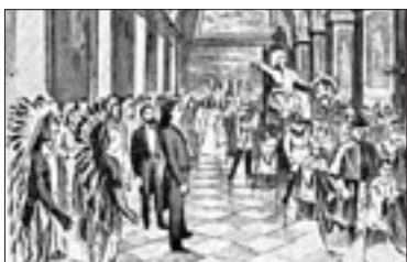
L'incontro tra il Papa e Buffalo Bill (Denver, Buffalo Bill Museum)

Strana storia quella di Buffalo Bill, scappatore di soprannomi - il vero William dei bisonti era un certo Mr. Comstock, di Wichita - e scaltro impresario di se stesso nel promuovere il suo spettacolo di maggior successo, il Wild West Show ; tanto da chiedere con insistenza un incontro con Papa Leone XIII durante la tappa romana della sua tournée, nel 1890. Un'udienza - per di più in occa-