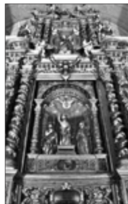
Ancona dell'altare maggiore della chiesa di San Martino a Vecoz d'Oglio (Brescia)

che richiamava quella dell'Ultima Cena di Gesù con gli apostoli, e "oggetto" che evocava seppur blandamente l'altare sacrificale, sul quale si rinnovava ritualmente il sacrificio di Gesù Salvatore. Successiva tappa, di lunga durata, fu l'ideazione di altari fissi sovrastati da un insieme strutturato per accogliere tele o decori, il cui compimento architettonico e artistico è stato l'altare barocco a dossale. A questo deve essere affiancata, nella stessa epoca, la variante dell'altare tabernacolo, parallelepipedo in pietra sovrastato da ciborio. L'uno e l'altro hanno assunto, tra Cinque e Settecento, forme di congegni imponenti, ricchi di colori e vibrazioni luministiche. Divennero presto grandi, scenografici e stabili fondali allo spazio interno della