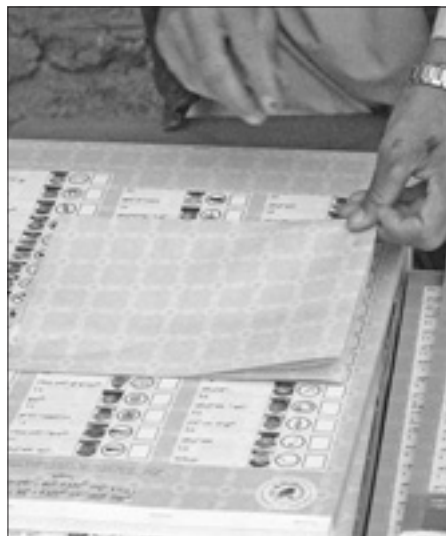
Schede elettorali afgane

Sono quattro i punti sui quali si impernia la proposta avanzata dal Governo alle opposizioni e che sono stati anticipati, prima d'essere presentati ufficialmente, oggi, da fonti dell'Uggt, il sindacato che sta guidando la mediazione. Il primo punto evidenzia l'impegno ufficiale a fare dimettere il Governo il 29 settembre. Il secondo riguarda l'avvio, all'inizio della prossima settimana, del dialogo nazionale tra maggioranza e opposizione, che dovrebbe andare avanti per tre settimane al fine di individuare la personalità cui affidare la guida del nuovo Esecutivo e coloro che faranno parte del gabinetto. Terza richiesta, quella di riprendere i lavori dell'Assemblea. L'ultimo punto impegna l'Assemblea a lavorare soltanto su specifici argomenti: Costituzione, formazione dell'organismo chiamato ad organizzare le elezioni e legge elettorale.