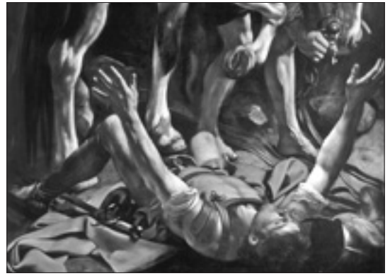
Caravaggio, «La conversione di san Paolo» (1600-1601)