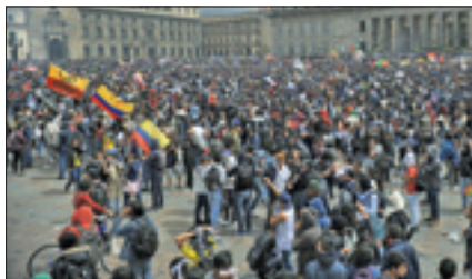
Manifestazione in favore dei campesinos a Bogotá

La protesta dei campesinos ha già portato a scontri con la polizia, accusata di ricorrere a un uso eccessivo della forza, in uno scenario definito preoccupante dall'ufficio dell'Onu in Colombia.