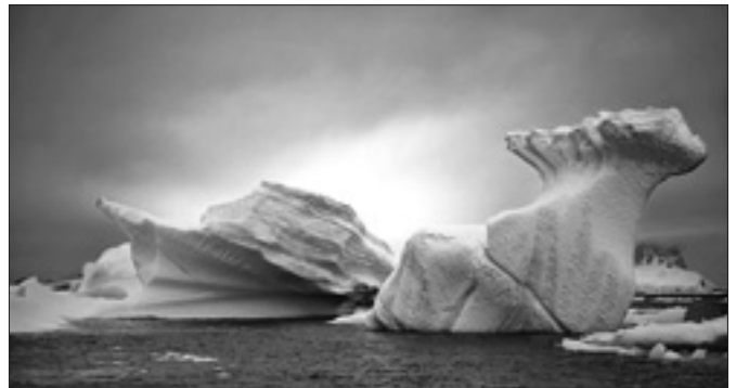
Formazioni di ghiaccio in Antartide

LONDRA, 31. La calotta glaciale antartica orientale, la più grande del mondo, potrebbe essere più vulnerabile ai cambiamenti climatici di quanto si pensasse. Lo ha evidenziato un approfondito studio dei ricercatori della britannica Durham University, pubblicato sulla rivista «Nature». Il team del dipartimento di Geografia ha usato dei satelliti spia dismessi per monitorare i cambiamenti climatici a lungo termine dei 5.400 chilometri della linea costiera della calotta glaciale antartica orientale. Usando misure provenienti da 175 ghiacciai, i ricercatori sono stati in grado di mostrare che questi vanno