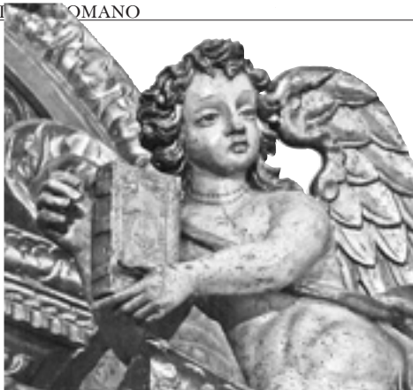
Particolare dell'altare della chiesa di Santa Maria Nascente a Edolo (Brescia)

Se il Verbo si è manifestato nella carne, realtà dell'umano che denota la sua debolezza e vulnerabilità, solo in tale dimensione si può