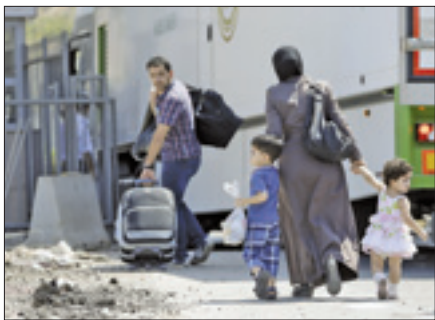
Profughi siriani al confine con la Turchia

quale sono intervenuti, tra gli altri, il cardinale Tarcisio Bertone, segretario di Stato, l'arcivescovo Dominique Mamberti, segretario per i rapporti con gli Stati, e il cardinale Leonardo Sandri, prefetto della congregazione per le Chiese Orientali. Il direttore della Sala stampa vaticana, il gesuita Federico Lombardi, ha spiegato che il Papa ha convocato l'incontro per «valutare possibili linee» per promuovere la pace in Siria. «Si è trattato - ha aggiunto padre Lombardi - di discutere le possibili iniziative da parte della Santa Sede» per la composizione del conflitto per la cui cessazione il Papa ha già lanciato diversi appelli. L'ultimo è stato giovedì scorso quando, ricevendo i reati di Giordania, «ha sottolineato con loro che l'unica opzione è il dialogo».