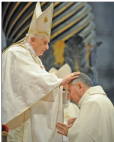
Benedetto XVI conferisce l'ordinazione episcopale a monsignor Parolin (12 settembre 2009)

Allo stesso modo, più volte si fa portavoce della volontà della Sede apostolica di operare negli organismi internazionali per salvaguardare i diritti essenziali della persona: e tra questi la libertà religiosa, in difesa della quale pronuncia un intervento il 2 dicembre 2005 a Maastricht, in occasione della undicesima riunione del Consiglio dei ministri degli Esteri dell'Organizzazione per la sicurezza e la cooperazione in Europa (Osce), ricordando che il rispetto di ogni credo religioso e il pieno esercizio del diritto a professarlo «contribuiscono in modo determinante a combattere l'intolleranza e i pregiudizi etnici e razziali». In quella stessa sede sottolinea la necessità di una «maggiore integrazione» tra etnie e culture nella società odierna. E denuncia con parole forti la tratta degli esseri umani, che definisce una «manifestazione vergognosa di schiavitù», chiedendo una più stretta collaborazione internazionale per far fronte al drammatico fenomeno. L'attenzione ai problemi dello sviluppo mondiale e all'esigenza di ridefinire le priorità economiche e sociali orientate in quegli anni l'attenzione della Santa Sede anche verso il tema della salvaguardia ambientale,