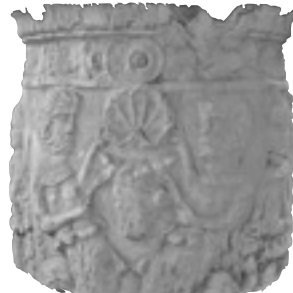
Altare per l'antico culto di Cibele (Museo archeologico di Milano)

Notre Dame: «penso che, per lo scrittore cattolico i Troubles fossero un momento critico, un punto di svolta, forse persino la visione del compimento di qualcosa. Il progetto prevedeva che una certa esperienza storica trovasse compimento in una Irlanda Unita o in qualcosa del genere. Andare al Sud fu forse emblematico per me e lo fu senza dubbio per alcune delle persone che conoscevo in quegli anni».