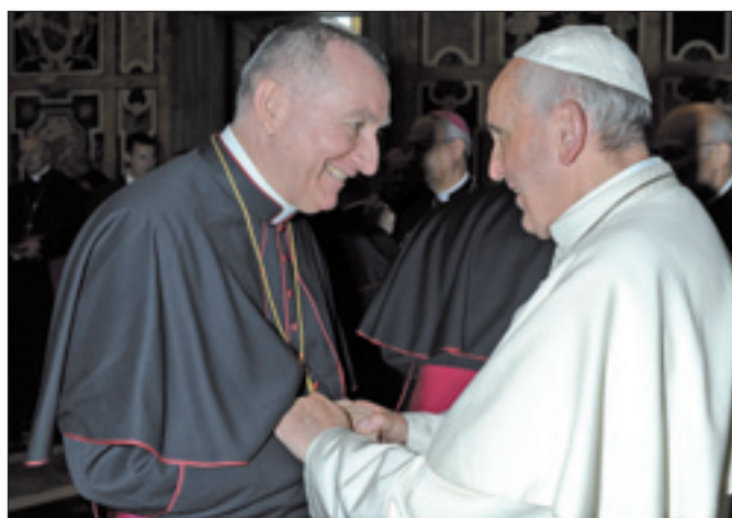
Papa Francesco saluta l'arcivescovo Parolin durante l'udienza ai rappresentanti pontifici (31 agosto)

«Sento viva - prosegue l'arcivescovo - la grazia di questa chiamata, che, ancora una volta, costituisce una sorpresa di Dio nella mia vita e, soprattutto, ne sento l'intera responsabilità, perché essa mi affida una missione impegnativa ed esigente, di fronte alla quale le mie forze sono deboli e povere le mie capacità. Per questo mi affido all'amore misericordioso del Signore, dal quale nulla e nessuno potrà mai separarmi, e alle preghiere di tutti. Tutti ringrazio, fin d'ora, per la comprensione e per