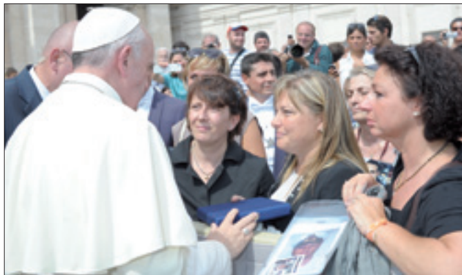
Il saluto ai familiari delle vittime del crollo della torre di controllo del porto di Genova avvenuto il 7 maggio

Un terzo breve pensiero. Nei primi secoli della Chiesa, era ben chiara una realtà: la Chiesa, mentre è madre dei cristiani, mentre "fa" i cristiani, è anche "fatta" da essi. La Chiesa non è qualcosa di diverso da noi stessi, ma va vista come la totalità dei credenti, come il «noi» dei cristiani: io, tu, tutti noi siamo parte della Chiesa. San Girolamo scriveva: «La Chiesa di Cristo altra cosa non è se non le anime di coloro che credono in Cristo» ( Tract. Ps 86: PL 26, 1084 ). Allora la maternità della Chiesa la viviamo tutti, pastori e fedeli. A volte sento: «Io credo in Dio ma non nella Chiesa... Ho sentito che la Chiesa dice... i preti dicono...». Ma una cosa sono i preti, ma la Chiesa non è formata solo dai preti, la Chiesa siamo tutti! E se tu dici che credi in Dio e non credi nella Chiesa, stai dicendo che non credi in te stesso; e questo è una contraddizione. La Chiesa siamo tut-