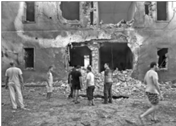
La sede del ministero colpita a Bengasi

Colpita la sede del ministero degli Esteri