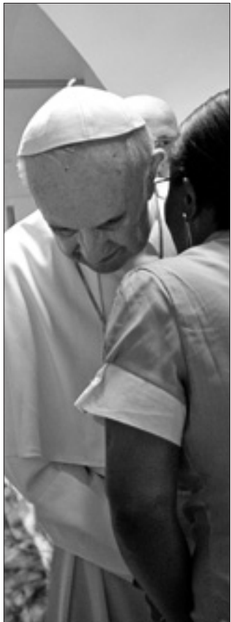
«Non dobbiamo avere paura delle differenze». È l'appello lanciato da Papa Francesco durante la visita conosciuta come missiones , 10 settembre, al centro Astalli di Roma, che dal 1987 offre accoglienza e assistenza ai rifugiati.

Cari fratelli e sorelle, buon pomeriggio!