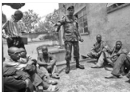
Presunti ribelli dell'M23 catturati dalle forze regolari

KAMPALA, 11. Ci sarebbero progressi significativi nei colloqui tra il Governo della Repubblica Democratica del Congo e i ribelli del Movimento 23 Marzo (M23) tornati all'offensiva nella regione orientale congolese del Nord Kivu. Ne dà notizia la Misna, l'agenzia internazionale delle congregazioni missionarie, citando un comunicato dei mediatori della Conferenza internazionale degli Stati dei Grandi Laghi, che conducono i negoziati ripresi questa settimana nella capitale ugandese Kampala.