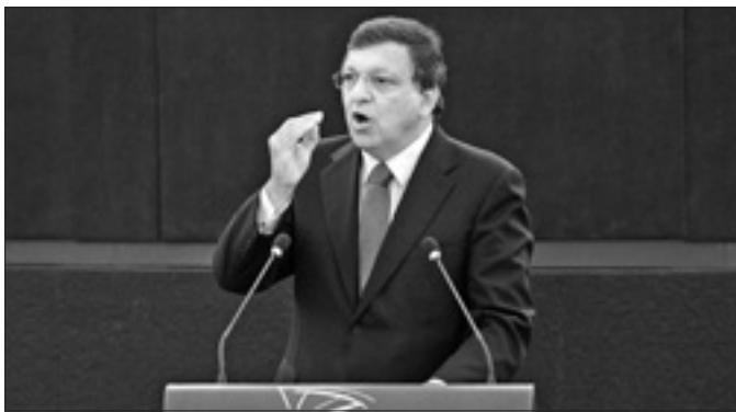
Il presidente della Commissione Ue durante il suo discorso

«Abbiamo ragione di essere ottimisti e questo ci deve spingere a continuare gli sforzi: lo dobbiamo ai Paesi che non sono ancora fuori dalla crisi e ai ventisei milioni di disoccupati», ha precisato Durão Barroso. «L'attuale livello di disoccupazione – ha dichiarato – è politicamente e socialmente inaccettabile», quindi va invertita questa tendenza e «dobbiamo evitare una ripresa senza creazione di posti di lavoro». A livello nazionale ha sostenuto il presidente Ue, «bisogna accelerare le riforme»,