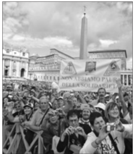
From England: Pilgrims from the following parishes: St. Michael's Polish Parish, Birmingham; St. Augustine, Tunbridge Wells, Kent; Holy Ghost, Crowthorne, Berkshire; Immaculate Conception, Sandhurst, Berkshire.