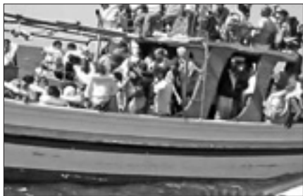
Migranti in arrivo nel porto di Pozzallo

ROMA, 11. Non sembrano avere sosta gli sbarchi di migranti sulle coste italiane. Tre barconi diretti in Sicilia con a bordo oltre 250 persone sono stati individuati oggi dalla Guardia costiera. Il primo dei tre, un gommonone con a bordo 15 migranti di cui tre donne e un minore, è stato individuato da una motopesca tunisina a sessanta miglia a nord della Libia; la Guardia costiera è intervenuta dirottando un mercantile battente bandiera liberiana, che ha raccolto i migranti e ha fatto rotta per Pozzallo.