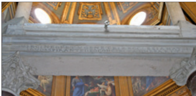
L'iscrizione latina nel battistero di San Giovanni in Laterano

I saluti ai gruppi presenti in piazza San Pietro