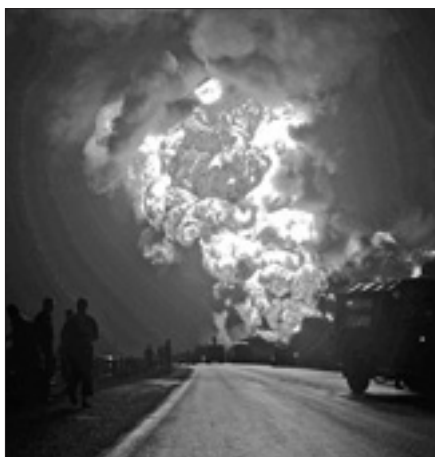
Un'autobus dell'Alleanza atlantica incendiata

ISLAMABAD, 16. Ancora attacchi in Pakistan contro mezzi carichi di rifornimenti per le truppe Nato che operano in Afghanistan. Secondo quanto ha riferito l'emittente televisiva Geo, quindici container sono stati dati alle fiamme dai miliziani che hanno condotto un attacco con razzi. L'assalto è avvenuto nella zona di Hub, nella provincia del Balucistan. Non si sono registrate vittime. In passato attacchi di questo genere sono stati compiuti quasi con cadenza sistematica: al riguardo, il segretario generale della Nato, Anders Fogh Rasmussen, ha più