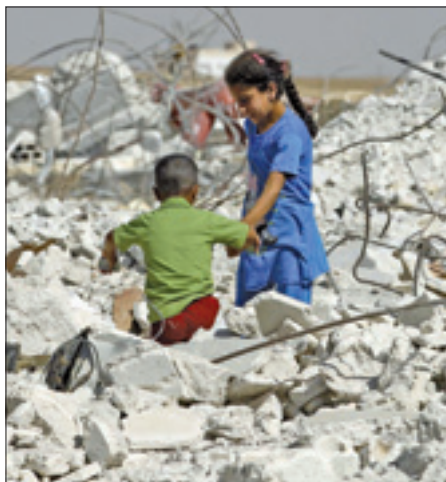
Bambini tra le macerie di un'abitazione ad Hama

Un'altra notizia positiva riguarda la riapertura in Siria, oggi, dell'anno scolastico. I soldati di Assad hanno infatti abbandonato gli istituti di Damasco che erano stati trasformati in caserme in previsione del possibile intervento militare, riconsegnando le aule agli studenti.