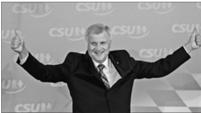
Il leader della Csu Horst Seehofer

Anche a livello federale, infatti, i liberali lottano per superare il difficile scoglio del 5 per cento dei con-