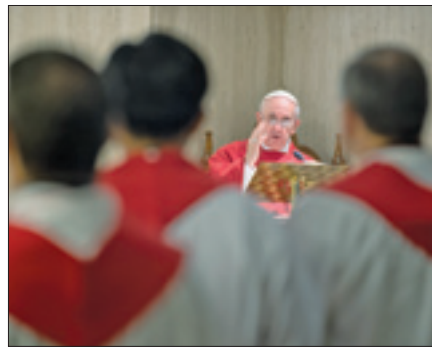
Messa del Papa a Santa Marta

A tutti auguro una buona domenica e un buon pranzo. Arrivederci!