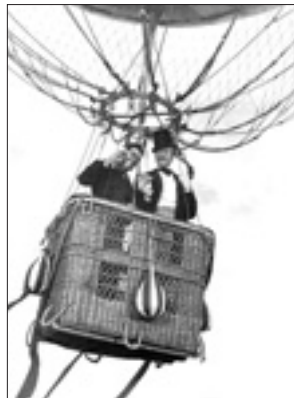
«Il giro del mondo in 80 giorni» di Michael Anderson (1956)

Fatta eccezione per Il viaggio verde (Erich Rohmer, 1986), tratto da un romanzo non d'avventura di Verne, fra l'altro completamente piegato alle esigenze di un cinema d'autore estremamente personale nonché pretenzioso, per molti anni il grande schermo si è quindi disinteressato all'opera dello scrittore. Tornando a occuparsene soltanto nell'era del digitale.