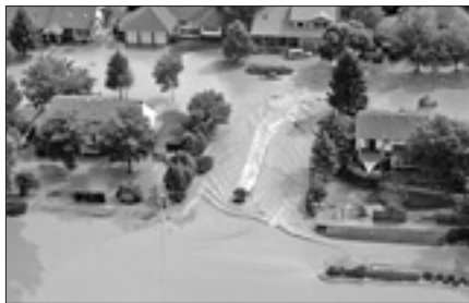
La città di Boulder invasa dalle acque

WASHINGTON, 16. «Siamo di fronte a una catastrofe: non usano mezzi termini le autorità che da giorni stanno lottando contro l'acqua che continua a invadere il Colorado. Si tratta di alluvioni senza precedenti, dicono gli esperti, causate da fortissime piogge che, tra l'altro, non accennano a diminuire. E l'inclinazione del tempo sta pesantemente condizionando l'opera dei soccorritori. Il bilancio ufficiale parla, al momento, di cinque morti e di oltre 1250 dispersi. Ma lo sceriffo di Boulder, la contea più colpita dalle inondazioni, ha dichiarato: «Dobbiamo essere realistici, il numero delle vittime è destinato ad aumentare».