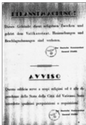
Uno degli avvisi che durante l'occupazione di Roma venivano affissi sui portoni dei conventi per cercare di evitare i rastrellamenti dei nazisti

Queste parole che io pronunciavo nella lingua che fu tua più di quanto non è stata mia, o martire di una passione che pesa ancora sul tuo popolo, queste parole che hai sentito pronun-