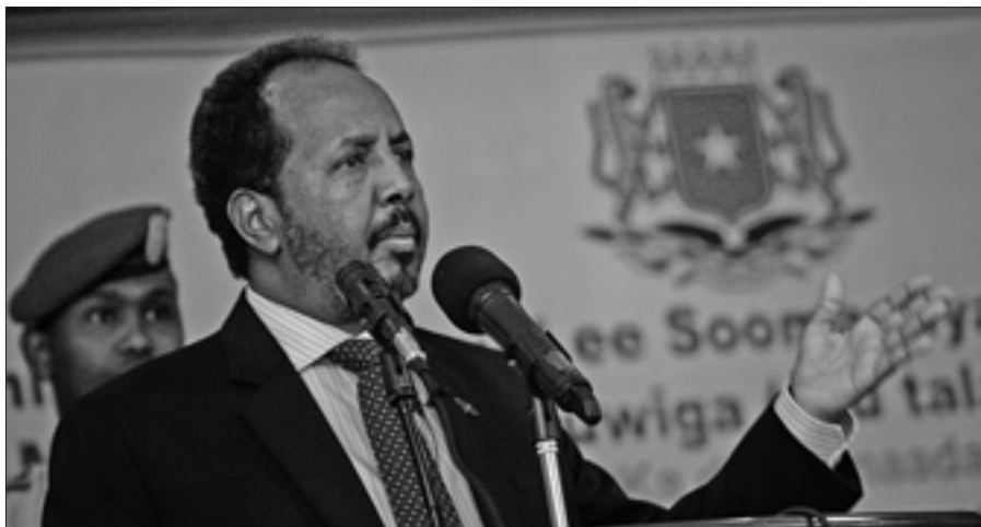
Il presidente somalo Hassan Mohamad