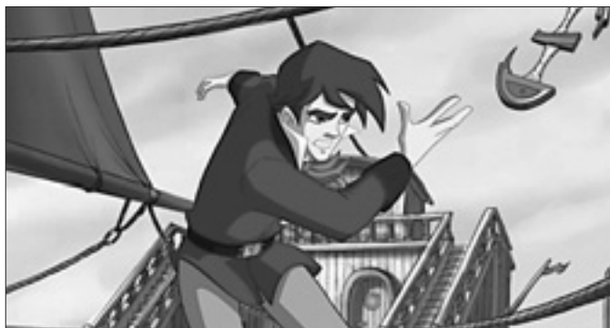
Il giovane Verne in uno degli episodi della serie

La ricetta delle storie del giovane Verne è fatta di scenari dalle tinte sgargianti, di storie dal ritmo incalzante e da una profonda conoscenza della sterminata produzione letteraria del maestro francese della narrazione non mimetica. Alla fine saranno 62 i romanzi firmati da Verne. Ogni episodio della serie ne affronta uno, reinterpretandolo e reinventandolo in modo che Verne stesso ne sia il principale protagonista. Ma non lo scrittore come noi tutti lo conosciamo grazie ai celebri dagherrotipi pubblicati sulle antologie di letteratura. Il Verne delle Strandine av-