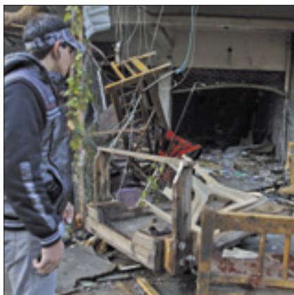
La distruzione provocata dall'esplosione di una bomba a Baghdad

Intanto, le autorità di Baghdad hanno reso noto che ieri sono state eseguite sette condanne a morte: è salito così a 15 il numero delle persone giustiziate in Iraq dall'inizio del 2013. Per la prima volta, segnala l'agenzia Asca, il ministero della Giustizia ha reso noti i nomi dei condannati a morte e i crimini loro contestati.