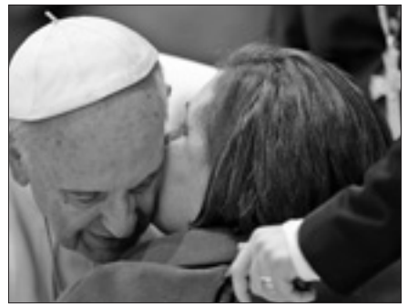
Conclusa la conferenza del dicastero per gli operatori sanitari

Vorrei terminare con un saluto agli anziani. Cari amici, voi non siete solo destinatari dell'annuncio del messaggio evangelico, ma siete sempre, a pieno titolo, anche annunciatori in forza del vostro Battesimo. Ogni giorno voi potete vivere come testimoni del Signore, nelle vostre famiglie, in parrocchia e negli altri ambienti che frequentate, facendo conoscere Cristo e il suo Vangelo, specialmente ai più giovani. Ricordatevi che sono stati due anziani a riconoscere Gesù al Tempio e ad annunziare con gioia, con speranza. Vi affido tutti alla protezione della Madonna, e vi ringrazio di cuore per le vostre preghiere. Adesso, tutti insieme, preghiamo la Madonna per tutti gli operatori sanitari, per gli ammalati, per gli anziani, e poi riceviamo la benedizione ( Ite Maria... ).