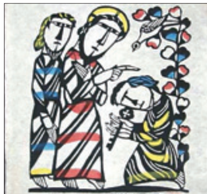
Sadao Watanabe, «Cristo affida le chiavi a Pietro» (1992)

Il Pontefice chiude l'Anno della fede con un doppio appuntamento di preghiera: nel pomeriggio di sabato 23 novembre presiede nella basilica vaticana il rito dell'ammissione al catecumenato di alcuni candidati e domenica mattina celebra la messa in piazza San Pietro. Voluto da Benedetto XVI, che lo ha