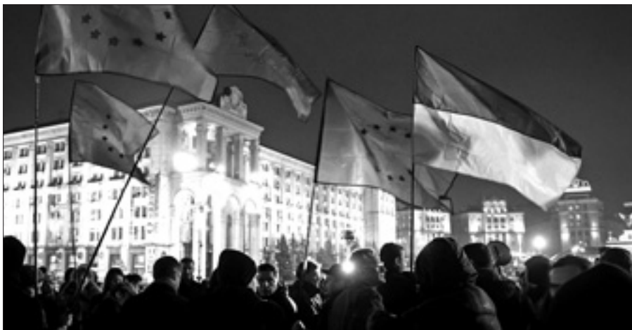
Manifestazioni di protesta nel centro di Kiev

KIEV, 23. L'Unione europea è delusa per la decisione di Kiev, ma non chiude la porta all'Ucraina, anche se il congelamento dell'accordo di associazione, a poco meno di una settimana dal vertice di Vilnius che avrebbe dovuto portare nell'orbita europea i suoi vicini orientali, suona come un fallimento della diplomazia europea.