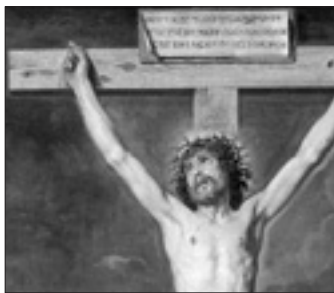
Diego Velázquez, «Cristo crocifisso» (1631, particolare)

La regalità di Gesù ora non è evidente, può essere solo creduta. Si fatica a trovare gli indizi in-dubbi della signoria di Gesù di Nazaret. La storia, più che rivelare, nasconde che Gesù sia il re dell'universo. La ragione sta nel fatto che le prerogative di questa regalità sono singolari e tali da confondere la nostra concezione ed esperienza della regalità stessa. Intanto a essere strana è l'origine della signoria di Gesù, che è il suo sacrificio sulla croce. L'umanità con l'universo intero è acquistata a Gesù Cristo quando nel suo sangue, o nel suo amore, è redenta e liberata. Il mondo diventa possesso di Cristo quando egli per il mondo offre se stesso; gli uomini sono sua eredità perché sono termini del suo servizio. Quindi la carità è la genesi della regalità. Siamo agli antipodi di ogni forma di inganno o di violenza, di soddisfazione di volontà di potenza da cui facilmente le forme umane del potere appaiono generate e inquinate. Eterno e universale è il regno di Cristo, perché sottratto alle volubilità alterne delle vicende umane: Gesù è costituito, fin dall'eternità, l'esemplare e il salvatore di tutti; per tutti e per sempre egli è predestinato a compiere l'opera della liberazione. Il suo regno è regno di verità perché porta nel mondo la Parola di Dio e la rivela a ogni essere, dissipando l'inganno introdotto dal peccato; ed è regno di vita, perché dal dono della sua vita nasce la vita vera, che il peccato mortifica.