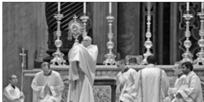
L'adorazione eucaristica in contemporanea mondiale presieduta da Papa Francesco nell'Anno della fede (2 giugno)