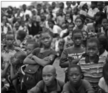
Bambini durante un comizio dei sostenitori del Governo a Bamako

Per il partito al Governo, il Raggruppamento per il Mali (Rpm) del presidente Ibrahim Boubacar Keita,