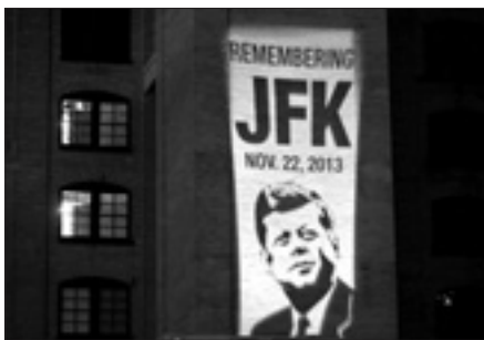
Immagine di Kennedy protetta sui muri di una scuola di Dallas

WASHINGTON, 23. John Fitzgerald Kennedy «resterà un simbolo forte della storia americana». Ha usato queste parole il presidente degli Stati Uniti, Barack Obama, ieri, in un'intervista, a cinquant'anni dall'omicidio di Dallas. Kennedy - ha detto Obama - «è riuscito a catturare l'idealismo e la capacità di immaginazione di un Paese; non conosco persona che abbia lasciato un'impronta comparabile alla sua». Di Kennedy il presidente ha elogiato «il suo talento, il suo coraggio nel corso della seconda guerra mondiale e la sua eloquenza». Ieri l'America si è fermata per ricordare Jfk, con le bandiere a mezz'asta in tutto il Paese e un minuto di silenzio (esattamente alle 12:30, quando Kennedy venne colpito). Manifestazioni anche a Dallas.