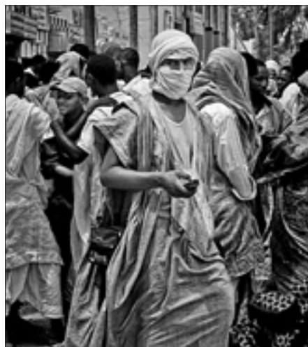
Giovane nelle strade di Nouakchott

MASERU, 23. I contadini del Sud Africa stanno aiutando i loro vicini del Lesotho a far fronte alle conseguenze di una delle peggiori siccità nella storia recente di questo piccolo reo. Lo fanno con la consegna, a partire da ieri, di quasi 5000 sacchi da 25 chilogrammi di granturco l'uno. Secondo Palesa Mokoemele, portavoce del ministero dell'Agricoltura del Sud Africa, le scorte che saranno consegnate al Lesotho sono state acquistate da cooperative di contadini attraverso un meccanismo gestito dal Governo insieme con il Programma alimentare mondiale