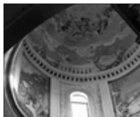
Interno della cupola della chiesa di Santa Maria Assunta a Praglia

Non accontentandosi di coinvolgere solo la vista («veddemmo la sua gloria»), il Divino artigiano