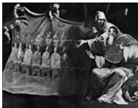
Stebatiano Ricci, «Papa Paolo III ha la visione del Concilio di Trento» (1687-1688)