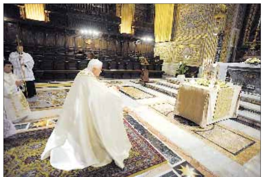
El Papa Benedicto XVI rezando ante la reliquia —el corazón— del santo cura de Ars, en la capilla del Coro de la basílica vaticana, el viernes 19 de junio, solemnidad del Sagrado Corazón

En su homilía, que publicamos en la página 5, explicó en primer lugar que en la solemnidad del Sagrado Corazón de Jesús la Iglesia presenta a nuestra contemplación «el misterio del corazón de un Dios que se conmueve y derrama todo su amor sobre la humanidad. Un amor misterioso, que en los textos del Nuevo Testamento se nos revela como inconmensurable pasión de Dios por el hombre». Luego, añadió: «¿Cómo no recordar con conmoción que de este Corazón ha brotado directamente el don de nuestro ministerio sacerdotal? ¿Cómo olvidar que los presbíteros hemos sido consagrados para servir, humilde y autorizadamente, al sacerdocio común de los fieles? Nuestra misión es indispensable para la Iglesia y para el mundo, que exige fidelidad plena a Cristo y unión incesante con él, o sea, permanecer en su amor; esto exige que busquemos constantemente