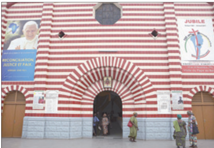
La catedral de Cotonú, Benín, preparada para la visita del Papa Benedicto XVI

La primera etapa de este viaje es Cotonú, donde el viernes 18 tiene lugar la ceremonia de bienvenida y el encuentro con la población en la catedral de «Notre Dame». La jornada del sábado 19 es particularmente intensa: comienza con la visita oficial al presidente de la República y el encuentro con las autoridades del Gobierno y el Cuerpo diplo-