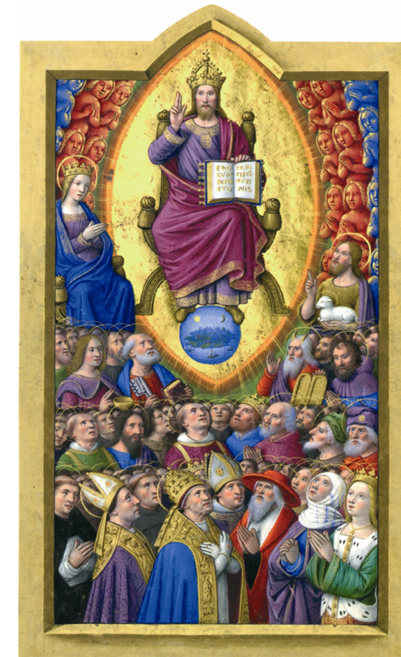
Jean Bourdichon – Tours – Vers 1503-1508