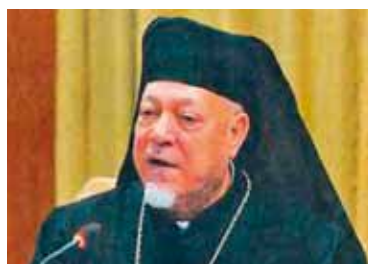
Cardenal Antonios Naguib, Patriarca Copto.

En los países de lengua alemana con frecuencia se ha generalizado la opinión de que la Iglesia, y sobre todo Roma, dedica más energías al ecumenismo con las Iglesias orientales que al ecumenismo con los luteranos y reformados. ¿Es verdad?