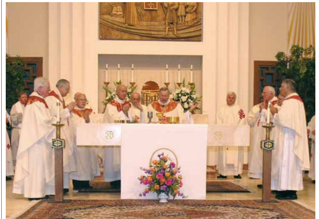
La Misa de Investidura concelebrada con Arzobispos y Obispos.

El Encuentro y la Investidura anuales de 2011 están previstos en Nueva Orleans, que muchos consideran la ciudad reina del sur. En los últimos años, esta ciudad, que fue meta de visitas y sede de obras de numerosos santos americanos, ha sufrido mucho a causa de huracanes y de la fuga de petróleo de BP, la catástrofe más grave que América haya sufrido nunca. Se pensó que podía ser una sede válida para nuestro encuentro y nuestra ceremonia de investidura de 2011.