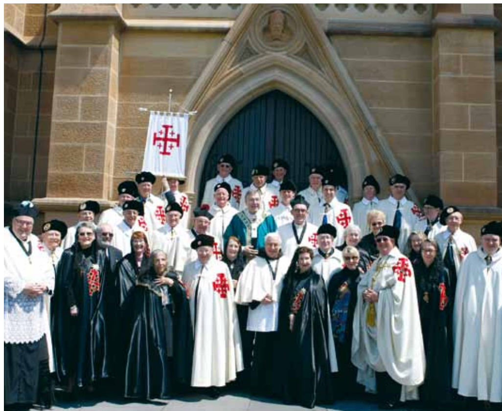
Fotografía de grupo después de la investidura.

El acontecimiento más significativo para la Lugartenencia australiana de Nueva Gales del Sur fue la extensión de la Orden a Nueva Zelanda, nuestro vecino más próximo, a sólo 2000 kilómetros aproximadamente o a tres horas y media de vuelo. Cuando en 2009 el cardenal Gran Maestre visitó Australia se llevaron a cabo debates acerca de una respuesta apropiada a las peticiones que Nueva Zelanda había dirigido