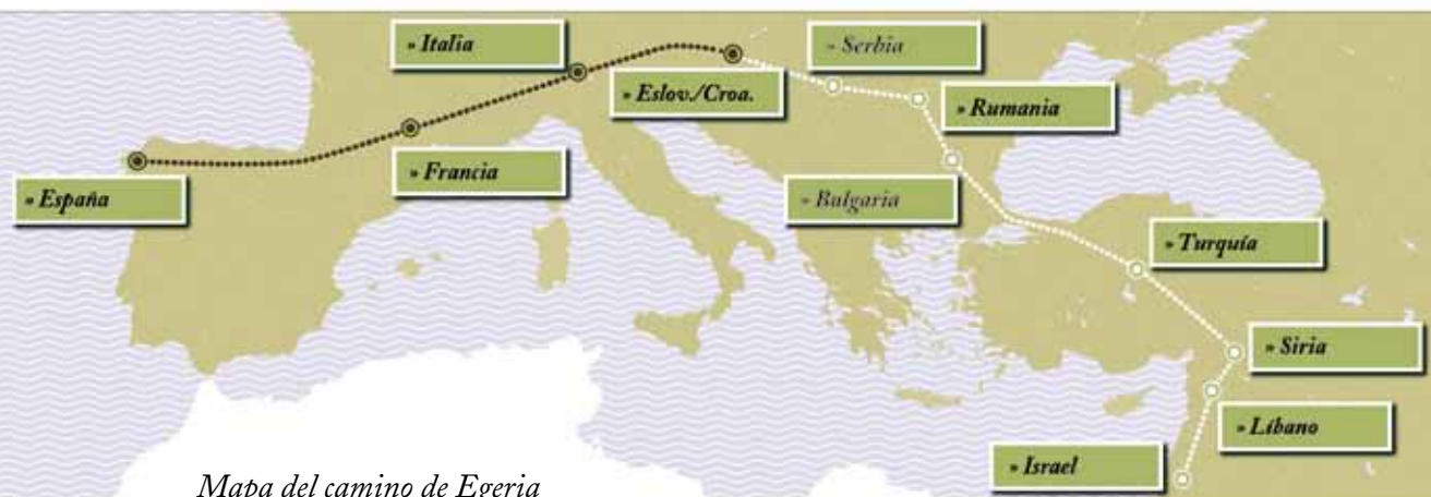
Mapa del camino de Egeria