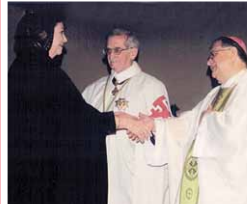
Iglesia de Santa Bibiana, ascensos, noviembre de 2010.