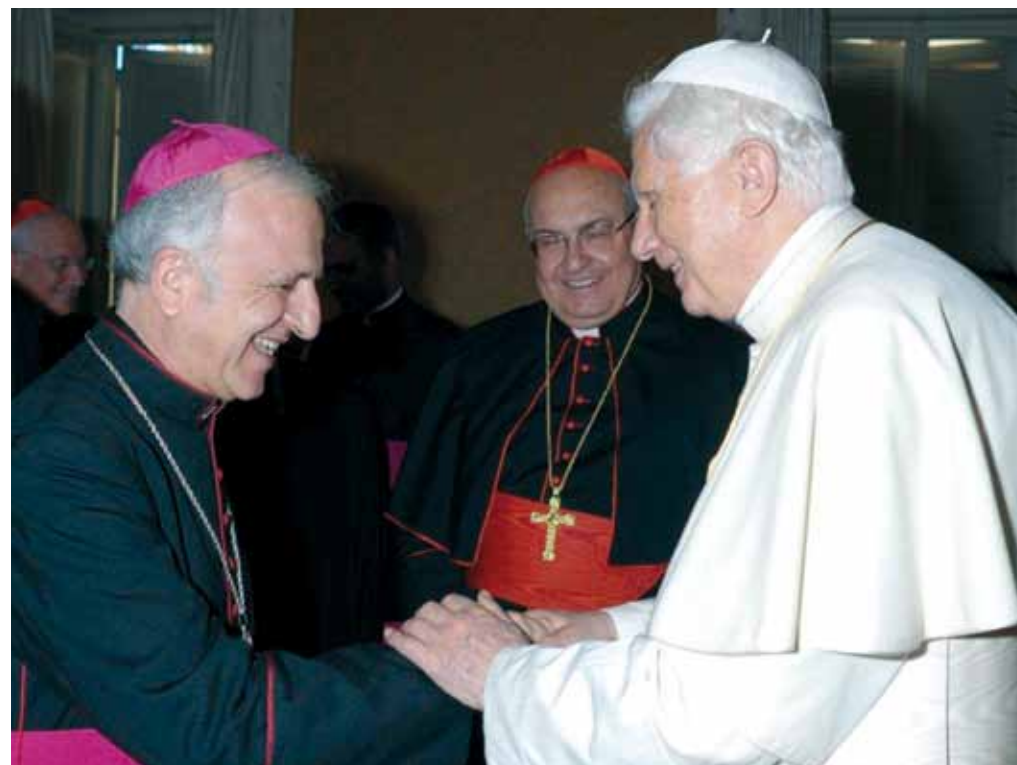
Obispo William Shomali con el Papa Benedicto XVI.

Se necesita mucho dinero y mucho esfuerzo para reparar las decenas de casas religiosas que pertenecen al Patriarcado latino: es preciso hacerlo y la Orden se compromete cada año a restaurar algunas.