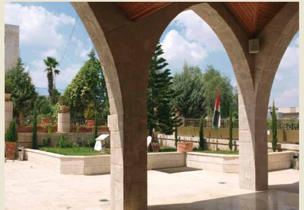
Escuela en Beit Sabour.