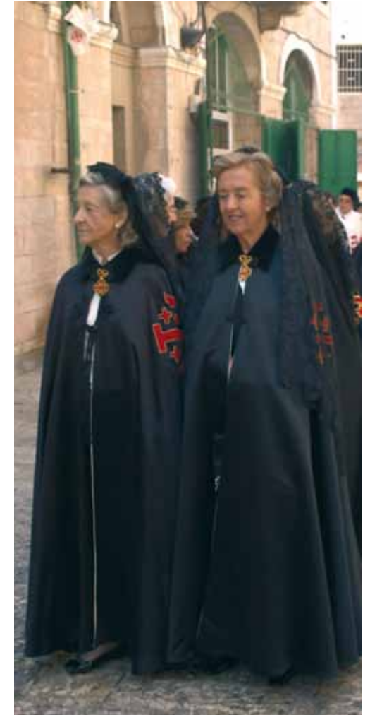
Procesión de la Lugartenencia Portuguesa en el barrio árabe de Jerusalén.

La peregrinación comenzó el 2 de octubre con la celebración, a las tres de la tarde, de la Santa Misa en la Catedral de San Miguel y Santa Gúdula en Bruselas, durante una parada del viaje de Portugal a Israel. El 4 de octubre tuvo lugar la Vigilia de las Armas en la concatedral del Patriarcado Latino de Jerusalén. Al día siguiente, los Caballeros y Damas del Santo Sepulcro, acompañados por el Lugarteniente de Bélgica, François t’Kint de Roodenbeke, KGC, realizaron una procesión a pie, desde el Patriarcado Latino hasta la Basílica del Santo Sepulcro, a