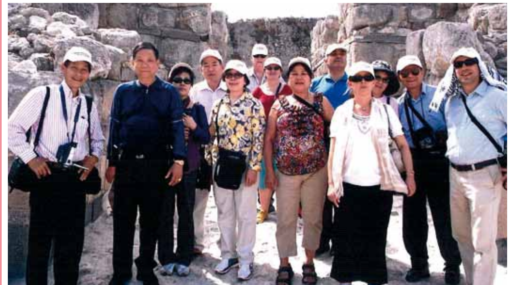
Un grupo de 13, incluyendo a Caballeros y Damas y sus cónyuges, posaron para una foto de grupo en Megido durante la peregrinación a Tierra Santa en octubre de 2010.