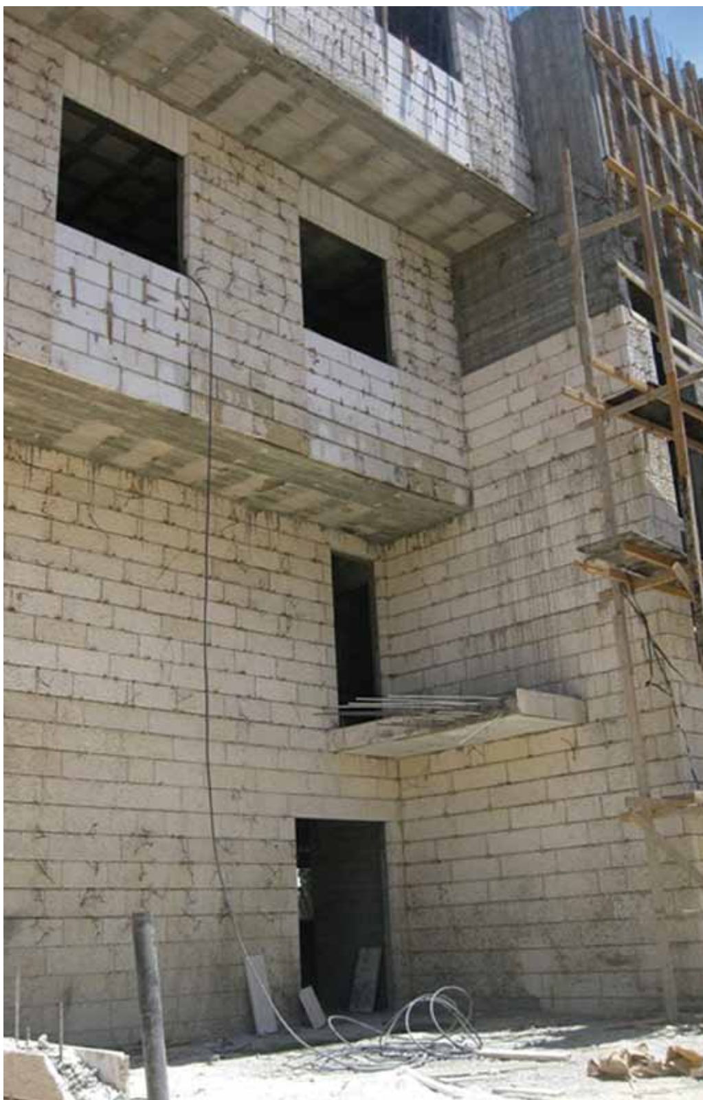
Viviendas en construcción en Beit Safafa.

A comienzos de 2004 el Patriarcado adquirió una parcela de terreno donde 40 familias pudieron satisfacer su necesidad de un alojamiento digno. Asimismo, el Patriarcado proporcionó los profesionales necesarios para hacer los planes adecuados y obtener los permisos de obras.