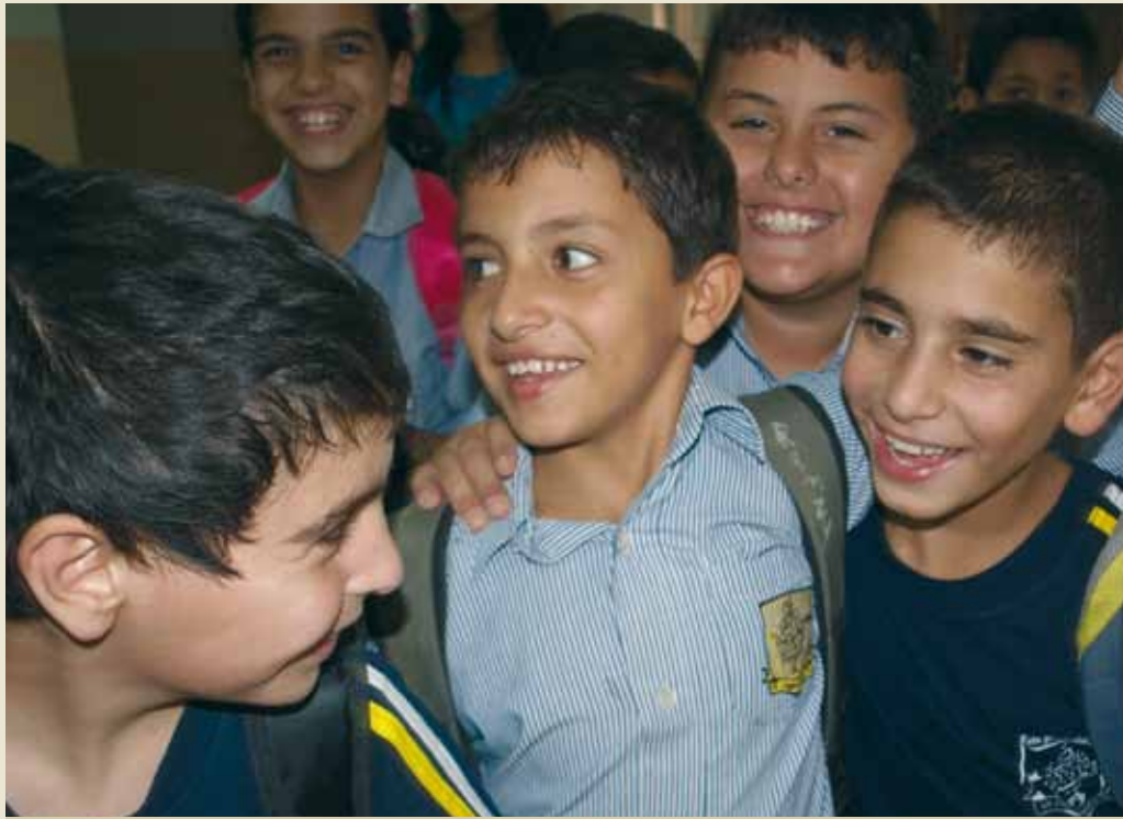
Beit Jala, Escuela San Javier.