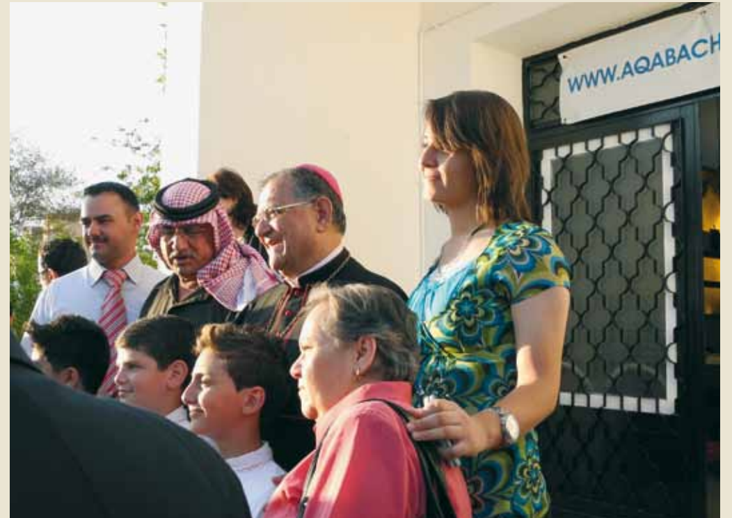
Aqaba, después de la Confirmación.