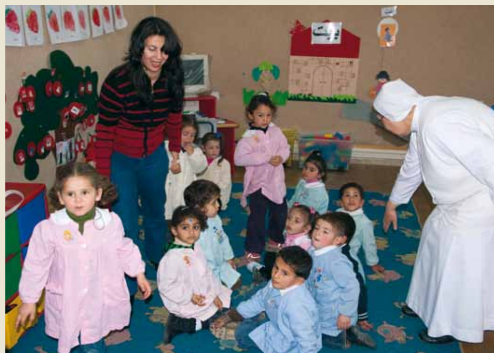
Escuela Epheta, Belén.

Además de la financiación de los proyectos que acabamos de enumerar, en 2010 se añadieron a los recursos otros 2,7 millones de euros (cerca de 3,7 millones de dólares). De esta suma, 1.990.000 euros están destinados a proyectos del Patriarcado Latino y 700.000 euros a las Universidades de Belén y de Madaba.