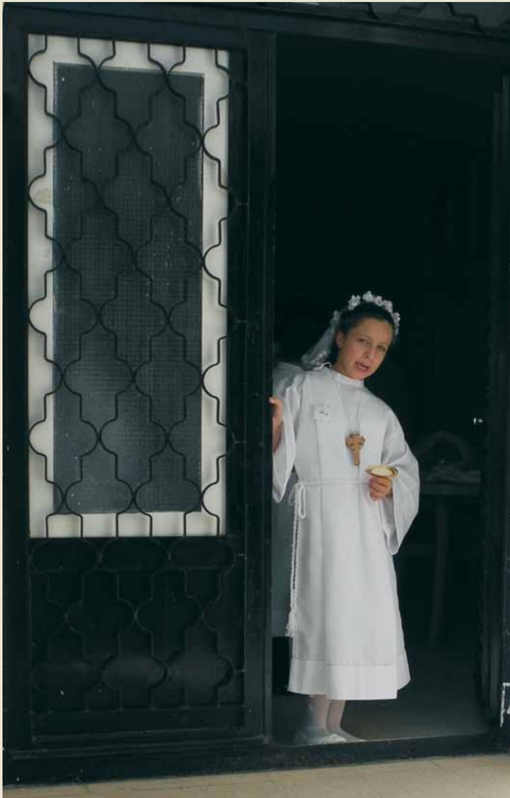
Confirmación en Aqaba.