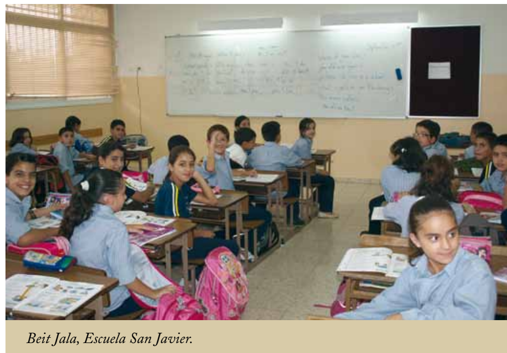
Beit Jala, Escuela San Javier.

El proyecto consistía en la reasignación del jardín de infancia a la planta baja, debajo del convento de las Hermanas del Rosario, y en la construcción de un paso elevado que conecta la primera planta de los dos edificios escolares, lo cual permite recuperar seis aulas adicionales. Se renovó completamente toda la escuela (incluidos los cuartos de baño, la instalación eléctrica y el sistema de calefacción, nuevas