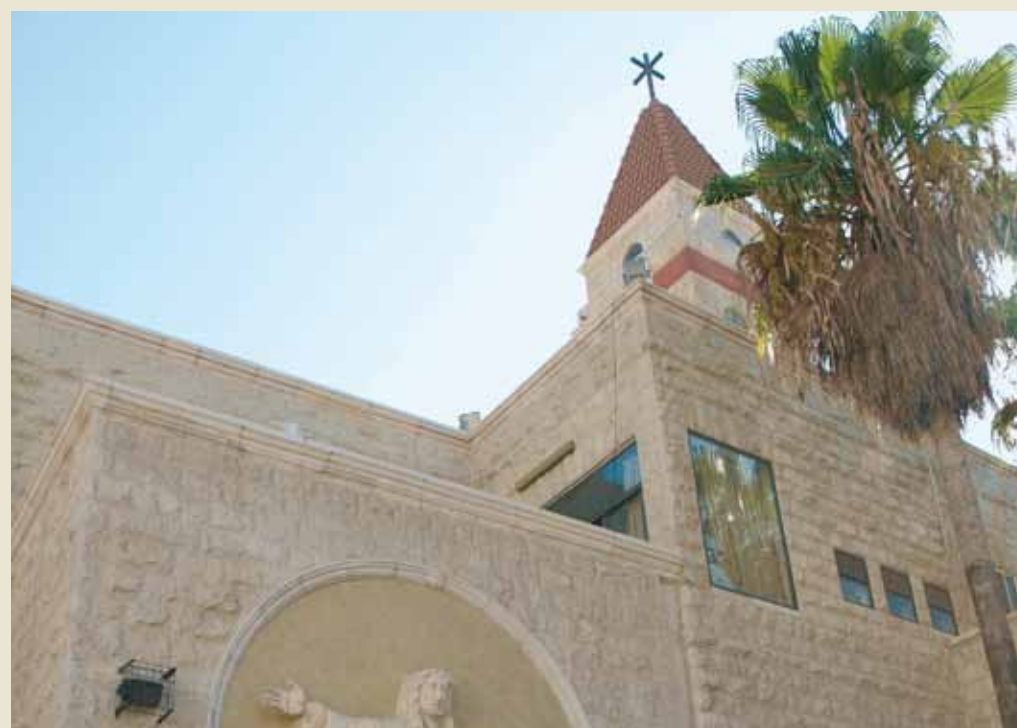
Casa parroquial, Misdar.