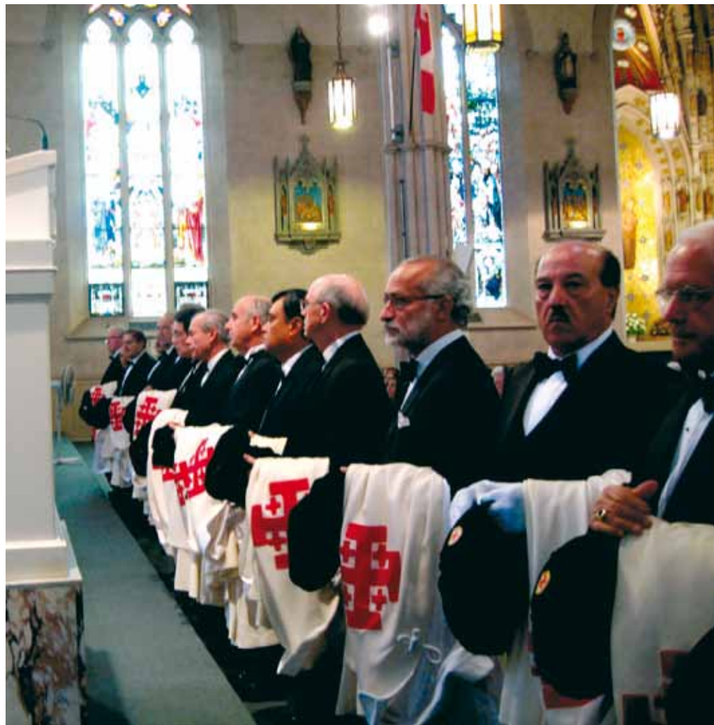
Candidatos a Caballeros en la ceremonia de investidura, Catedral de S. Michael, Toronto.