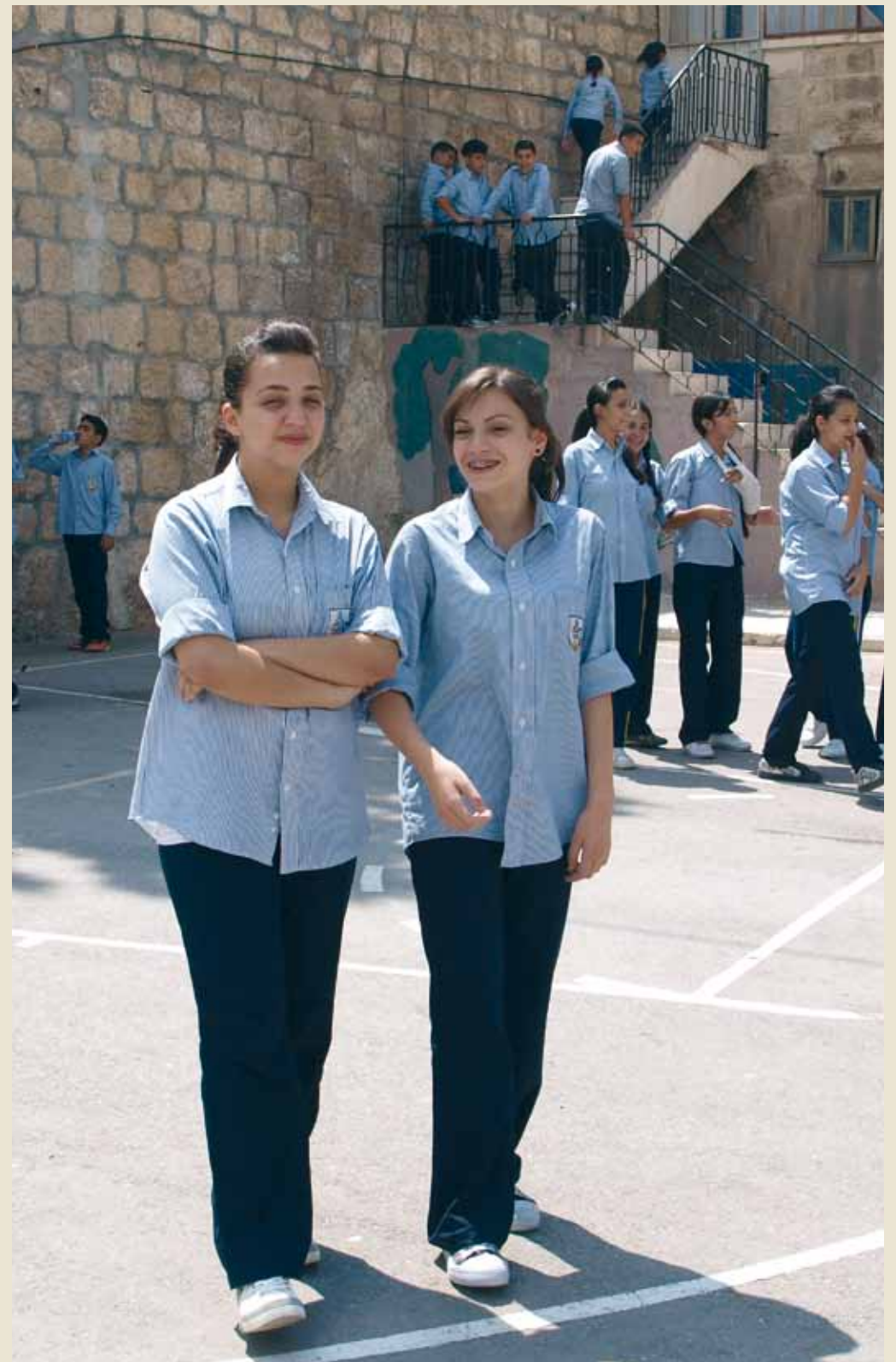
Escuela en Beit Sabour.