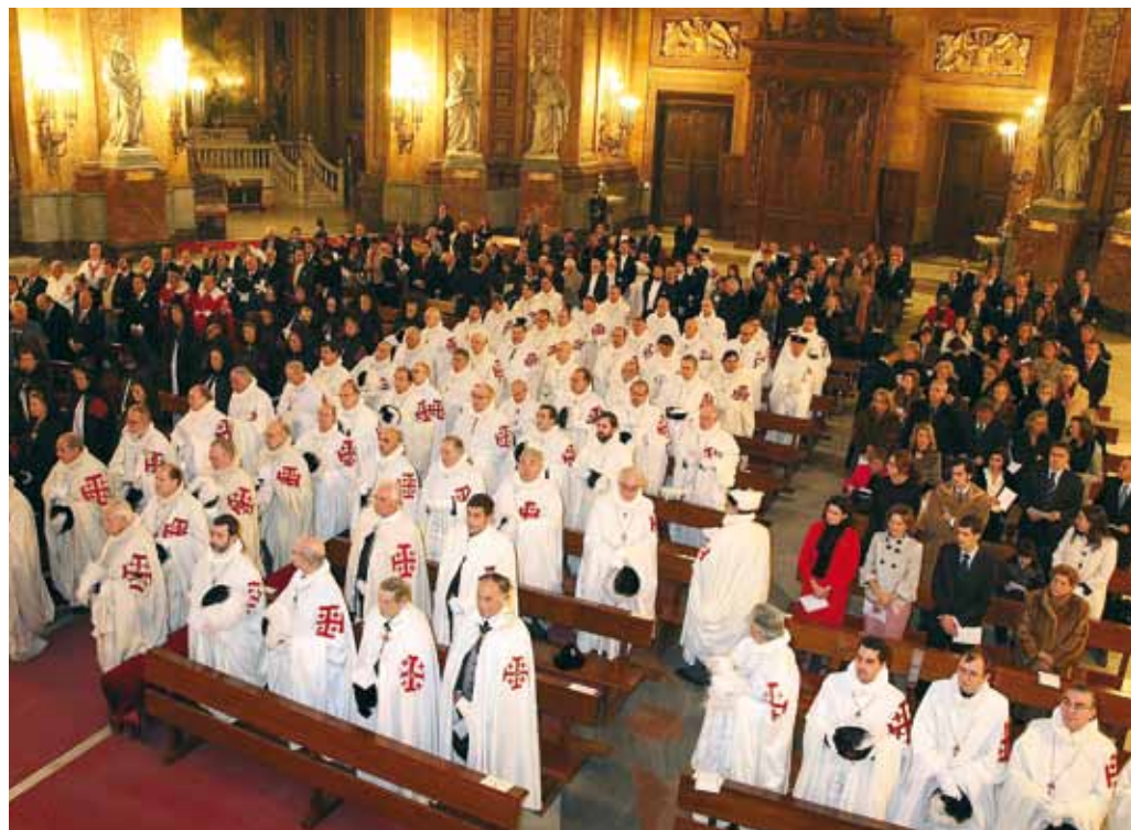
Investidura en España.