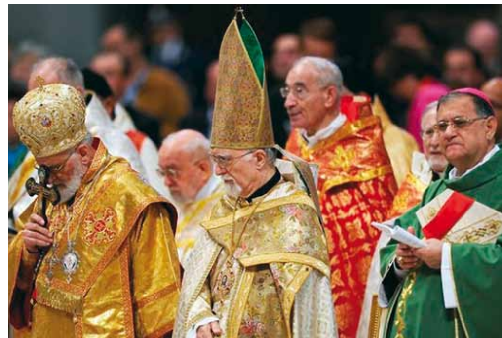
Sacerdotes durante el Sínodo.