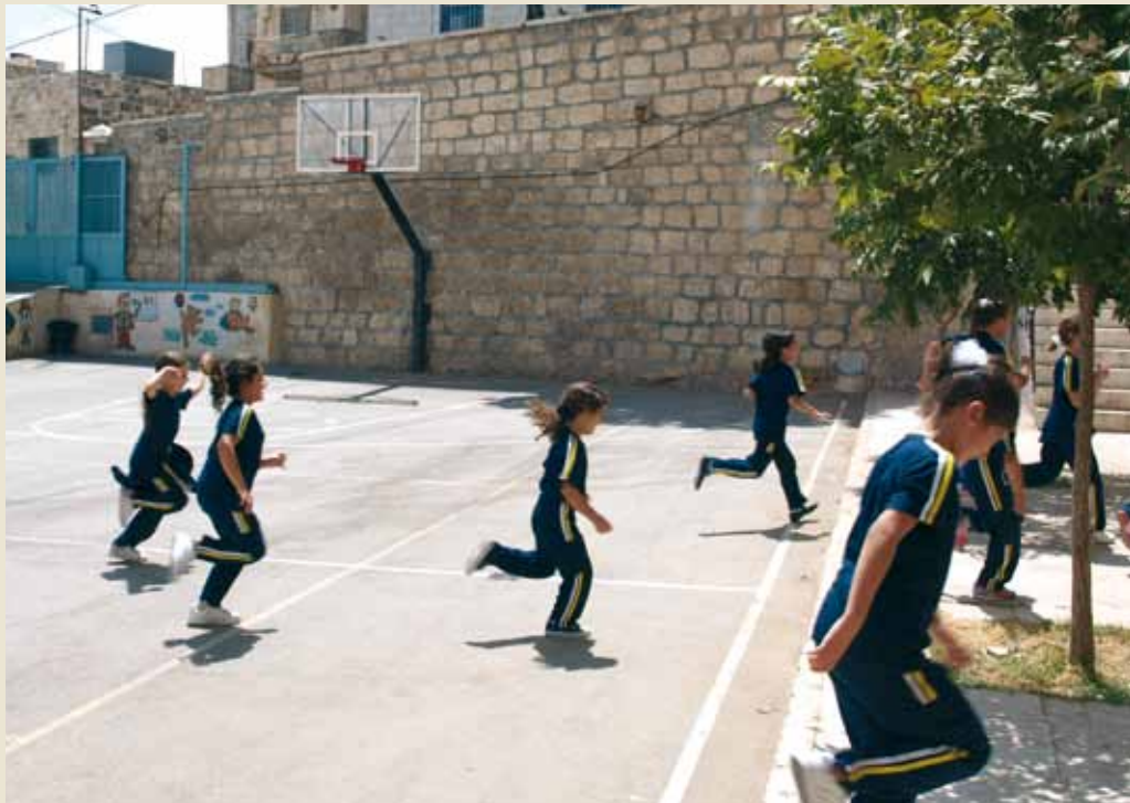
Escuela en Beit Sabour.