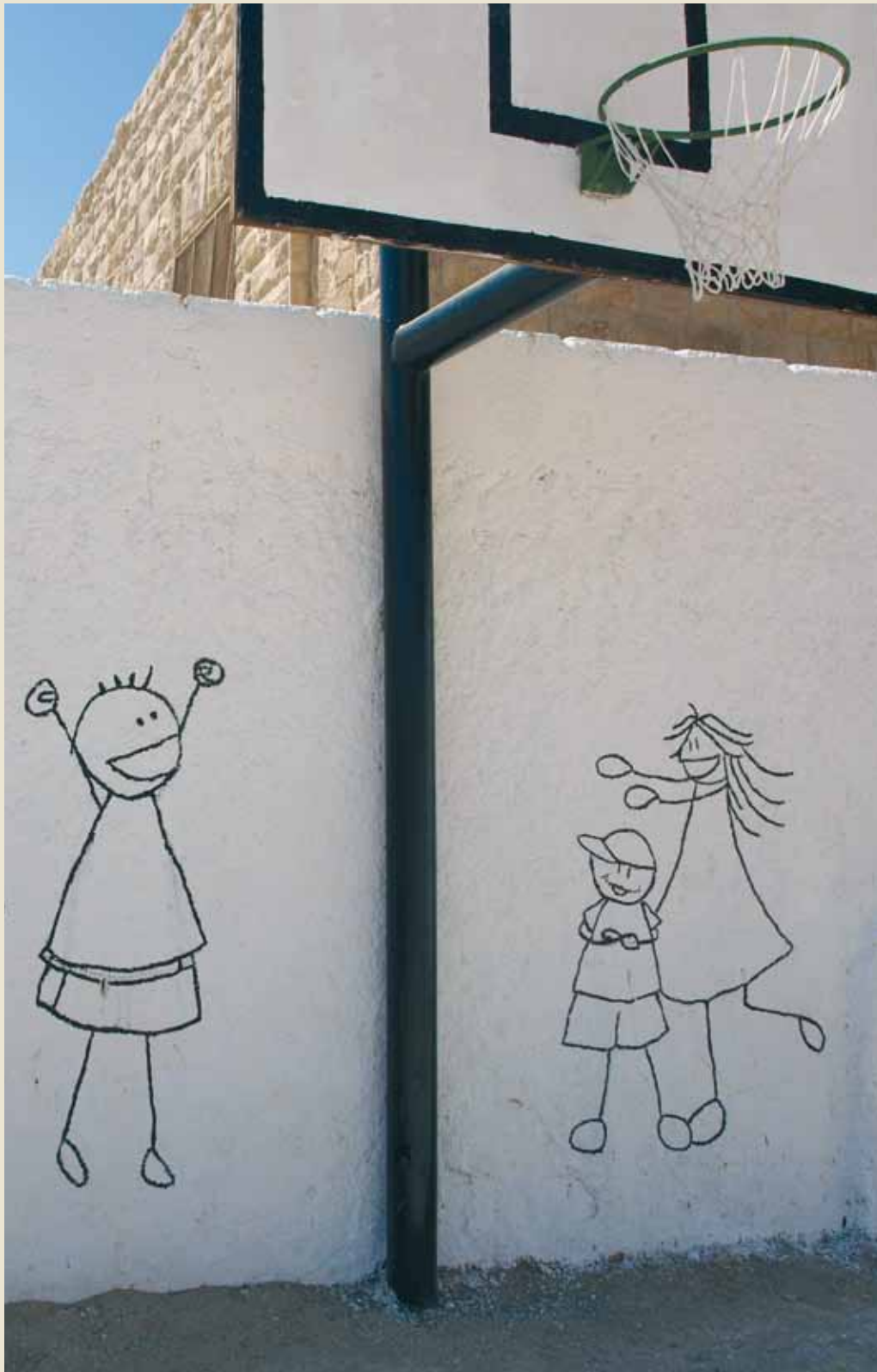
Área de juegos infantiles en Samkieh.