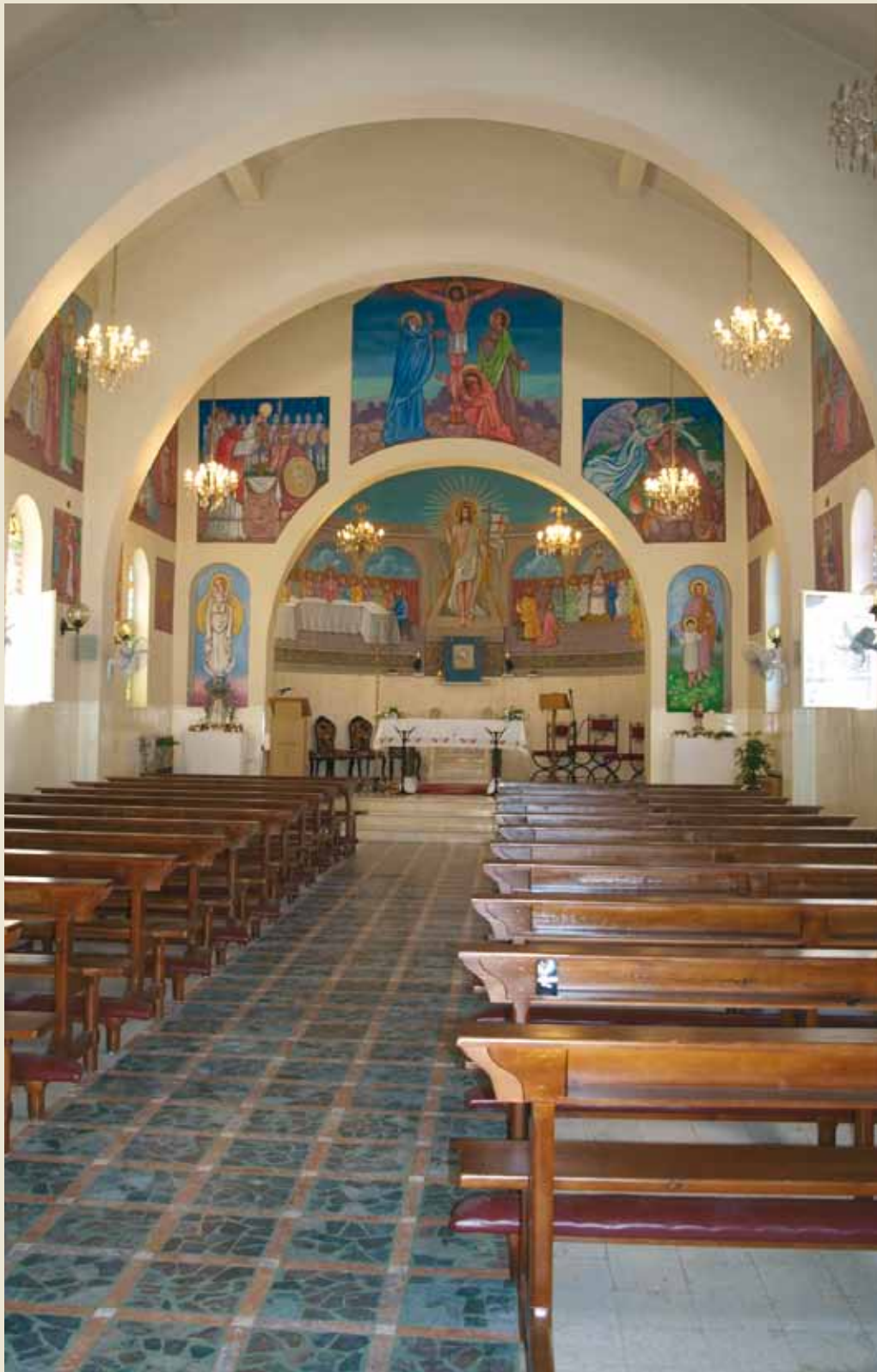
Iglesia en Anjara, Jordania, la cual es un lugar de peregrinación mariana.