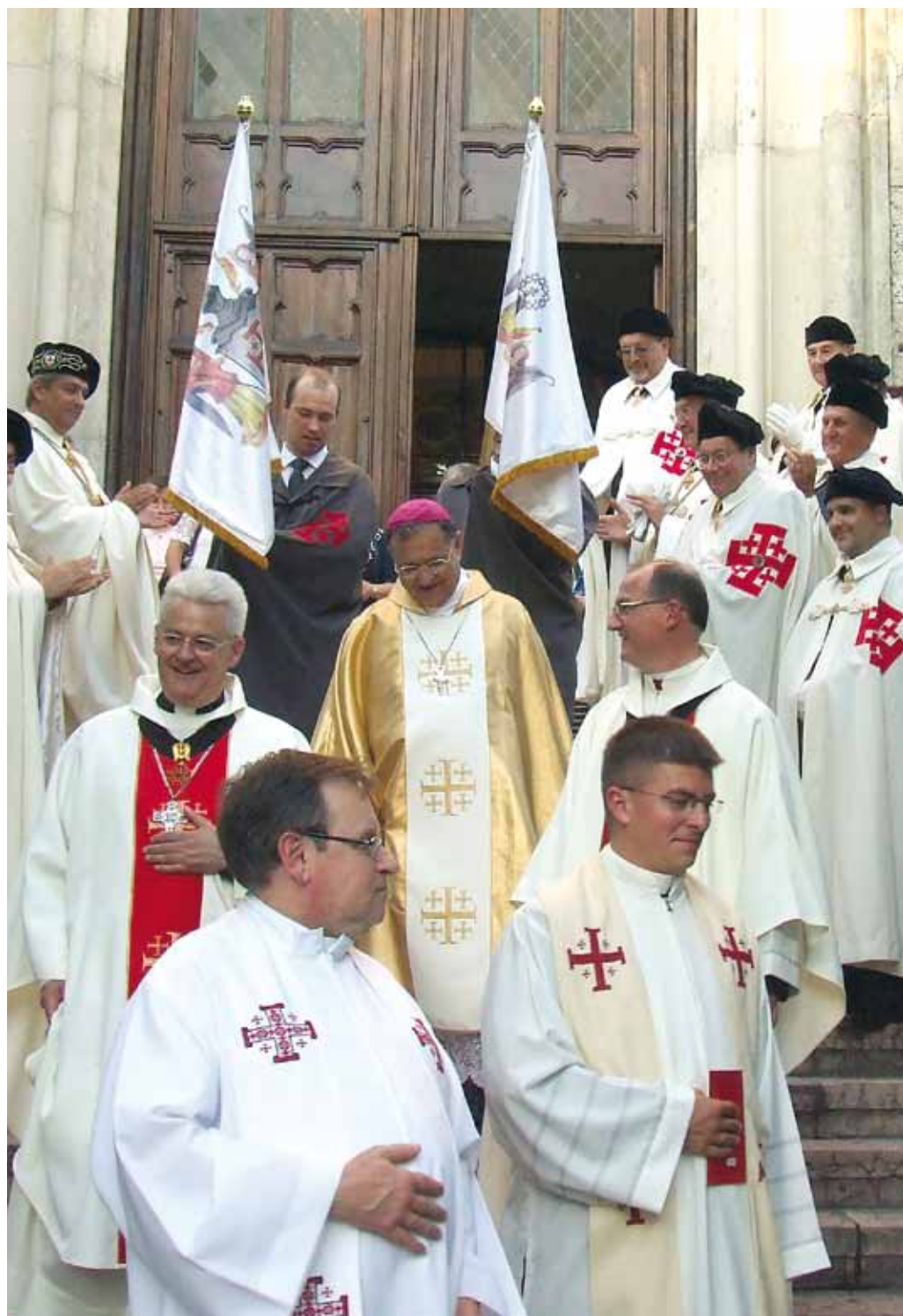
Su Beatitud después de la Misa en la Capilla de la Lugartenencia húngara.