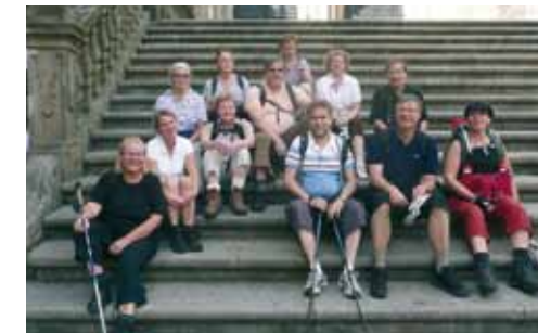
Peregrinos finlandeses en Tierra Santa.