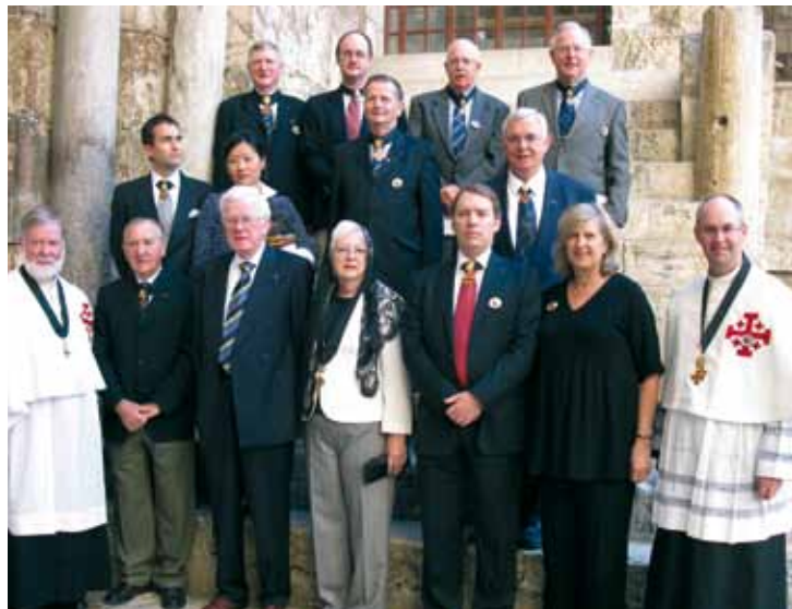
Miembros de la Lugartenencia de Victoria durante la primera peregrinación oficial a Tierra Santa en la escalinata de la Basílica del Santo Sepulcro de Jerusalén.

Los Caballeros y las Damas acogieron favorablemente la iniciativa de este auténtico testimonio católico en nuestro mundo.