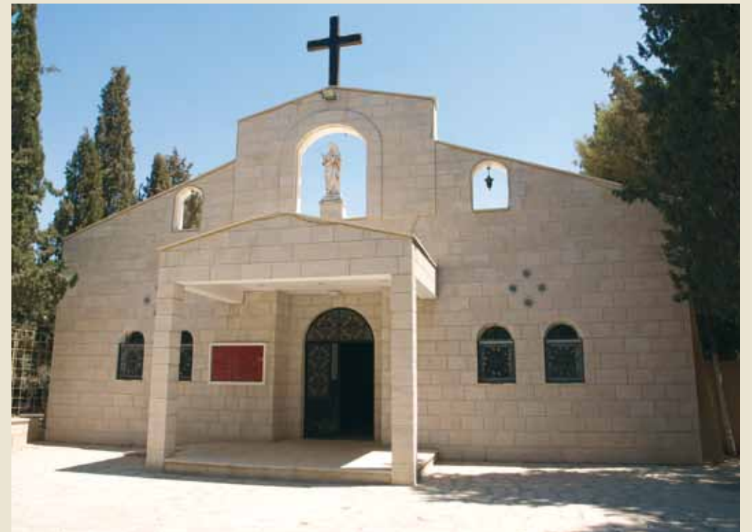
Iglesia en Ader.