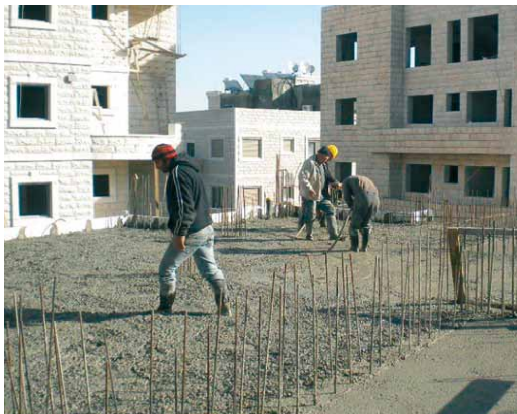
Casas en construcción en Beit Safafa.

El espectro de dichas actividades es muy amplio: comprende desde las inversiones y colectas que se realizan regularmente, hasta la participación en un maratón de beneficencia. Los verdaderos objetivos han sido siempre la promoción de la conducta de vida cristiana y el sostén a los cristianos y a la Iglesia católica en Tierra Santa (conforme al artículo 2 de la Constitución de la Orden). Se dan las gracias a las diversas Lugartenencias por haber puesto a disposición las fotografías.