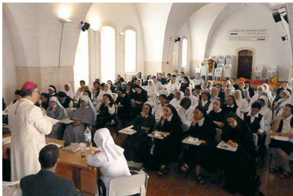
Preparación del Sínodo.

«Esta es una percepción que encuentro muy a menudo en Alemania, que sin embargo no es correcta. Cuando el Papa eligió a mi sucesor, me dijo expresamente que quería a alguien que fuera de lengua alemana y que conociera las Iglesias de la Reforma. Aquí se piensa más a partir de la Iglesia universal y, por tanto, se tienen en cuenta aspectos completamente distintos. Por consiguiente, se trata de una perspectiva diferente de la que se tiene en Alemania. Por lo demás, Oriente Próximo y Oriente Medio son un problema a nivel mundial, así como la madre de muchos otros conflictos, y esto los convierte también en un enorme problema para los alemanes».