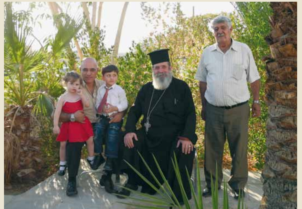
Sacerdote ortodoxo se une a las festividades.