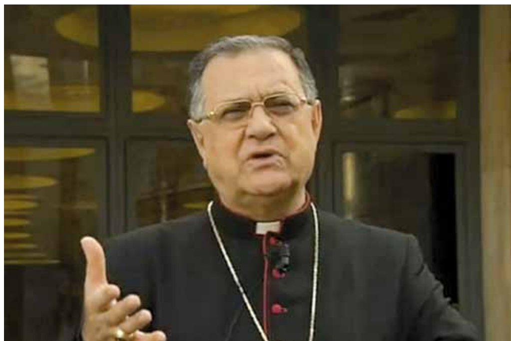
Patriarca Fouad Twal.

En el diálogo con los musulmanes es fundamental subrayar la dignidad de la persona humana, la igualdad de derechos y deberes, así como la libertad de religión, incluidas las libertades de culto y de conciencia. Los cristianos en Medio Oriente deben abandonar los prejuicios negativos respecto a los musulmanes y contrastar junto con ellos el fundamentalismo y la violencia en nombre de la religión.