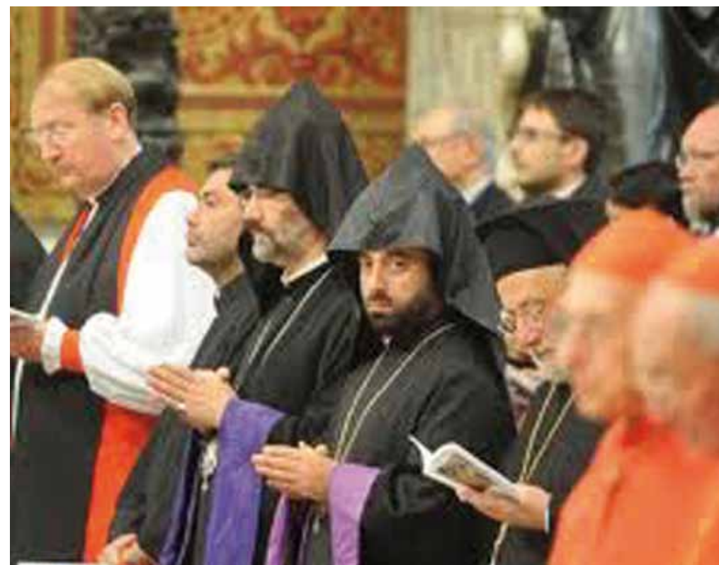
Las diversas facetas del Sínodo.