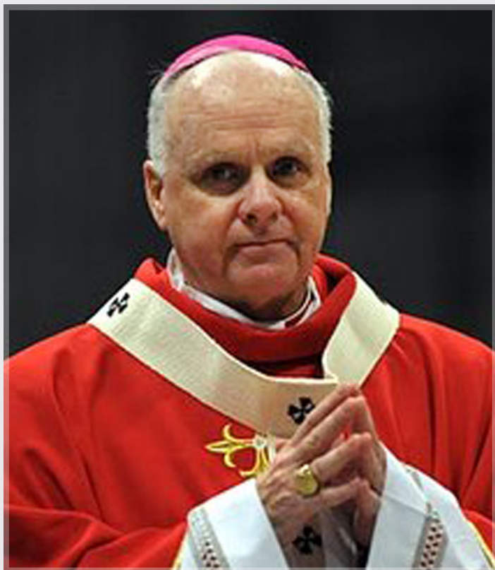
Son Excellence Révérendissime Monseigneur Edwin Frederick O'Brien