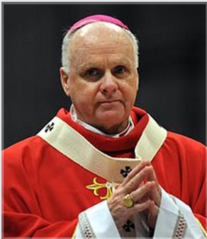
Son Excellence Révérendissime Monseigneur Edwin Frederick O'Brien