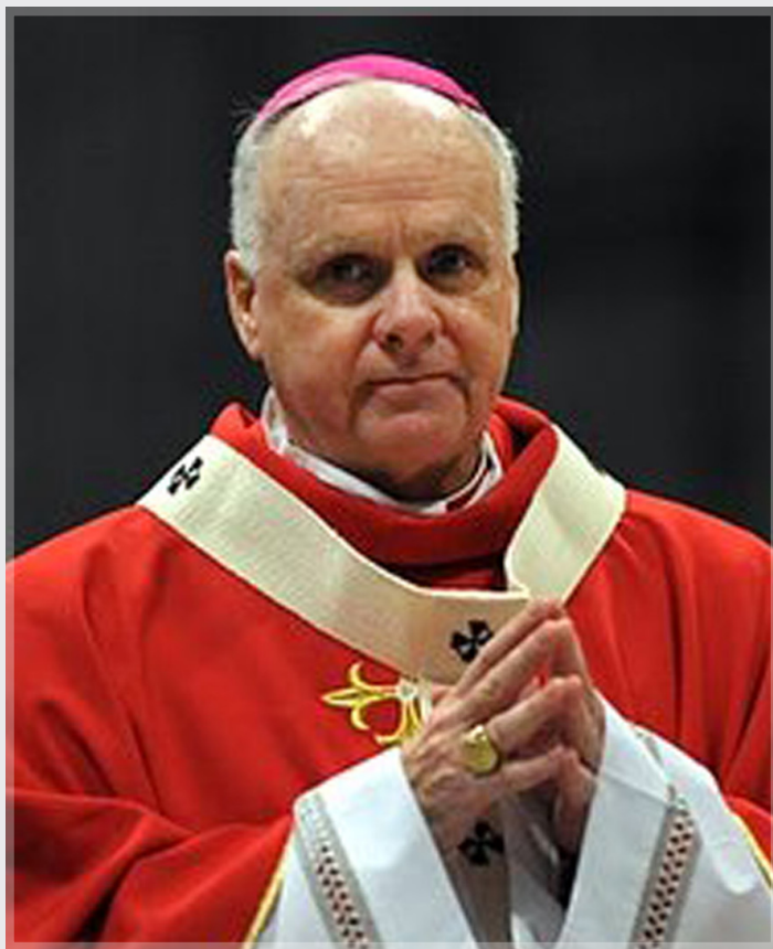
Reverendísimo Edwin Frederick O'Brien