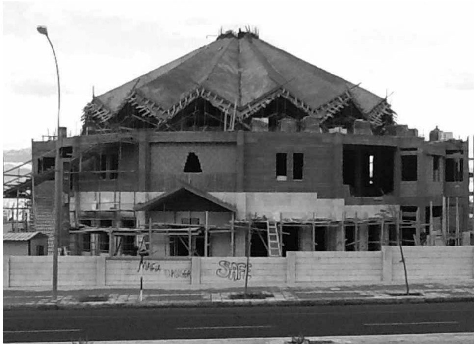
Lo stato di avanzata costruzione, a fine marzo, della chiesa Stella Maris di Aqaba

L' Ordine Eque- stre del Santo Sepolcro di Gerusalemme è im- pegnato, ancora nel 2012, nella realizza- zione dei due più im- pegnativi progetti del Patriarcato Latino i cui lavori sono stati intrapresi l'anno scorso: riguardano la costruzione ad Aqa- ba, in Giordania, del- la Chiesa parrocchia- le Stella Maris e del- l'annesso grande sa- lone multifunzionale e a Rameh, in Gali- lea, della Scuola su- periore.