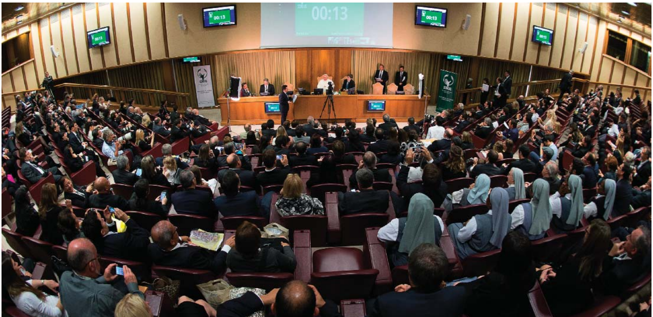
El Papa unido por videoconferencia con alumnos de diferentes escuelas en el mundo, en directo desde la sala del Sínodo

escuelas para el encuentro" había organizado una videoconferencia en directo desde la sala del Sínodo, cerca de la Casa Santa Marta, en la que participaron particularmente niños de Israel. "Tended puentes de paz, jugad en equipo y haced un futuro mejor", les dijo Francisco. En relación con ese congreso de la red Scholas también ha tenido lugar, en ese mismo periodo, el partido interreligioso por la paz con la presencia del futbolista argentino Diego Maradona, que ha declarado querer volver a la práctica de la fe católica, conmovido por el testimonio de vida evangélica del Papa Francisco. También nos queda a nosotros, a todos los niveles de la Orden del Santo Sepulcro, construir puentes en vez de construir muros. "La esperanza ve lo que no es todavía, pero que será. Ama lo que aún no es y lo que será" (Charles Péguy).