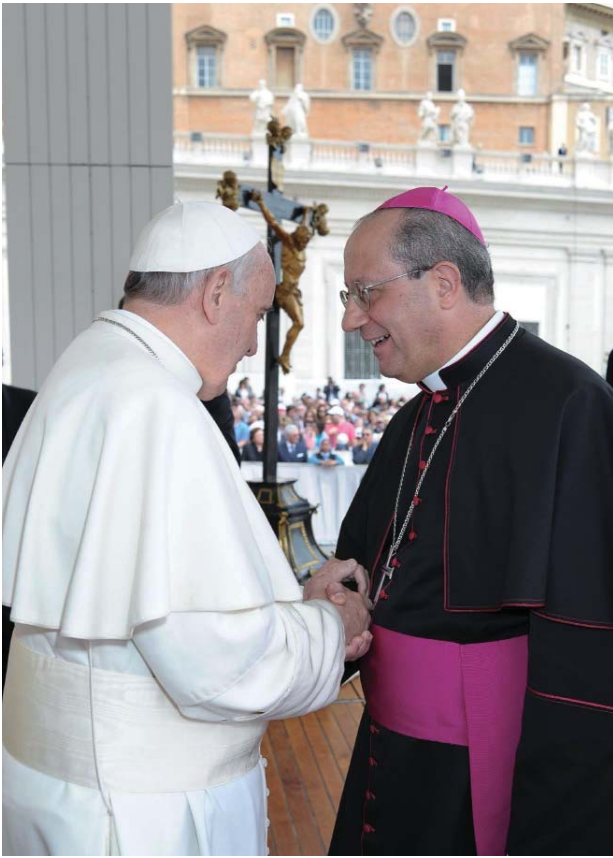
Mons. Bruno Forte con el Papa Francisco

a través de las elecciones humildes y valientes de fidelidad a Dios y al pueblo.