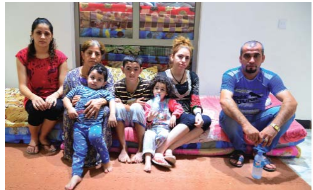
Une famille de réfugiés au Moyen-Orient, qui espère pouvoir retourner un jour sur la terre de ses ancêtres.

res persécutés dans le vaste espace des territoires bibliques, en Irak et en Syrie spécialement, le Conseil de Sécurité de l'ONU décida de consacrer récemment une réunion à la défense des chrétiens d'Orient menacés de disparition, présidée par le ministre français des affaires étrangères. Émettant « quelques réserves sur ces belles déclarations », le directeur de l'Aide à l'Eglise en Détresse en France faisait ce commentaire éclairant au micro de radio Vatican : « Malheureusement, force est de reconnaître que pour le moment, il y a une espèce d'unanimité à continuer de soutenir et financer tous les djihadistes mercenaires dans l'est syrien avec comme objectif prioritaire de renverser Bachar el-Assad ». Quoiqu'il en soit du cynisme opportuniste géopolitique, le Pape attire l'attention du monde entier sur le drame de ces personnes innocentes victimes d'une véritable épuration religieuse. Invoquons Dieu avec lui pour que cesse cette « persécution contre les chrétiens que le monde cherche à cacher », en remerciant aussi ces frères dans la foi pour l'espérance dont ils témoignent.