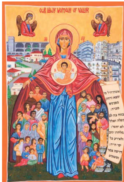
icône de Notre-Dame Femme Vaillante, protectrice des migrants en Israël.