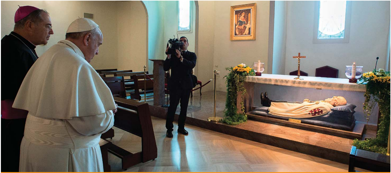
Le Pape François à Pompéi, se recueillant devant le corps du bienheureux Bartolo Longo, Chevalier du Saint-Sépulcre, serviteur des pauvres et apôtre de la prière du Rosaire.

vré aux habitants les plus pauvres de cette ville italienne sinistrée par un chômage et une corruption endémiques. Invoquons Bartolo Longo, le seul laïc membre de l'Or-