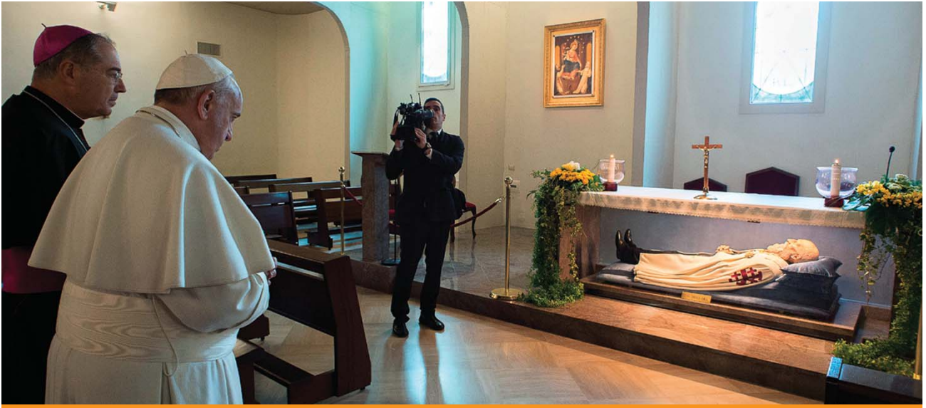
El Papa Francisco en Pompeya rezando delante del cuerpo del beato Bartolo Longo, Caballero del Santo Sepulcro, siervo de los pobres y apóstol de la oración del Rosario.

brado a los habitantes más pobres de esta ciudad italiana siniestrada por un paro y una corrupción endémicas. Invoquemos a Bartolo Longo, el único laico miembro de la Or-