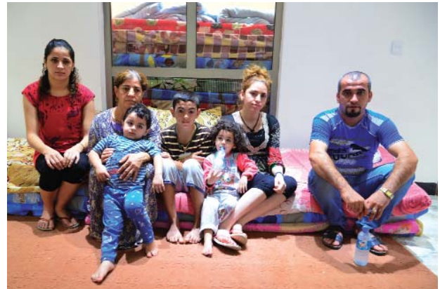
Una familia en Oriente Medio que espera poder volver un día a la tierra de sus antepasados.

Confrontados a la violencia contra los cristianos en los países de Oriente Medio, católicos, ortodoxos o protestantes viven un verdadero "ecumenismo de sangre". Durante su mensaje de Cuaresma, el Papa Francisco nos invitaba a resistir a la "globalización de la indiferencia" – que atañe en particular a esos fieles de Cristo discriminados en la tierra de sus antepasados – y proponía una iniciativa concreta, "24 horas para el Señor", los días 13 y 14 de marzo, para demostrar esta necesidad de oración para "no dejarnos absorber por esta espiral de horror y de impotencia" frente a las noticias e imágenes conmovedoras que nos narran el sufrimiento humano. "Podemos orar en la comunión con la Iglesia terrenal y celestial. No olvidemos la fuerza de la oración", insistió hablando de esta iniciativa que fue relegada por todas las diócesis, sobre todo con la ayuda de los miembros de la Orden del Santo Sepulcro que también ayudan con gestos de caridad. Gracias sin duda a la atención permanente dada por el Santo Padre a nuestros hermanos perseguidos en este