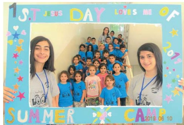
Los campamentos de verano para los niños, en particular, se encuentran entre los pequeños proyectos con una dimensión humana, financiados por la Orden del Santo Sepulcro.