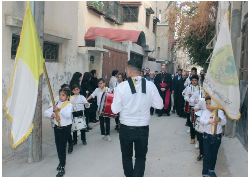
Una visita del Administrador apostólico del Patriarcado latino de Jerusalén a Gaza, el enclave palestino donde la Orden del Santo Sepulcro ayuda bastante con sus donaciones a su población que sufre mucho.

Entre otros proyectos menores, la Youth of Jesus' Homeland Palestine (Juventud de la Patria de Jesús Palestina) , que reúne a 3.500 jóvenes cristianos de Palestina, con edades comprendidas entre los 7 y los 35 años, ha podido comprar un vehículo de segunda mano de siete plazas para poder llevar a cabo sus actividades con mayor facilidad, mientras que la escuela de Zababdeh (Palestina) logró adquirir un nuevo equipo informático para mejorar la calidad de la enseñanza y el aprendizaje.