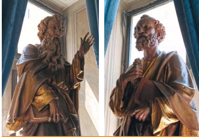
Las imágenes de los apóstoles Pedro y Pablo, que son las columnas de la Iglesia, se encuentran en la gran sala del Palazzo della Rovere, signos del vínculo que existe y une a la Orden del Santo Sepulcro con la Iglesia universal.

Pablo VI, con motivo de la segunda sesión del Concilio Vaticano II, en la Sala conciliar, planteó la pregunta: Iglesia, ¿qué dices de ti misma? ¿Quién eres? La Constitución dogmática Lumen Gentium vio la luz y en ella los padres conciliares escribieron: «La Iglesia es en Cristo como un sacramento, esto es, signo e instrumento de la unión íntima con Dios y de la unidad de todo el género humano» (LG 1). Se reafir-