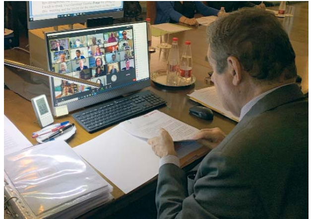
El Gobernador General, Leonardo Visconti di Modrone, durante el encuentro virtual con los Lugartenientes de Norteamérica.

En una entrevista para la página web de las Lugartenencias de América del Norte, el Gobernador General Leonardo Visconti di Modrone recordó a los miembros que durante algún tiempo no será posible hacer una peregrinación a Tierra Santa. Dado que la actividad económica de varios cristianos está vinculada al sector del turismo en los Santos Lugares, ¿cómo podemos ayudarlos para no privarlos de un apoyo tan importante? La invitación - que se extiende a todas las Lugartenencias - es asignar parte de lo que habríamos gastado en la peregrinación a una cuota de solidaridad: de esta manera se podrá seguir ofreciendo la ayuda necesaria a los más afectados por la crisis económica provocada por la emergencia sa-