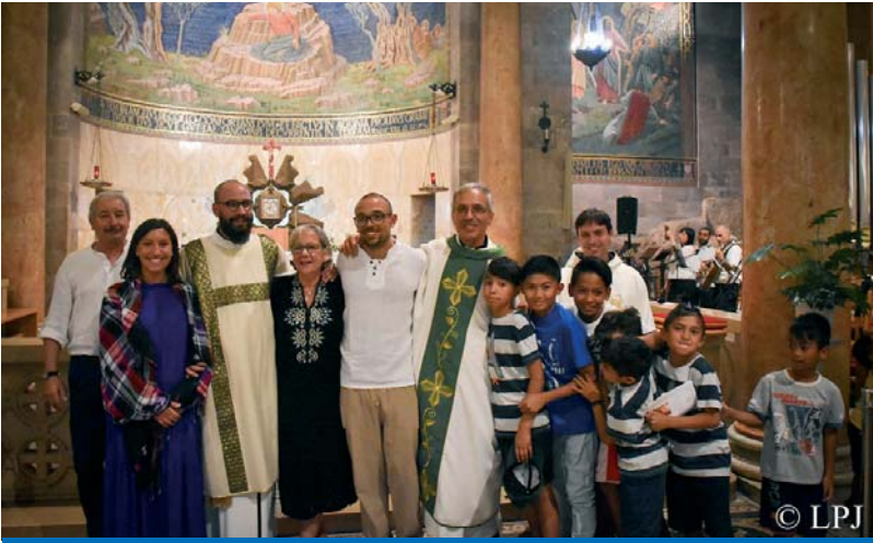
Con la ayuda de la Orden del Santo Sepulcro, el Vicariato de Santiago para los católicos de habla hebrea y el Vicariato de Migrantes y Solicitantes de Asilo han organizado la traducción de textos litúrgicos y bíblicos para las comunidades católicas de habla hebrea.

Por último, a medida que se acerca el verano, con el distanciamiento social que nos exigirá ser creativos en la búsqueda de formas de vivir las relaciones de la mejor manera posible, mencionemos el hermoso proyecto de actividades de verano con jóvenes, financiadas por la Orden, que en el año 2019 permitió a 29 parroquias de Jordania, 4 de Israel, 12 de Palestina, 5 grupos del Vicariato de Santiago y otros 5 de la Youth of Jesus' Homeland organizar campamentos de verano de dos a cuatro semanas de duración, para 7.000 jóvenes y niños. Los campamentos de verano son una excelente oportunidad para socializar, crecer en la fe y crear comunidades para todos los jóvenes, especialmente para aquellos que provienen de zonas de tensión o que viven en situaciones de desventaja y que a menudo tienen menos oportunidades.