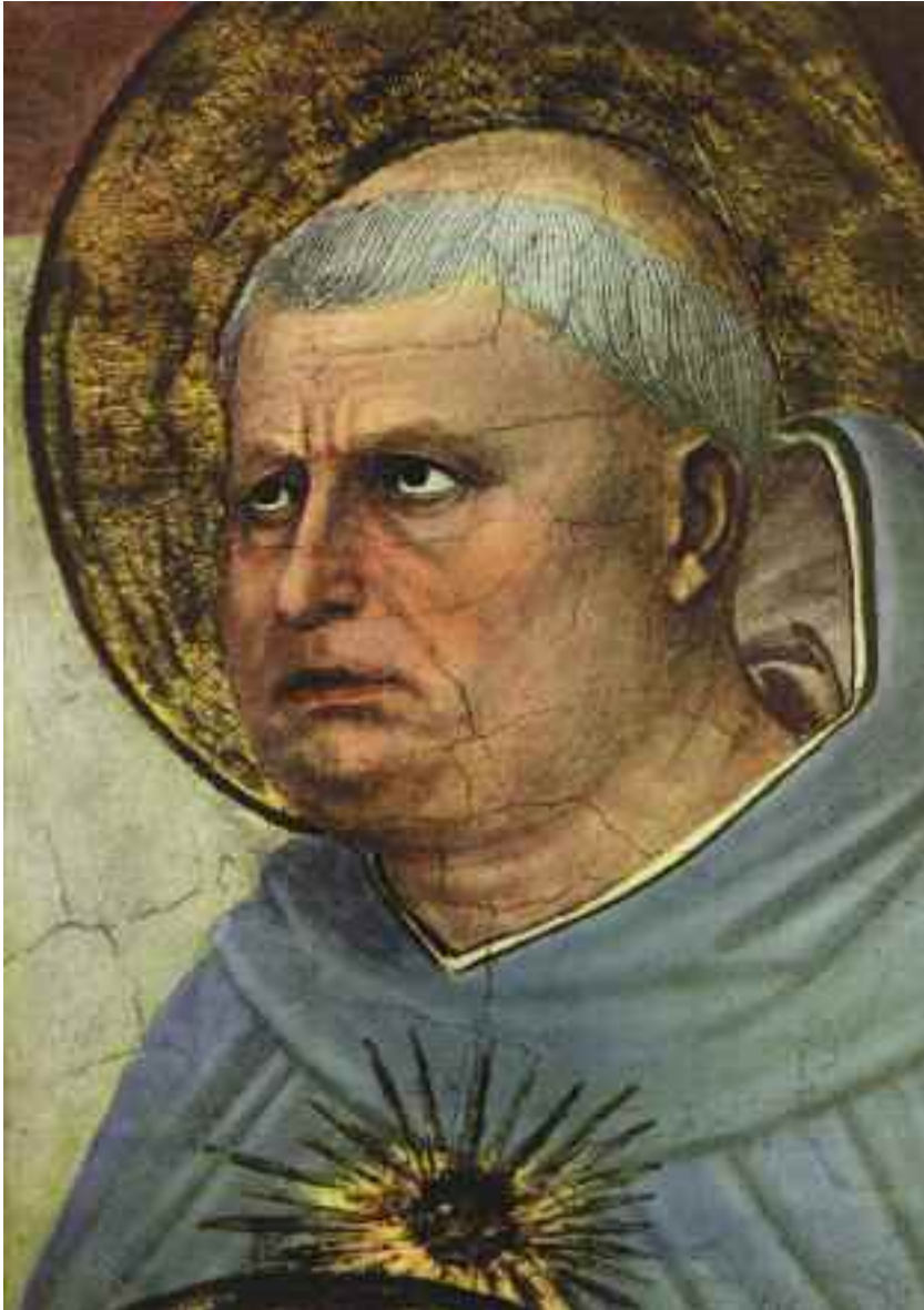
San Tommaso d'Aquino, opera di San Giovanni da Fiesole detto Beato Angelico, Crocifissione e patriarchi, santi e beati (particolare), sala del capitolo, museo di San Marco, Firenze, dipinto murale, 1441-1442.