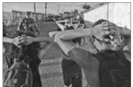
Dimostranti fermati durante i disordini a Fortaleza