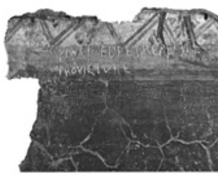
Graffiti tracciati dai pellegrini sull'intonaco della «memoria apostolorum» sull'Appia