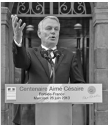
Il premier francese, Jean-Marc Ayrault

A richiamare l'attenzione sulle stime della Corte dei Conti è stato anche il premier francese, Jean-Marc Ayrault, il quale ha voluto sottolineare la gravità del momento. «Penso che per il 2013, purtroppo, a causa dell'assenza di crescita, ciò che dice la Corte dei Conti sia vero; ma alla fine dell'anno vedremo» ha detto il premier. Che la situazione non sia delle migliori per l'economia d'Oltralpe è testimoniato anche dagli ultimi dati sulla fiducia dei consumatori, scesi ai minimi record a giugno e passata da 79 a 78 punti.