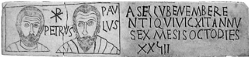
Lastra funeraria con i volti di Pietro e Paolo (catacomba di Sant'Appollonia)