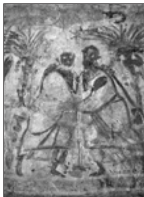
L'abbraccio tra Pietro e Paolo nella catacomba dell'exigna Chiaraviglio presso San Sebastiano

In questo motto possiamo intravedere tutte le ragioni della riabilitazione e della tematizzazione della figura di Paolo, che assurge a immagine-simbolo del doctor gentium , del vas electionis , del sapiens architectus , del magister scientiarum .