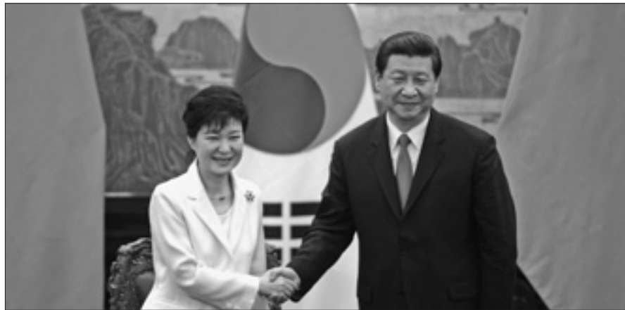
Il presidente sudcoreano, Park Geun Hye, e il capo dello Stato cinese, Xi Jinping

PECHINO, 28. Cina e Corea del Sud hanno annunciato ieri la loro ferma volontà di arrivare alla denuclearizzazione della Corea del Nord. L'annuncio è stato dato nel corso della visita in Cina del capo dello Stato della Corea del Sud, Park Geun Hye. «Siamo d'accordo nel continuare ad operare per la denuclearizzazione della penisola coreana e preservare la pace e la stabilità» ha dichiarato il presidente cinese, Xi Jinping. «Le due parti hanno convenuto di non permettere alla Corea del Nord di utilizzare il nucleare in alcune circostanze» ha sottolineato Park Geun Hye. «La situazione nella penisola è attualmente in una fase di evoluzione positiva» ha detto Xi Jinping.