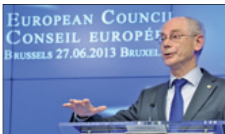
Il presidente del Consiglio Ue, Herman Van Rompuy

L'intesa tra i leader non era affatto scontata a causa soprattutto dell'opposizione di Londra, che in effetti chiedeva il rispetto del precedente accordo, siglato in febbraio, e dunque della garanzia degli «sconti» particolari di cui gode la Gran Bretagna in sede di bilancio Ue. Soddisfatto anche il presidente del Consiglio dei ministri italiano, Enrico Letta. «Riusciamo a ottenere più di quanto si pensava - ha dichiarato Letta - nel senso che c'è un'aggiun-