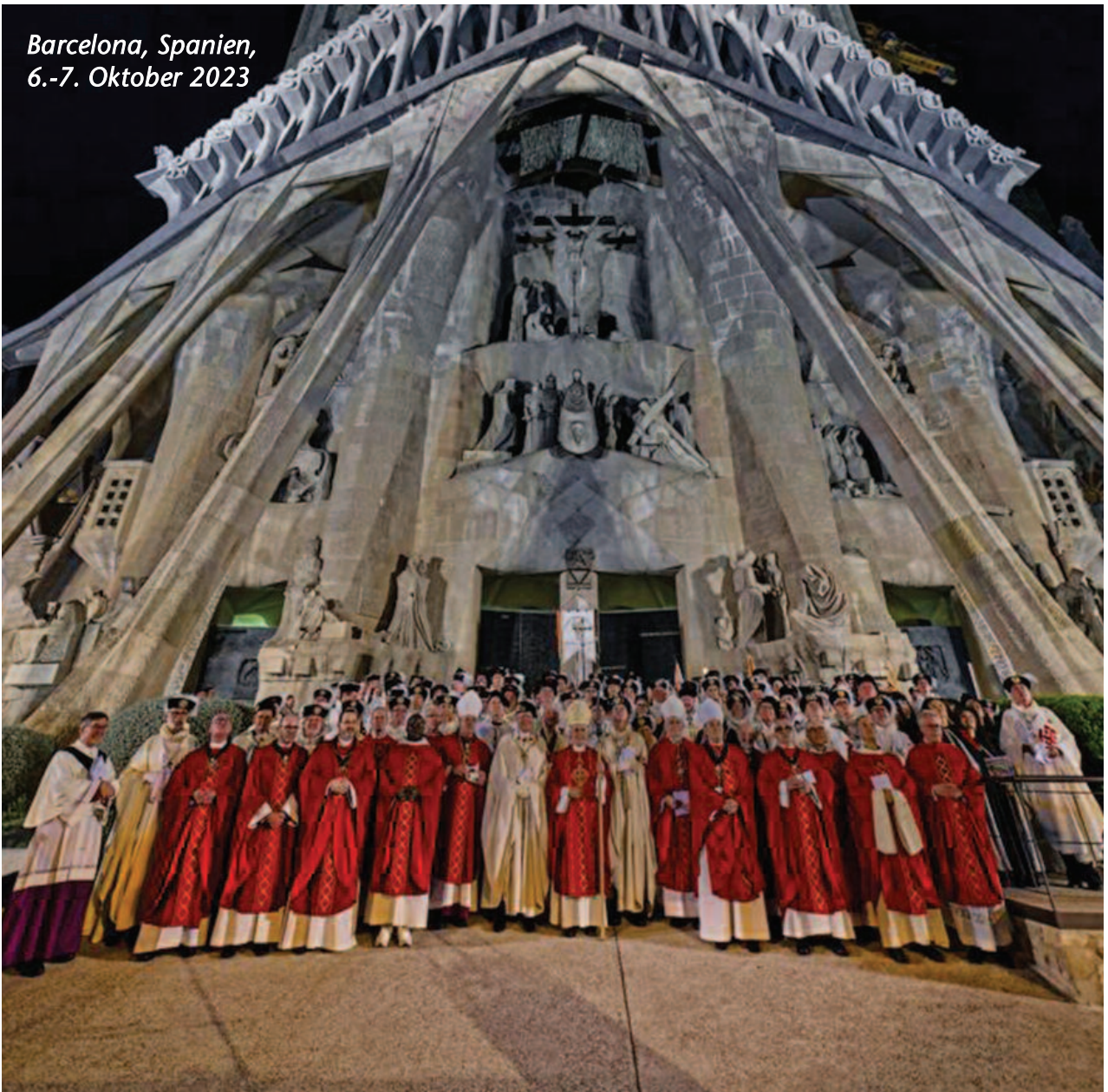
Barcelona, Spanien, 6.-7. Oktober 2023