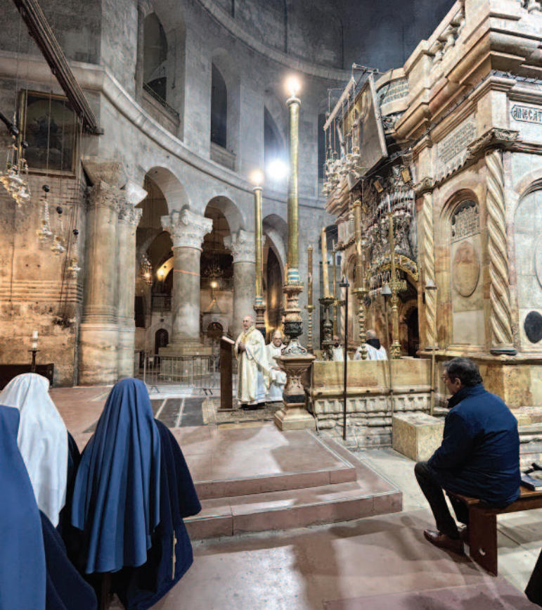
Der Großmeister feiert die Messe am Heiligen Grab.