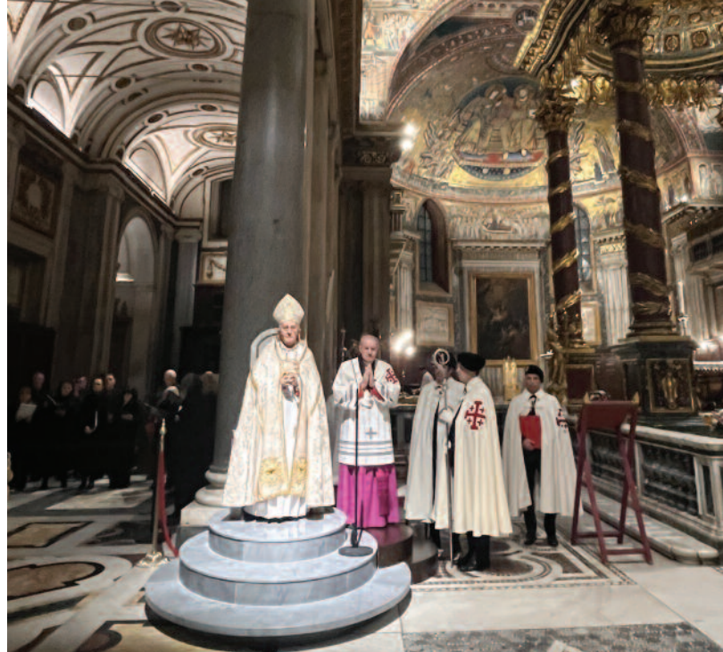
Rom, Italien, 15.-16. Dezember 2023