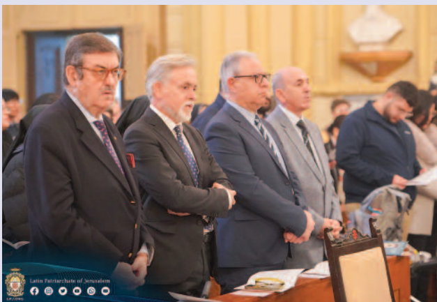
Die Messe zum Weltfriedenstag am Fest der Gottesmutter Maria wurde vom Großmeister in der Pro-Kathedrale des Lateinischen Patriarchats in Jerusalem konzelebriert.

Am vorletzten Tag dieser Wallfahrt gingen der Großmeister und seine beiden Reisegefährten auf den Spuren Christi durch die derzeit menschenleeren Straßen Jerusalems – in der Nähe der Wohnungen der in Not geratenen christlichen Familien, die sie einige Tage zuvor besucht hatten – insbesondere entlang der Via Dolorosa, und meditierten dabei jede Station des Kreuzweges. „Heute ist Golgatha in Gaza“, rief eine Frau aus, der sie begegneten, und flehte die Mitglieder des Ordens und ihre Freunde an, weiterhin für den Frieden im Heiligen Land zu beten und zu handeln. Am Nachmittag nahm die Delegation an der traditionellen Prozession teil, die von den Franziskanerbrüdern täglich in der Grabeskirche am Ort des Leidens, des Todes und der Auferstehung des Erlösers organisiert wird. In aller Schlichtheit unter den wenigen anwesenden Pilgern – mit einer brennenden Kerze in der Hand – betete