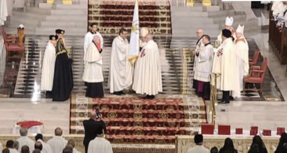
New York, USA, 13.-14. Oktober 2023