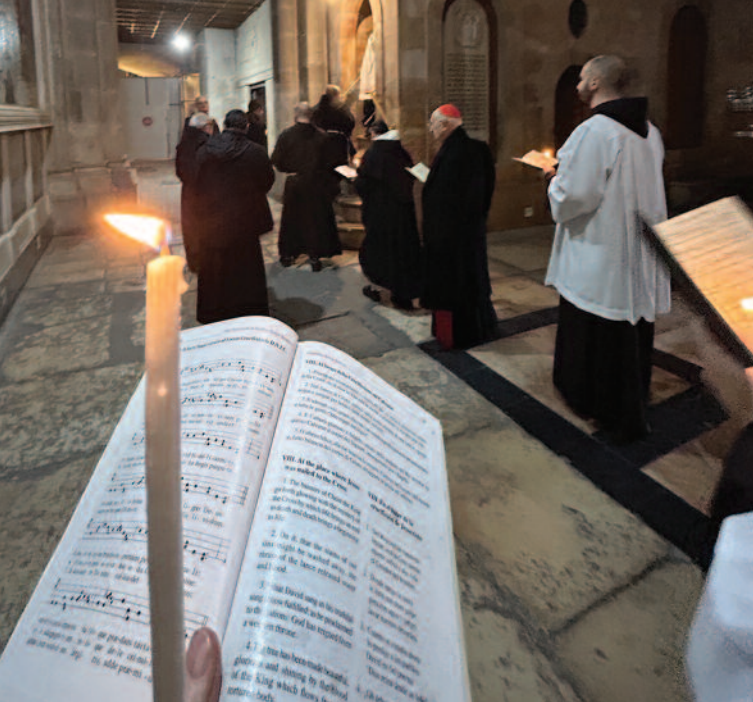
Kardinal Filoni nahm an einer Prozession teil, die die Franziskaner, die für die heilige Stätte zuständig sind, jeden Tag in der Grabeskirche organisieren, und die zu den Orten des Leidens, des Todes und der Auferstehung des Erlösers führt.

Kardinal Filoni am Fuße des Kalvarienbergs, in der Nähe des Steins der Salbung des Leichnams des Gekreuzigten, vor dem leeren Grab sowie an der mit einem großen Kreis auf dem Boden gekennzeichneten Stelle, an der Maria Magdalena dem Auferstandenen am Ostermorgen begegnet ist.