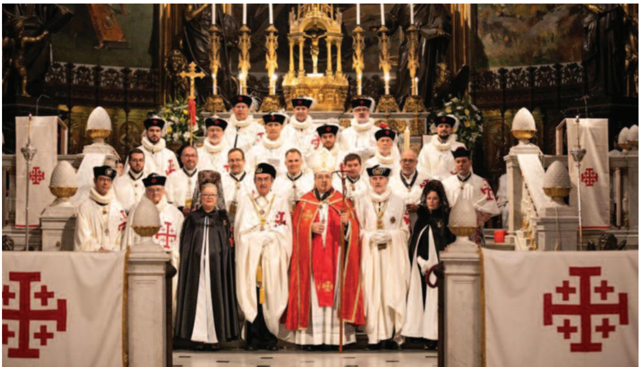
Madrid, Spanien, 27.-28. Oktober 2023