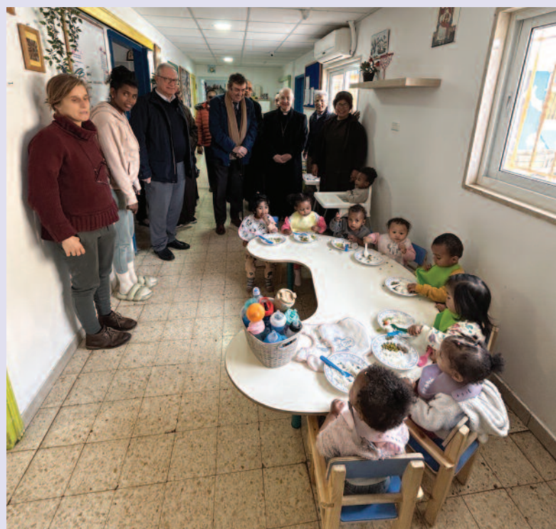
Besuch des Zentrums St. Rachel in Jerusalem, das dem Vikariat für Migranten und Asylsuchende untersteht.

Zum Abschluss dieser Wallfahrt für den Frieden fand im Patriarchat ein kleines Abschiedstreffen