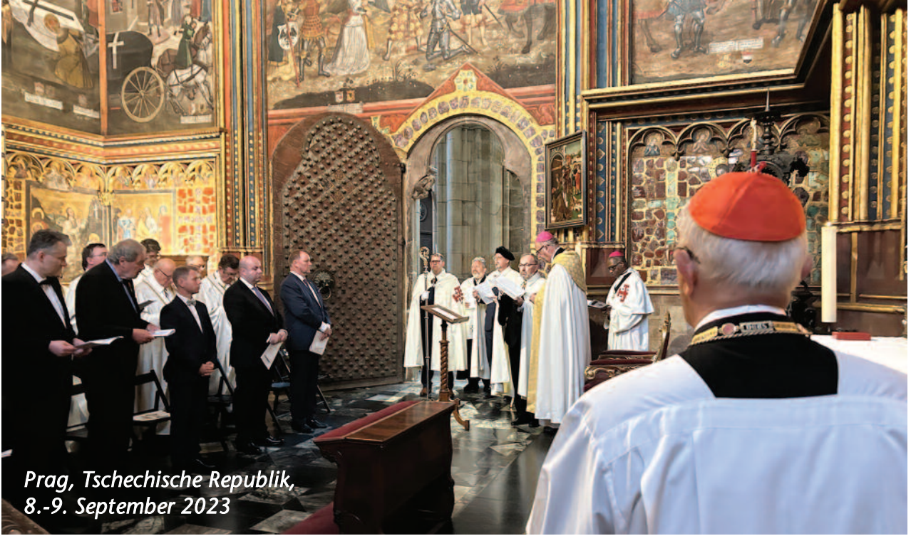
Prag, Tschechische Republik, 8.-9. September 2023