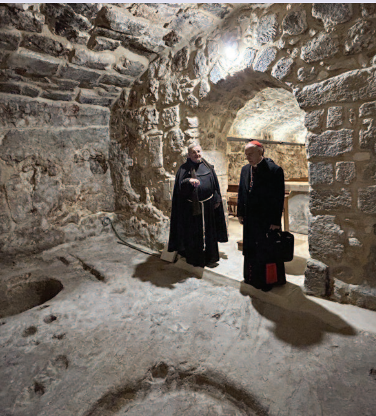
Besichtigung des „Schoßes“ der Grabeskirche mit einem Franziskanerbruder der Kustodie.

die für die Grabeskirche zuständig sind, und beabsichtigte die Arbeiten zur Restaurierung des Fußbodens in dieser heiligen Stätte, die allen Christen so sehr am Herzen liegt. Der Großmeister und der Generalgouverneur unterhielten sich lange mit diesen Ordensleuten, die seit Jahrhunderten in Gemeinschaft mit dem griechisch-orthodoxen und dem armenischen Klerus die katholische Präsenz in der Grabeskirche erhalten.