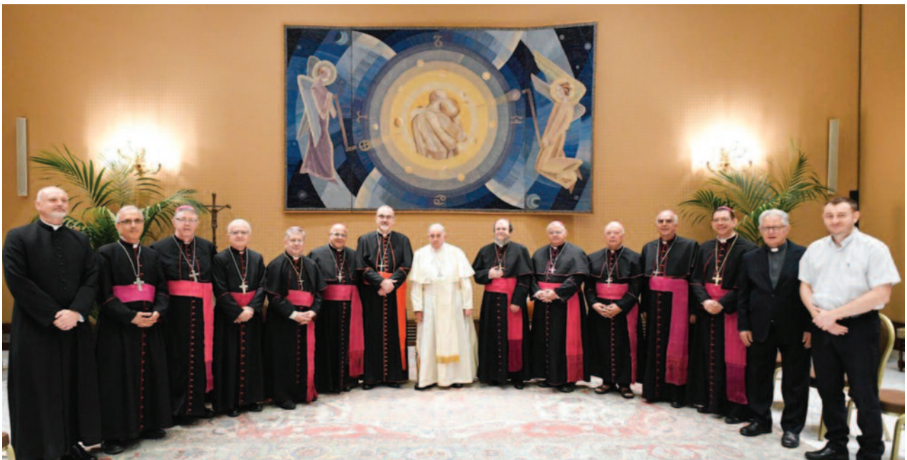
Foto de familia de los obispos del CELRA al final del encuentro con el papa, el cual fue presidido por el cardenal Pierbattista Pizzaballa, Patriarca latino de Jerusalén y Gran Prior de la Orden.

algunos contextos desembocan en enfrentamientos abiertos y destellos de guerra. El conflicto, en lugar de encontrar una solución equitativa, parece hacerse crónico, con el riesgo de que se extienda hasta incendiar toda la región. Esta situación ha causado miles y miles de muertos, enormes destrucciones,