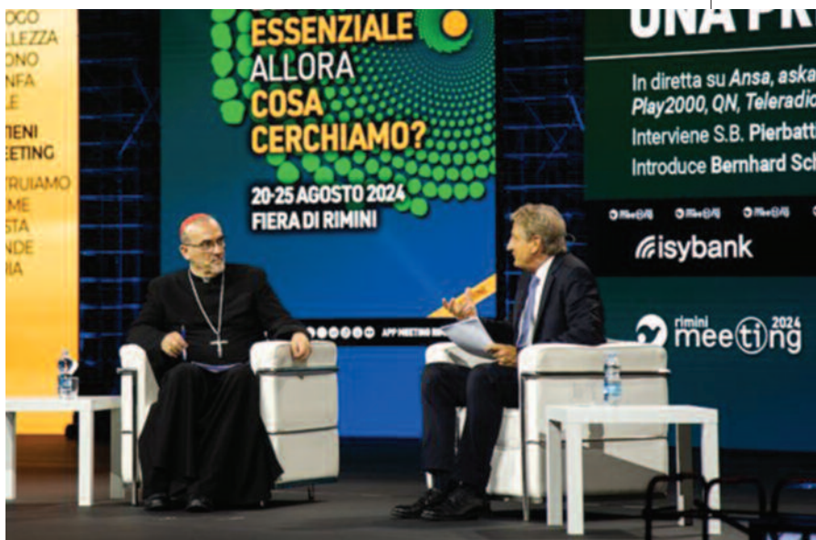
El cardenal Pizzaballa habló sobre la situación en Tierra Santa durante el Meeting para la amistad entre los pueblos, celebrado el pasado verano en Rimini.

A este respecto, las personas a menudo preguntan al cardenal Pizzaballa qué puede y debe hacer la Iglesia en esta situación. Su sincera y pragmática respuesta nos ayuda a posicionarnos: «Seamos honestos, nadie espera que la comunidad cristiana resuelva estos problemas. Políticamente, somos casi irrelevantes, si se me permite decirlo. [...] Lo primero es estar ahí. No caer en la tentación de querer desempeñar necesariamente un papel en estas situaciones, sino ser capaces de decir algo [...], algo veraz sobre lo que está sucediendo, algo con lo que la gente pueda identificarse, sin entrar en conflictos.