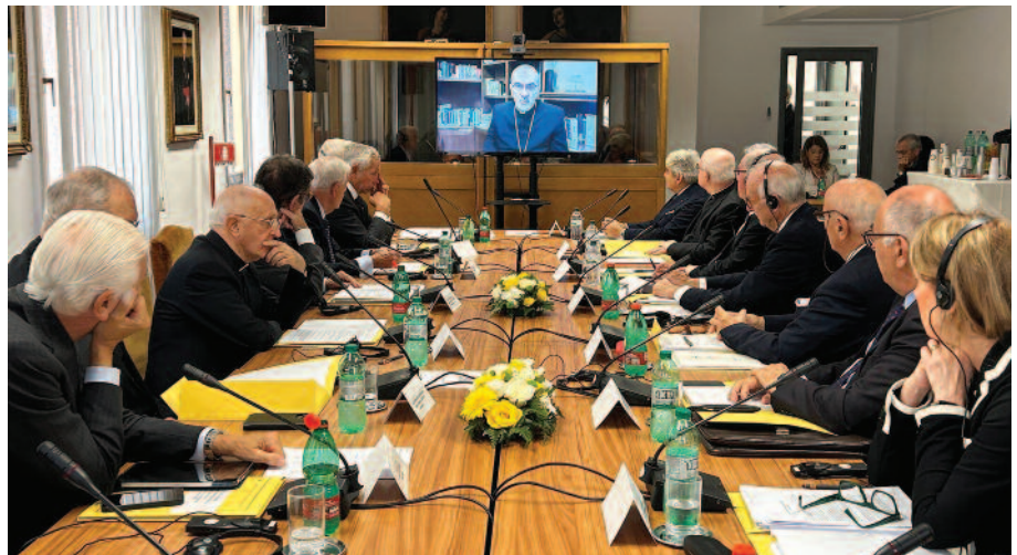
El Patriarca de Jerusalén, que se encontraba en Tierra Santa, se dirigió a los participantes de la reunión a través de un mensaje de vídeo en el que, ante todo, agradecía a la Orden su apoyo moral y espiritual.

El Patriarca de Jerusalén, que se encontraba en Tierra Santa, se dirigió a los participantes de la reunión a través de un mensaje de vídeo en el que, ante todo, agradecía a la Orden su apoyo moral y espiritual – «necesitamos vuestras oraciones» –, haciendo también referencia a la hermosa carta del papa a los católicos de Oriente Medio , publicada el 7 de octubre, en la que el santo padre invoca a la Reina de la Paz y declara que «la oración y el ayuno son las armas del amor que cambian la historia».