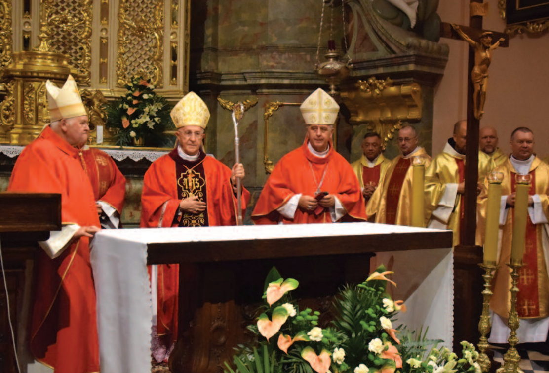
Misa presidida por el Gran Maestre de la Orden en Miechów.

da por el cardenal Filoni. «Desde hace siglos, esta basílica de Miechów es un lugar sagrado que invita a la reflexión sobre el misterio de nuestra Redención; es una mediación permanente sobre el misterio de la Muerte y la Resurrección del Señor y, litúrgicamente hablando, lo es aún más el día en que la Iglesia celebra la festividad de la Exaltación de la Cruz», compartió al principio de su homilía. En presencia de los Miembros de la Lugartenencia polaca de la Orden y de todos los participantes de las Jornadas de Jerusalén, celebradas en esta ciudad cada dos años desde 2010 con la intención especial de rezar por Tierra Santa, el Gran Maestre continuó: «Desde que la fe en el Resucitado, el Hijo de Dios, se predicó en esta noble tierra de Polonia, Dios mismo ha dirigido su mirada benévola hacia quienes la habitan. Históricamente, con la propagación de la veneración del Santo Sepulcro, en el siglo XVI, en Miechów, se quiso reproducir el Edículo de la Tumba de Cristo. En realidad, el Santo Sepulcro no solo representa uno de los muchos lugares, aunque significativos, de la vida de Jesús, sino el lugar simbólico que encierra el misterio de la dolorosa Pasión y de la gloriosa Resurrección; el lugar en el que se cumplió toda la misión de Cristo, como Jesús mismo afirmó: "Si el grano de trigo no cae en tierra y muere, queda infecundo; pero si muere, da mucho fruto" (Jn 12,24)».