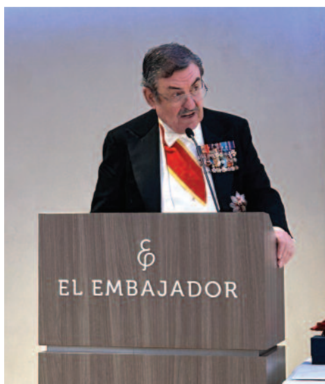
El Gobernador General en Santo Domingo, durante la fundación de la Orden en el Caribe, la pasada primavera.

Este proceso ha beneficiado especialmente a las Lugartenencias medianas y pequeñas, o geográficamente más aisladas, las cuales han extraído enseñanzas, apoyo y elementos de reflexión de la experiencia de las Lugartenencias más estructuradas y con una mayor proyección internacional. Así pues, ha habido ciertas experiencias interesantes de ceremonias comunes entre varias Lugartenencias de la misma zona geográfica, encuentros y mesas redondas, así como peregrinaciones con-