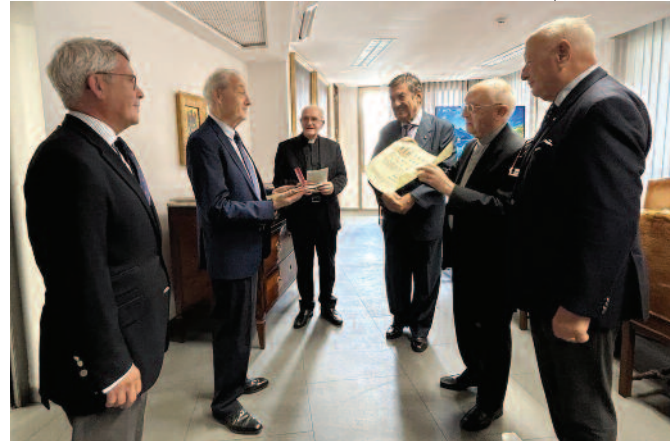
El Lugarteniente de Honor para Francia recibió la Palma de Oro en Roma por parte del Gran Maestro, en presencia del Gobernador General.