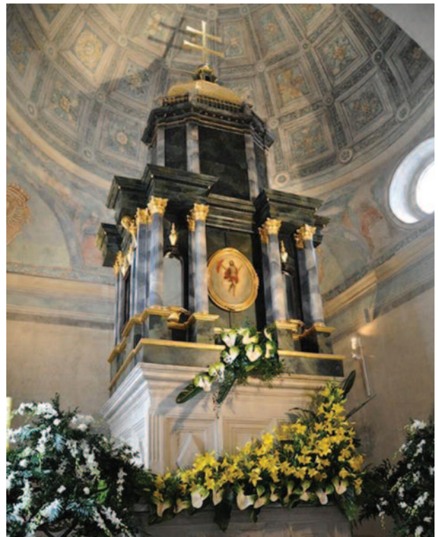
La reproducción del Edículo del Santo Sepulcro en Polonia, que data del siglo XVI, atrae a una importante peregrinación que tiene lugar cada dos años.

Este año, las Jornadas de Jerusalén se celebraron de forma conjunta con la fiesta de la Exaltación de la Cruz, especialmente querida por los Miembros de la Orden y presidi-