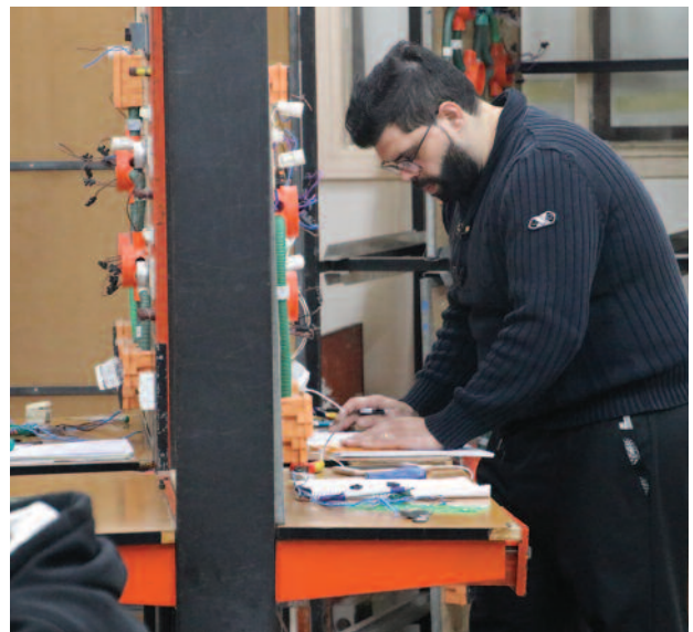
Las prácticas remuneradas de los jóvenes de Tierra Santa se financian gracias al apoyo de la Orden.

Esta ayuda ha permitido reducir muchas cargas financieras de personas que se encon-