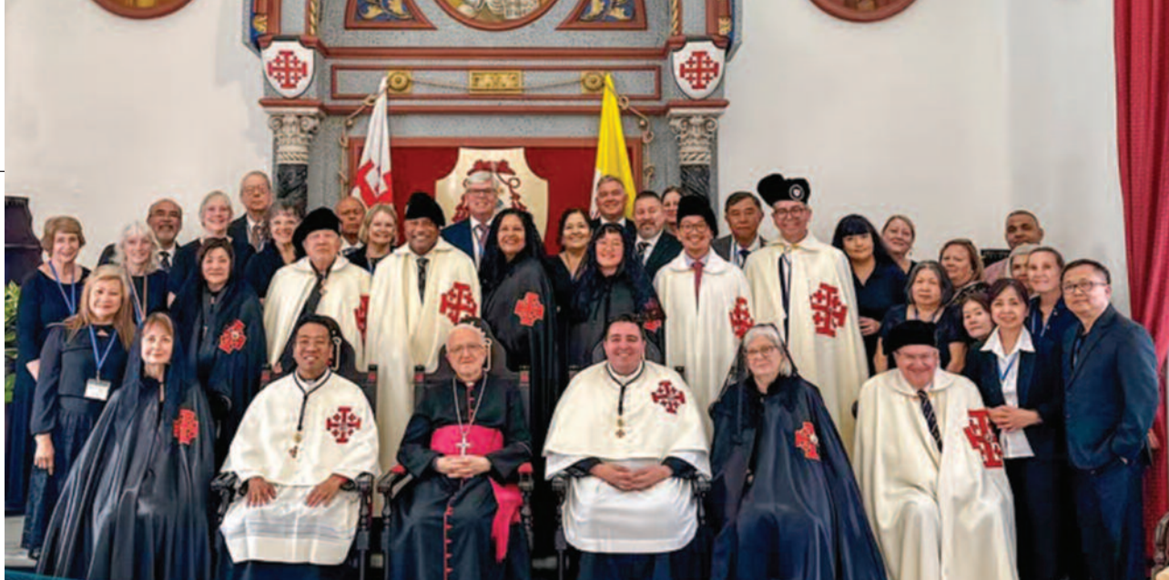
Una delegación de la Lugartenencia del suroeste de los Estados Unidos fue recibida en el Patriarcado de Jerusalén.

mido al formar parte de la Orden del Santo Sepulcro y que puede manifestarse de múltiples formas— también se exprese de manera tangible: visitándolas y acompañándolas para que los cristianos que sufren no se sientan solos.