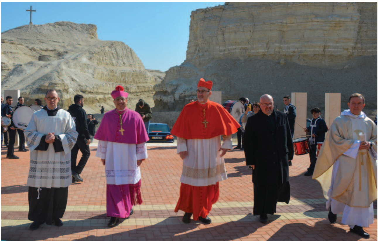
LATIN PATRIARCHATE OF JERUSALEM

en el seminario del Patriarcado latino de Jerusalén antes de ser nombrado sacerdote el 9 de julio de 1998 en Madaba. Desde 2016 a 2019, fue director de las escuelas del Patriarcado latino en Palestina e Israel, periodo en el que colaboró