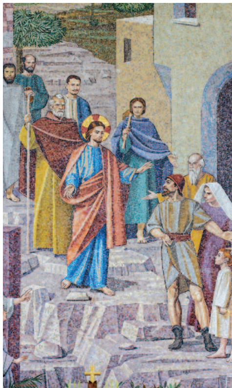
Tras la resurrección de Lázaro, Jesús habría pasado un tiempo en Taybeh con sus apóstoles.