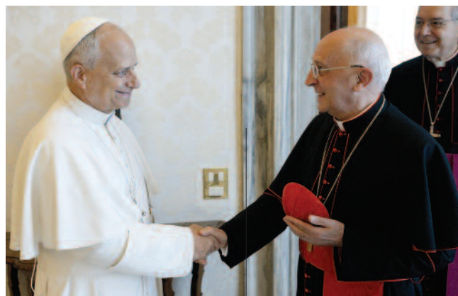
El papa León XIV recibió en audiencia privada al Gran Maestro y al asesor de la Orden el 24 de junio de 2025.

León XIV ha declarado que escogió ese nombre en honor a dos grandes papas. El primero es León Magno (siglos IV-V), teólogo, exégeta y extraordinario pastor de