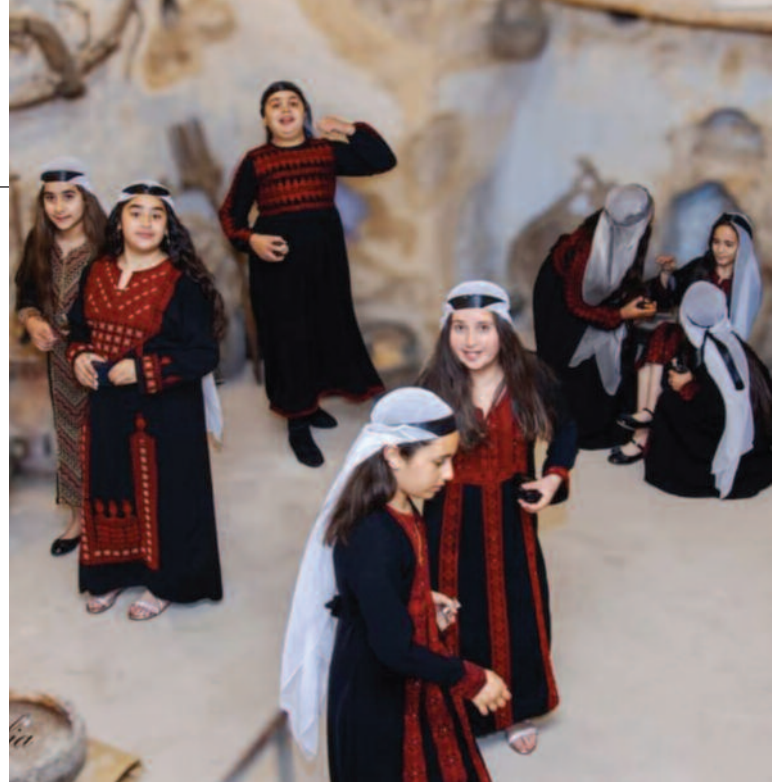
Niños de Taybeh representando una escena, vestidos con trajes típicos palestinos.

El segundo proyecto concierne a la resi-