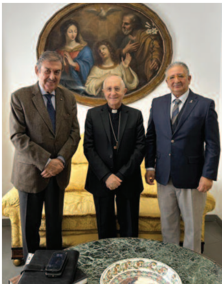
El embajador del Estado de Palestina ante la Santa Sede, Su Excelencia Issa Jamil Kassissieh, visitó el pasado 6 de octubre al Gran Maestro y al Gobernador General de la Orden.

Este año se conmemora el décimo aniversario de la firma del acuerdo global entre el Estado de Palestina y la Santa Sede, suscrito el 26 de junio de 2015. A través de sus 32 artículos, el acuerdo establece los aspectos esenciales de la vida de los cristianos en Palestina, destacando sus derechos, en particular la libertad de la Iglesia católica — como señaló el comunicado de prensa difundido en junio de 2025 por la Embajada del Estado de Palestina ante la Santa Sede— «para llevar a cabo su misión religiosa, moral, educativa, social y caritativa». El acuerdo permitió a la Iglesia organizar sus asuntos internos, concediendo al tribunal eclesiástico latino la libertad de aplicar el derecho canónico, sobre la base del recono-