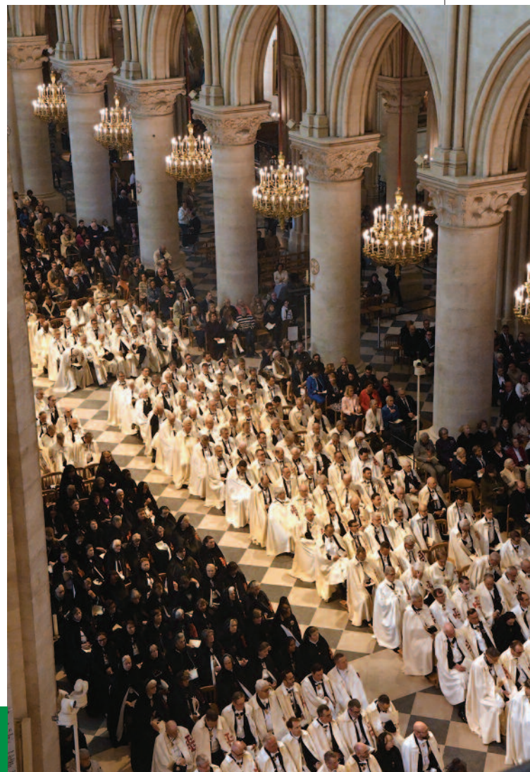
La celebración de las investiduras en Notre Dame de París reunió a numerosos Caballeros y Damas.

Las ceremonias de investidura celebradas en París proporcionaron una serie de encuentros entre los miembros del Gran Magisterio y los lugartenientes, todo ello dentro del marco de diálogo que el Gobernador General fomenta y promueve. Durante el banquete final en