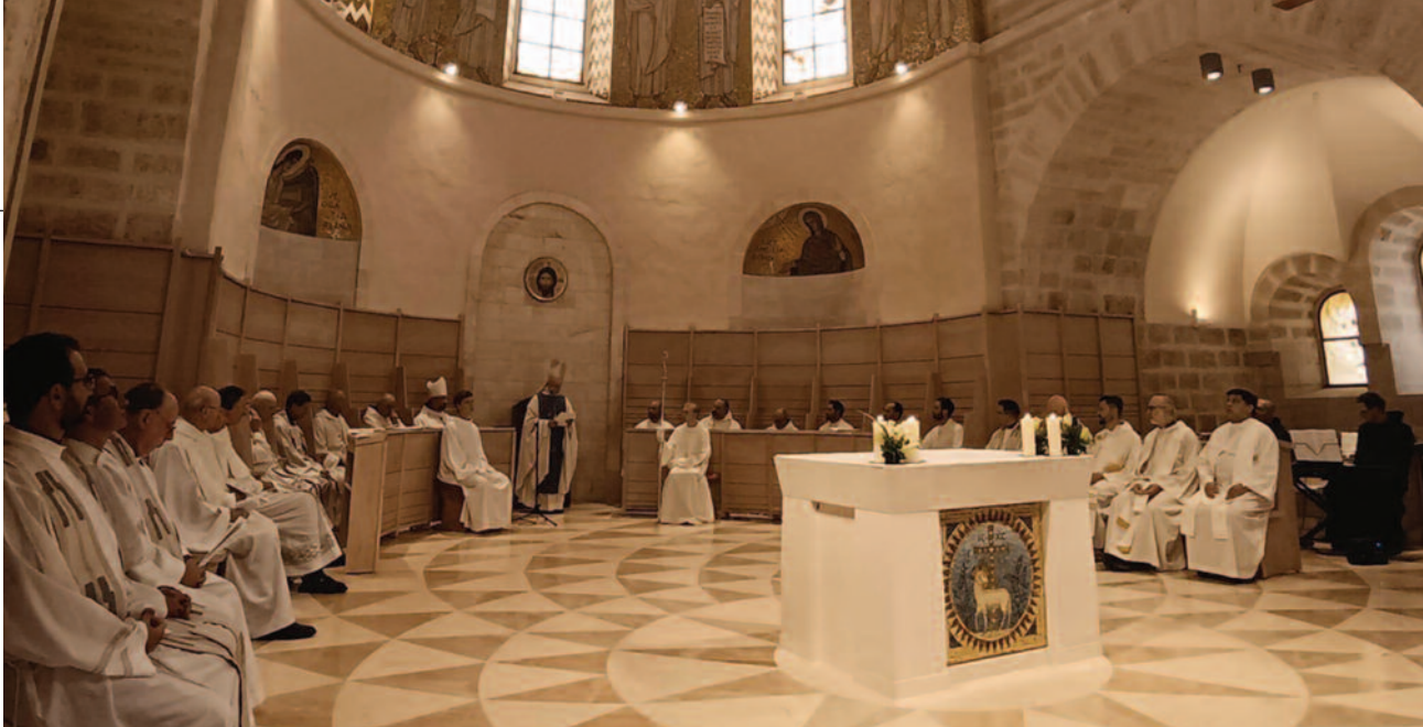
Misa de la Asunción presidida por el cardenal Filoni en el monasterio de la Dormición de Jerusalén.

nuestro camino, a nuestra vida, la Asunción de María? ¿En qué sentido nos concierne? ¿Es simplemente una "doctrina" o significa algo más?».