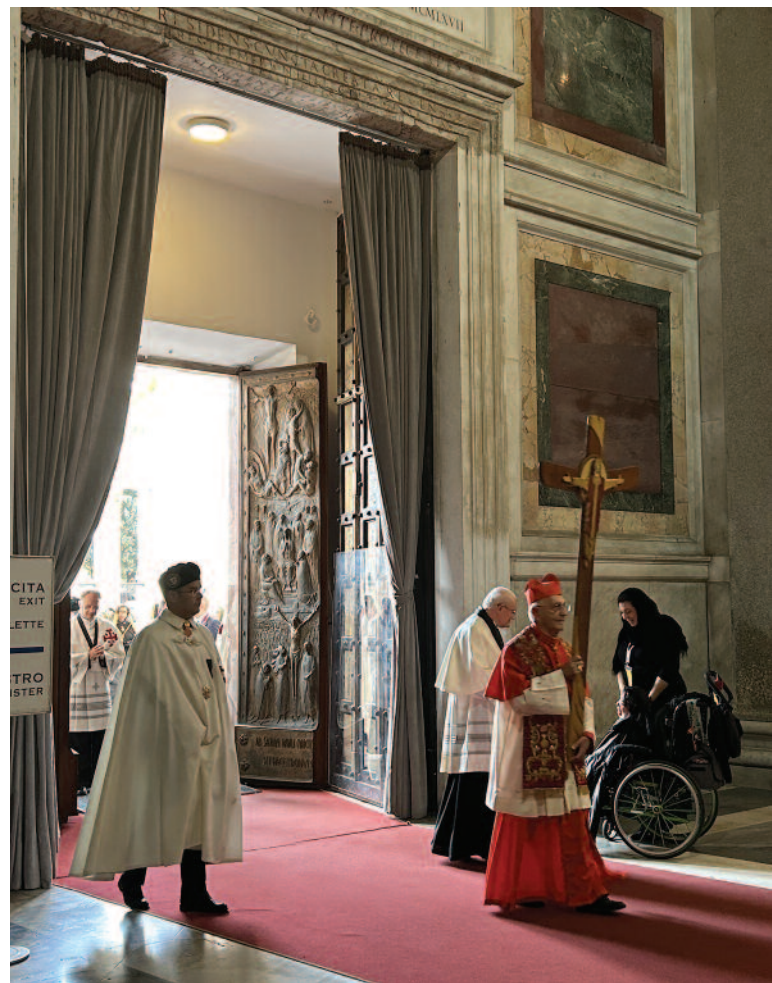
El 21 de octubre, primer día de la peregrinación, tras el paso por la Puerta Santa, los miembros de la Orden participaron en la misa celebrada en la basílica de San Pablo Extramuros y presidida por el cardenal Fernando Filoni.

Tras ser recibidos el martes 21 de octubre en sus alojamientos de la ciudad romana por los miembros del personal del Gran Magisterio, los participantes en la peregrinación jubilar asistieron esa misma tarde a la misa de apertura, celebrada en la basílica de San