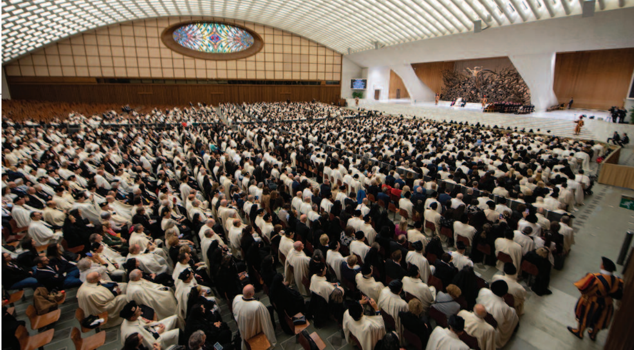
El 23 de octubre, los peregrinos de la Orden se reunieron en la sala Pablo VI para la audiencia pontificia, durante la cual el papa reconoció su vocación y los fortaleció en su misión al servicio de la Iglesia Madre en Tierra Santa.

da que prestan, sin hacer ruido y sin publicidad, a las comunidades de Tierra Santa, apoyando al Patriarcado latino de Jerusalén en sus diversas actividades: el seminario, las escuelas, las obras caritativas y de asistencia, los proyectos humanitarios y formativos, la universidad, la ayuda a las Iglesias, con intervenciones especiales en momentos de mayor crisis, como ocurrió durante la pandemia de COVID-19 y en los trágicos días de la guerra.