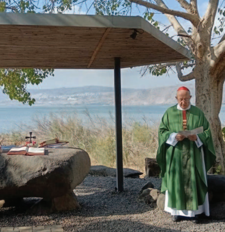
El cardenal Filoni durante una misa a orillas del lago de Tiberiades, celebrada con intenciones por la paz en Tierra Santa.