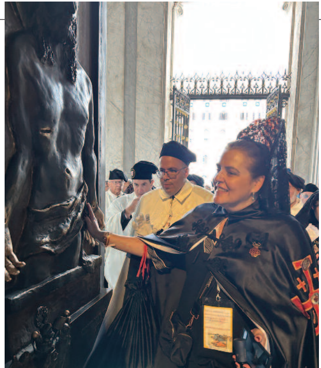
En la basílica de Santa María la Mayor, los peregrinos de la Orden, guiados por el Gran Maestre, rezaron el rosario tras cruzar en procesión la Puerta Santa durante la tarde del 22 de octubre.

el reconocimiento de la maternidad divina de María por el Concilio de Éfeso en 431, destacando que el misterio de la Encarnación nos abre a la salvación.