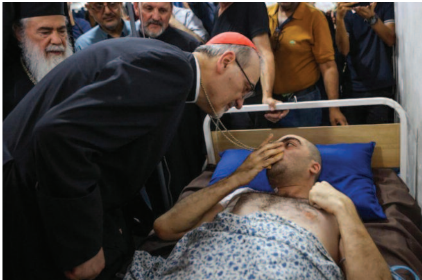
Cuando el cardenal Pizzaballa se acercó a los heridos en Gaza, uno de ellos besó la cruz pectoral del patriarca, uniendo así sus sufrimientos a los de Cristo.

«Estamos destrozados, profundamente heridos por lo que estamos viviendo, así como por el clima de odio que esta violencia genera y que, a su vez, produce más odio en un círculo vicioso imposible de romper», declaró el cardenal Pizzaballa, Gran Prior de nuestra Orden, en un mensaje en vídeo desde Jerusalén con motivo de la vigilia de oración «Paz para Gaza», organizada en Roma el 22 de septiembre —antes del alto el fuego— por la Comunidad de Sant'Egidio. Su análisis continúa teniendo resonancia: «Hemos dejado vía libre a numerosos extremistas de ambos bandos. Pero también veo a muchas personas buenas: todas aquellas que se comprometen y actúan con justicia a costa de sacrificios personales, israelíes, palestinos, judíos, cristianos, musulmanes... aquí no se trata de pertenencia, sino, ante todo, de humanidad».