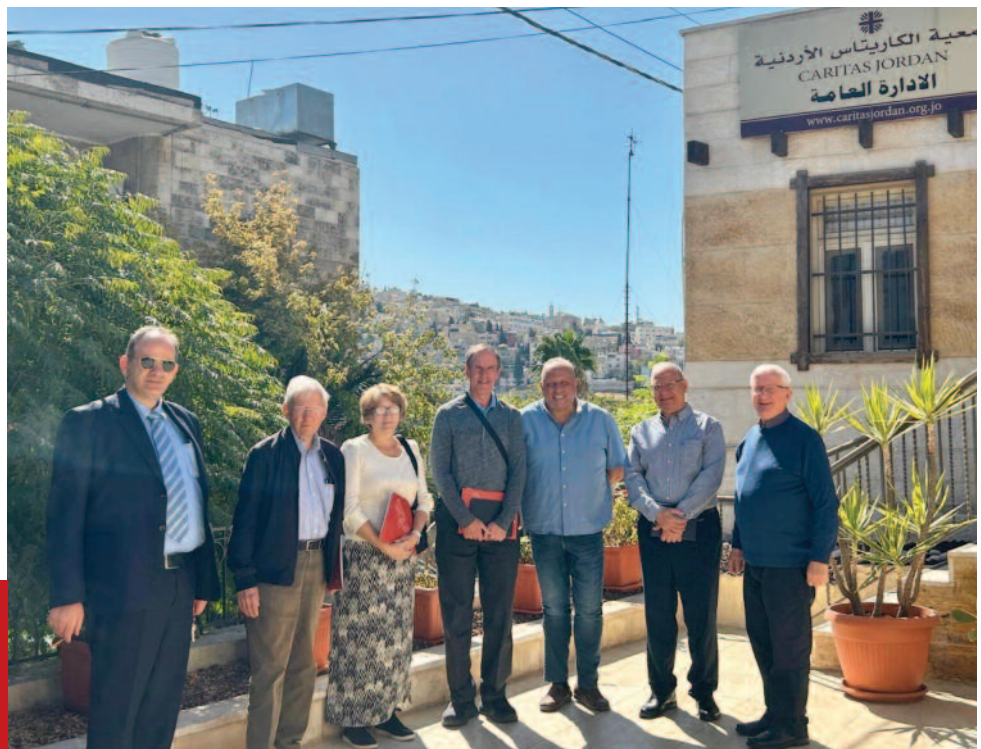
Miembros de la Comisión para Tierra Santa durante su visita a la sede de Cáritas en Jordania.

Más tarde, los tres miembros de la Comisión fueron recibidos en la parroquia y la escuela de Jubeiha, cerca de la capital, Amán. Esta pequeña ciudad ocupa un lugar especial en el corazón de los Caballeros y Damas de la Orden del Santo Sepulcro, que a lo largo de los años han contribuido de manera significativa a la construcción de la nueva iglesia