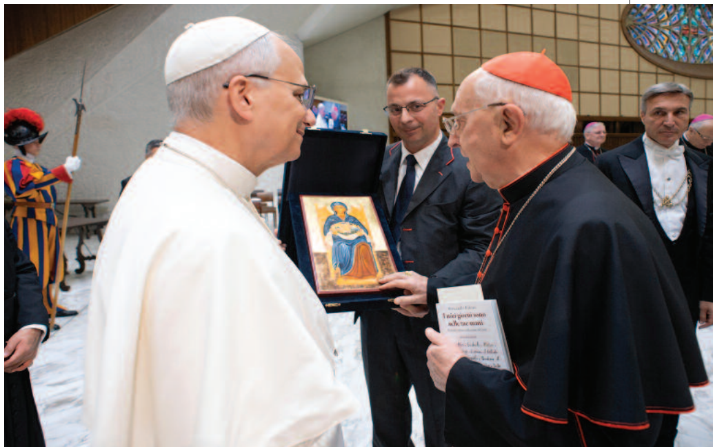
En nombre de la Orden, el Gran Maestre entregó al santo padre el icono de Nuestra Señora de Palestina, realizado especialmente para él en Tierra Santa por una hermana de la comunidad de Beit Jamal.

El santo padre los recibió el pasado 23 de octubre en la sala Pablo VI, durante el tercer día de su peregrinación, justo antes de la celebración de la misa en la basílica de San Pe-